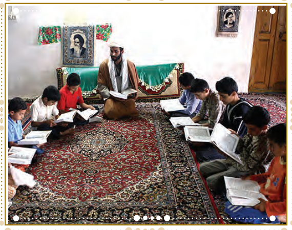
انس با قرآن کریم در استان فارس، شهرستان داراب