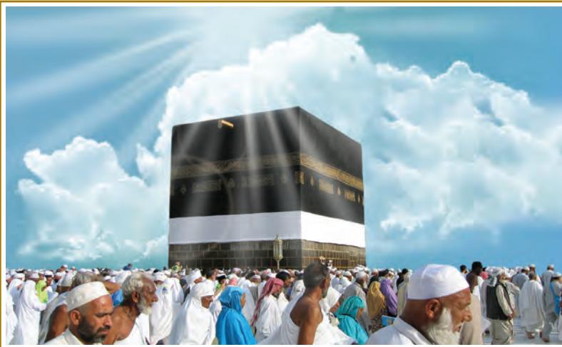
حج، نماد برادری و وحدت مسلمانان جهان