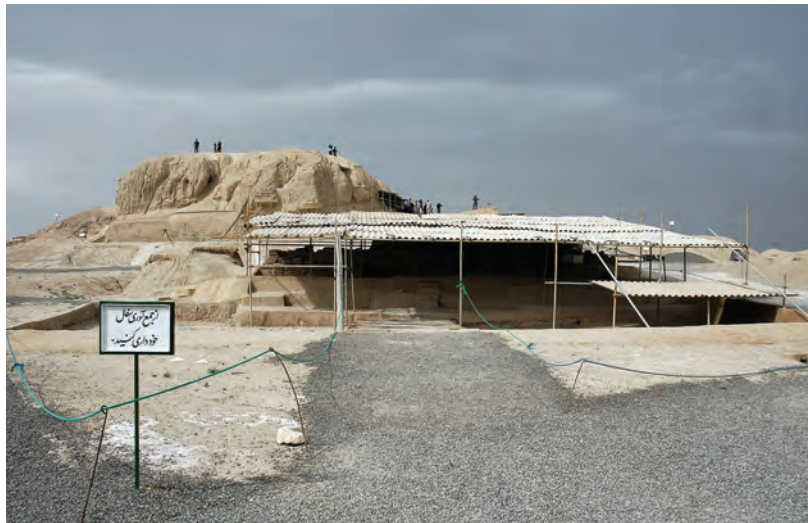
شکل ۲-۶- تپه‌های باستانی سیلک - کاشان

بیشتر این مکان‌ها مربوط به هزاره چهارم تا هزاره ششم قبل از میلاد است. برخی از مکان‌های باستانی استان عبارت‌اند از: تپه سیلک کاشان، محوطه باستانی اریسمان در شهرستان نطنز (هزاره چهارم ق. م)، تپه آشنا در چادگان (هزاره ششم ق. م)، تپه چغا حسن در گلپایگان (هزاره پنجم ق. م)، گورتان اصفهان (هزاره چهارم ق. م)، سبا در ورزنه (هزاره سوم ق. م)، تپه جوزک تیران و کرون (هزاره چهارم ق. م)، تل شاهی سمیرم (هزاره چهارم ق. م) و تپه‌های ننادگان فریدن (هزاره چهارم ق. م).