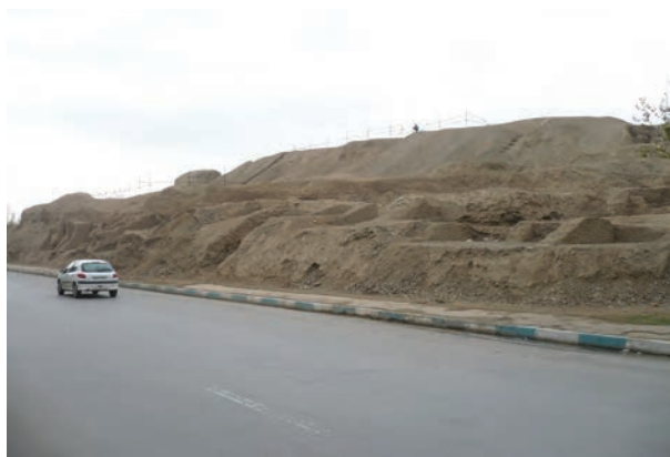
شکل ۴-۶- تپه اشرف باقی مانده بنای کهن سارویه (نزدیک پل شهرستان اصفهان)

از اصفهان پیش از اسلام؛ یعنی زمان هخامنشیان، اشکانیان و ساسانیان اطلاعات زیادی در دست نیست و آثار چندانی برجای نمانده است ولی آنچه مسلم است، از آنجا که استان اصفهان از لحاظ جغرافیایی در مرکز ایران واقع شده است، وجود دشت‌های وسیع و حاصل خیز و در برخی از مناطق، منابع آب فراوان - مانند زاینده رود - جاذبه‌هایی در آن ایجاد کرده است؛ از این رو، تمامی حاکمان در طول تاریخ نسبت به آن توجه ویژه داشته‌اند و تلاش همه‌جانبه آنها این بوده است که تسلط خود را بر این منطقه حفظ کنند. در دوران اساطیری، وجود داستان‌هایی مانند ماجرای کاوه آهنگر همان چهره آزاده که علیه ستم ضحاک قیام کرد و به کمک فریدون ملت ایران را از بند اسارت آزاد کرد و هم اکنون نیز در منطقه فریدن در روستایی به نام مشهد کاوه، آرامگاهی منسوب به این قهرمان ملی دیده می‌شود، نشان از مرکزیت قدرت سیاسی در این قسمت کشور دارد. وجود دژی بسیار بزرگ همانند اهرام مصر به نام کهن‌دژ سارویه در حاشیه اصفهان امروزی که آثار آن تا هزار سال قبل هنوز برجای بوده و امروزه بخشی از آن در کنار پل شهرستان به نام تپه اشرف باقی مانده است و نیز بقایای آتشکده منسوب به عصر ساسانیان در ماربین اصفهان (کوه آتشگاه)، نمونه‌ای از آثار برجای مانده از پیش از اسلام است.