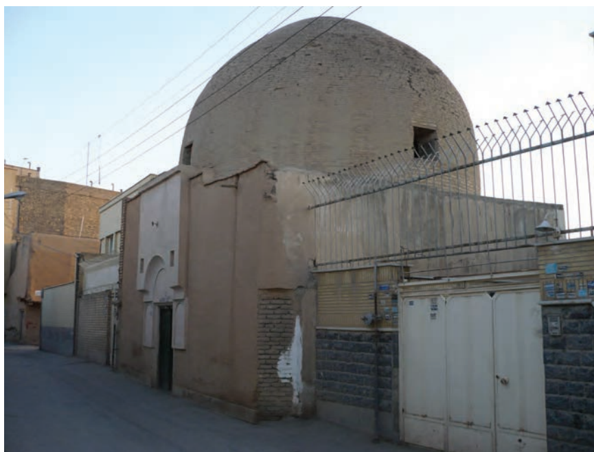
شکل ۱۳-۶- محل تدریس بوعلی سینا در اصفهان — خیابان ابن سینا

سلمان فارسی، یار صدیق پیامبر بزرگوار اسلام، از مردم این سامان بوده است و کاوه آهنگر، مبارز راه عدالت و آزادی، از مردم پرتیکان بود. در اوج درخشش تمدن اسلامی که ایرانیان از پیشگامان علوم و فنون اسلامی بودند، بسیاری از دانشمندان رشته‌های مختلف از این استان برخاسته یا زندگی علمی خود را در این سامان گذرانده‌اند. در قرن چهارم هجری قمری، شخصیت‌های برجسته‌ای چون حمزه اصفهانی، صاحب بن عباد، حافظ ابونعیم، ابن مسکویه، ابوالفرج اصفهانی، ابن سینا (گرچه در اصفهان متولد نشد ولی بیشتر آثار علمی او در این شهر شکل گرفت و شاگردان معروفی را در این شهر تربیت کرد) مدت زیادی به تألیف، پژوهش و تربیت شاگردان در این شهر پرداختند. از دوره سلجوقیان تا شروع دوره صفویه استان اصفهان علما و شعرای بسیاری را به خود دید که از آن جمله می‌توان به خواجه نظام‌الملک (مؤسس مدارس نظامیه)، راغب اصفهانی، عمادالدین کاتب، غیاث‌الدین جمشید کاشانی، جمال‌الدین عبدالرزاق و کمال‌الدین اسماعیل که هر کدام از مشاهیر عصر خود بوده‌اند، اشاره کرد.