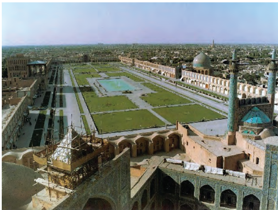
شکل ۹-۶- میدان امام (نقش جهان)

با مطالعه تاریخ صفویه درمی‌یابیم که شهر اصفهان پس از تأسیس این سلسله تا انتخاب آن به عنوان پایتخت، شهری آباد و پرجمعیت بوده است. شاه عباس اول صفوی در این اندیشه بود که پایتخت را از شمال غرب به مرکز ایران منتقل سازد تا از دشمن صفویان یعنی دولت عثمانی فاصله داشته باشد؛ از این رو، در سال ۱۰۰۰ هجری قمری، پایتخت را از قزوین به اصفهان منتقل کردند. تا سال ۱۱۳۵ هجری قمری، یعنی سال سقوط صفویه، اصفهان نه تنها در مرکز ایران بود بلکه تمام شرایط مورد نیاز برای یک پایتخت بزرگ را در خود داشت. به نظر شما، کدام شرایط برای پایتخت شدن اصفهان وجود داشت؟