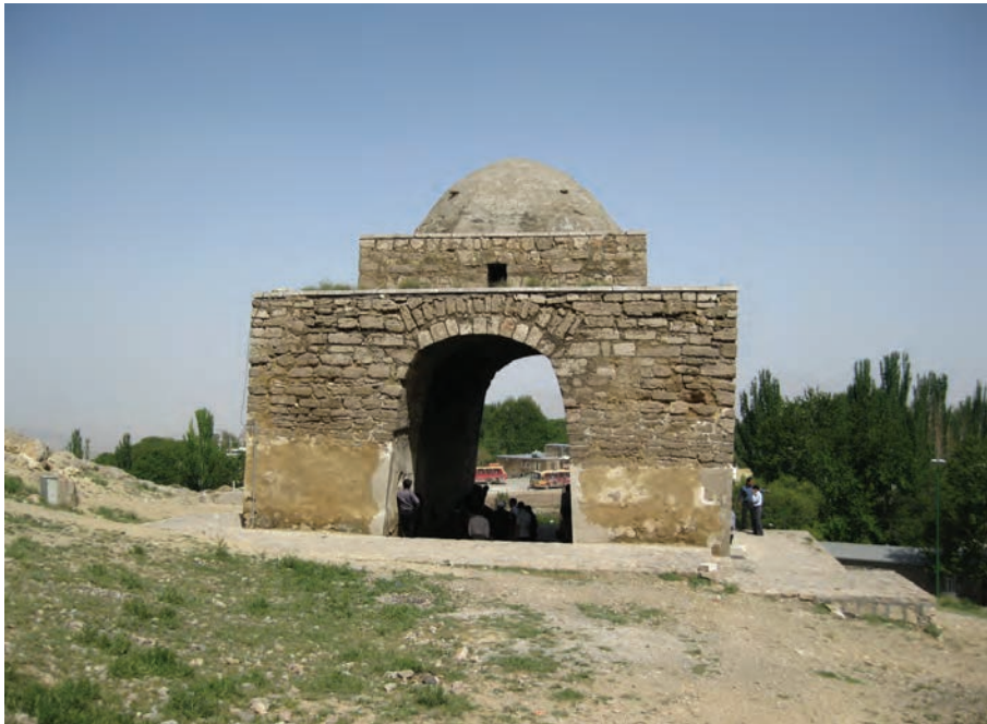
شکل ۵-۶ چهارطاقی نیاسر، مرکز انجام مراسم آیینی و اندازه‌گیری نجومی و تقویم‌نگاری در گذشته

در زمان فرمانروایی مادها، ایران دارای سه ایالت بزرگ بود که یکی از این ایالت‌ها بخش بزرگی از غرب استان اصفهان امروزی ایالتی به نام پارتاکن یا پارتیکان فریدن، فریدون‌شهر و چادگان امروزی به مرکزیت گابای (گی، جی) بود. اصفهان در زمان امپراتوری هخامنشیان به نام گابای یا گی شناخته می‌شده است. در عهد اشکانیان، حکومت ایران ملوک الطوائفی بود و بر هر یک از قسمت‌های مهم و وسیع آن، حکمرانی که لقب شاه داشت، فرمانروایی می‌کرد. در آن زمان، اصفهان یک ساتراپ (استان) به شمار می‌آمد. در دوره امپراتوری ساسانیان، آبادی‌های فراوانی در سطح استان اصفهان وجود داشته که آثاری از آنها باقی مانده است؛ مانند قلعه‌های متعدد ساسانی در آران و بیدگل (قلعه شرقی)، در سمیرم (تل نقاره و تل دهنه و گور دخمه طاقچه بت)، در فریدن (تپه خویگان)، در نائین (چهارطاقی شیرکوه، قلعه شیرکوه و چهارطاقی نخلک)، در نیاسر کاشان (چهارطاقی نیاسر)، در اصفهان (بنای آتشگاه و پل شهرستان) و بسیاری آثار دیگر. در این زمان، شهر اصفهان را سپاهان یا محل تجمع سپاه می‌نامیدند که واژه اصفهان از آن گرفته شده است. سپاهان محل سکونت و قلمرو خاندان‌های مهم حاکم و فرمانروایان و دژ مستحکمی برای ساسانیان بود.