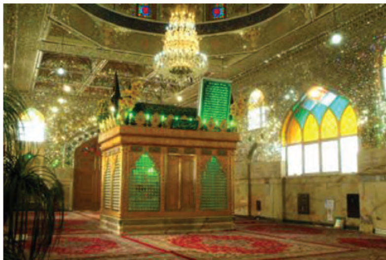
شکل ۶-۶- امامزاده اسحاق - خوراسگان

اسلام از سال ۲۳ هجری قمری وارد استان اصفهان شد. مردم این استان همانند دیگر ایرانیان از دین اسلام استقبال کردند. وجود بقاع سادات و امامزادگان در جای جای این استان، نشان از عشق و ارادت دیرینه این مردم نسبت به پیامبر بزرگوار اسلام و خانواده گرانقدر آن حضرت دارد.