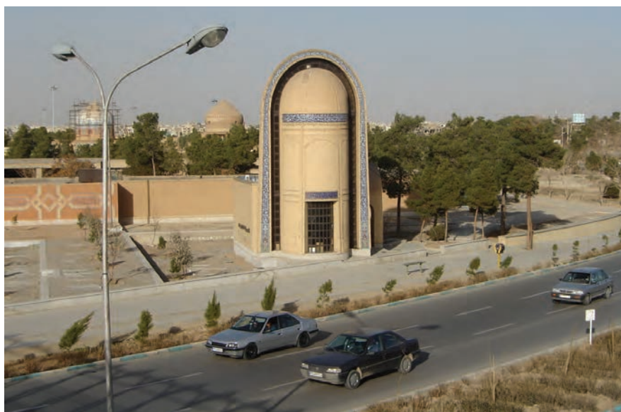
شکل ۱۴-۶- مقبره دانشمند بزرگ بانو مجتهده امین - تخت فولاد اصفهان

علاوه بر مردان نام‌آور در تاریخ این استان بزرگ، بانوانی در صحنه علم، هنر و اخلاق در دامن این استان پرورش یافته‌اند که می‌توان به بزرگانی چون ام‌الفارسیه (اولین ایرانی مسلمان)، فاطمه جوزدانی، آمنه بیگم مجلسی، مریم بانو نائینی، هما امامزاده (اولین پزشک زن ایرانی از شهرضا)، بی‌بی‌جان کاشانی و بانو مجتهده امین اشاره کرد.