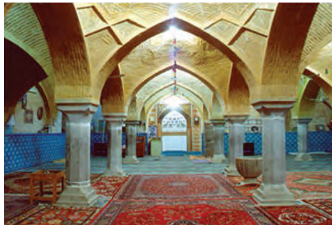
شکل ۷-۶- مسجد جامع شهرضا باقی‌مانده از زمان سلجوقیان

کوشش کردند. بناهای بسیاری ساخته شد که هنوز بسیاری از آن‌ها پابرجاست. همچنین احداث چهارباغ ملکشاهی، آثار بسیار ارزشمند معماری و هنر اسلامی به‌ویژه در مسجد جامع اصفهان مانند گنبد نظام‌الملک و گنبد تاج‌الملک که به نظر باستان‌شناسان جهانی از آثار اعجاب‌انگیز محسوب می‌شوند، مسجد جامع اردستان، مسجد جامع زواره، مسجد جامع شهرضا، مسجد جامع گلپایگان نیز از جمله آثار ارزشمند معماری این دوره است.