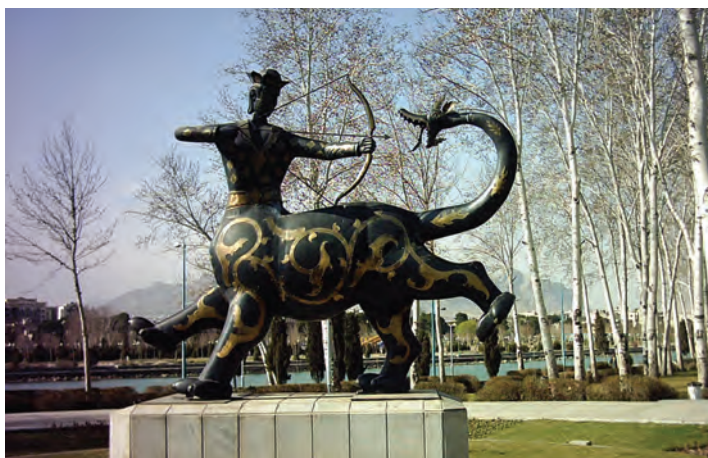
شکل ۳-۶- نماد شهر اصفهان. این تندیس نشانه چیست؟

از اصفهان پیش از اسلام؛ یعنی زمان هخامنشیان، اشکانیان و ساسانیان اطلاعات زیادی در دست نیست و آثار چندانی برجای نمانده است ولی آنچه مسلم است، از آنجا که استان اصفهان از لحاظ جغرافیایی در مرکز ایران واقع شده است، وجود دشت‌های وسیع و حاصل خیز و در برخی از مناطق، منابع آب فراوان - مانند زاینده رود - جاذبه‌هایی در آن ایجاد کرده است؛ از این رو، تمامی حاکمان در طول تاریخ نسبت به آن توجه ویژه داشته‌اند و تلاش همه‌جانبه آنها این بوده است که تسلط خود را بر این منطقه حفظ کنند. در دوران اساطیری، وجود داستان‌هایی مانند ماجرای کاوه آهنگر همان چهره آزاده که علیه ستم ضحاک قیام کرد و به کمک فریدون ملت ایران را از بند اسارت آزاد کرد و هم اکنون نیز در منطقه فریدن در روستایی به نام مشهد کاوه، آرامگاهی منسوب به این قهرمان ملی دیده می‌شود، نشان از مرکزیت قدرت سیاسی در این قسمت کشور دارد. وجود دژی بسیار بزرگ همانند اهرام مصر به نام کهن‌دژ سارویه در حاشیه اصفهان امروزی که آثار آن تا هزار سال قبل هنوز برجای بوده و امروزه بخشی از آن در کنار پل شهرستان به نام تپه اشرف باقی مانده است و نیز بقایای آتشکده منسوب به عصر ساسانیان در ماربین اصفهان (کوه آتشگاه)، نمونه‌ای از آثار برجای مانده از پیش از اسلام است.