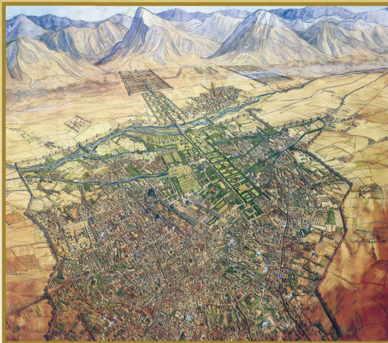
شهر اصفهان — صفویه