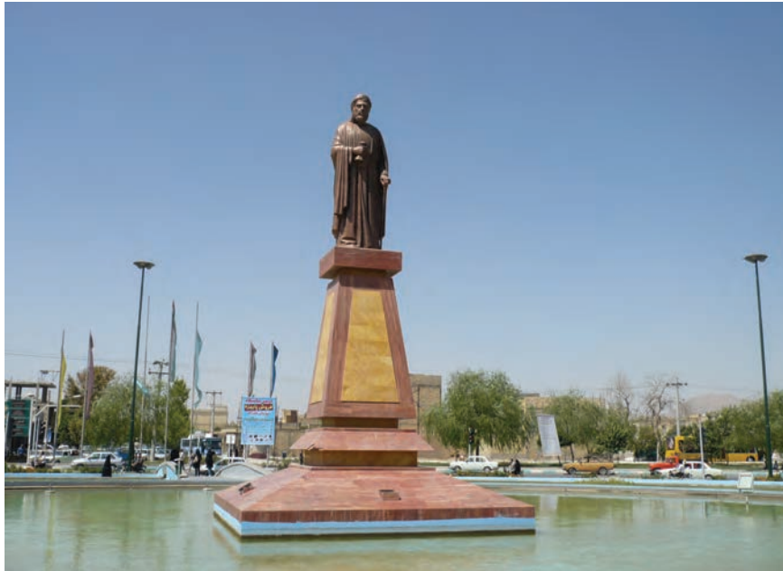
شکل ۱۰-۶ تندیس شیخ بهایی (ورودی شهر نجف آباد)

به غیر از شهر اصفهان در سایر شهرها و حتی روستاهای استان نیز آثاری از دوره صفویه به چشم می خورد؛ مثلاً کاشان، خوانسار، نجف آباد (ایجاد شهر در زمان صفویه)، کوهپایه و نائین.