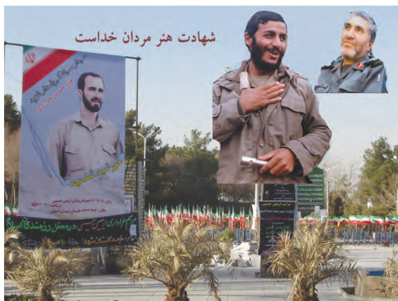
شکل ۱۶-۶- تصویر برخی از سرداران شهید استان اصفهان

مردم استان در سال‌های دفاع مقدس ضمن حضور فعال و مؤثر در بسیاری از عملیات‌ها (فرماندهی لشکر امام حسین، تیپ نجف اشرف، تیپ کربلا) در پشتیبانی از جبهه‌ها و رزمندگان اسلام (در قالب کاروان‌های وحدت و شهید بهشتی) نقش تعیین‌کننده داشته‌اند. امام درباره مردم این استان می‌فرماید: در کجای دنیا می‌توانید جایی را مانند اصفهان پیدا کنید. تقدیم ۲۳ هزار شهید و ۴۱ هزار جانباز و ۳۴۶۰ آزاده سرافراز بخشی از ایثارگری‌ها و افتخارات مردم این استان محسوب می‌شود. وجود سرداران افتخارآفرین و حماسه‌ساز همانند شهید حاج حسین خرازی (فرمانده لشکر امام حسین «ع»)، شهید ابراهیم همت (فرمانده لشکر محمد رسول‌الله تهران)، شهید مصطفی رسانی‌پور، شهید عبدالله میثمی، شهید آقابابایی، شهید احمد کاظمی و بزرگان دیگری در عرصه دفاع مقدس همگی نشان از حضور افتخارآمیز مردم استان در میدان‌های تعیین سرنوشت ملت ایران دارد.