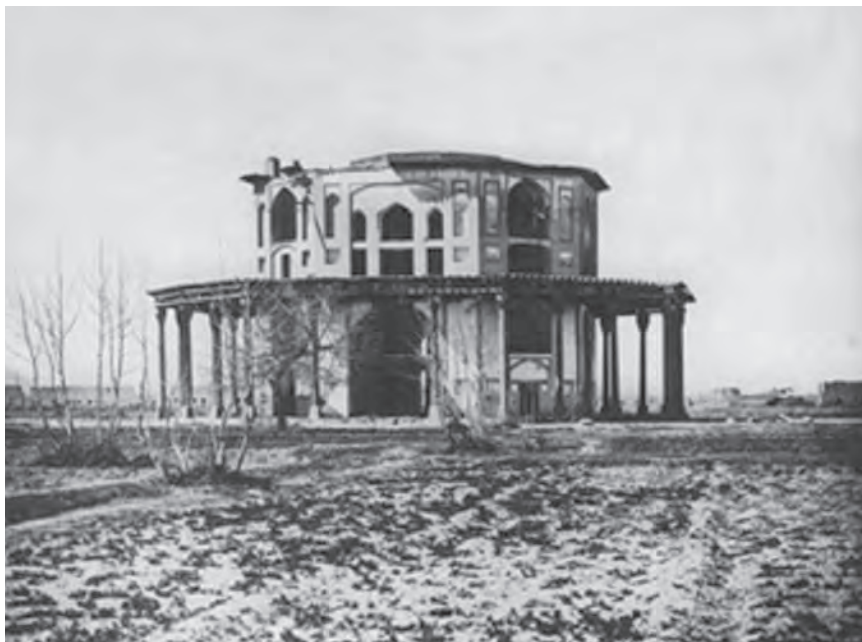
شکل ۱۱-۶ کاخ نمکدان که در زمان قاجاریه از بین رفته است.

به غیر از شهر اصفهان در سایر شهرها و حتی روستاهای استان نیز آثاری از دوره صفویه به چشم می خورد؛ مثلاً کاشان، خوانسار، نجف آباد (ایجاد شهر در زمان صفویه)، کوهپایه و نائین.