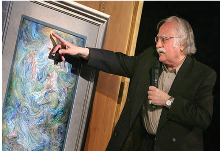
شکل ۱۵-۶- استاد محمود فرشچیان نقاش و طراح معروف معاصر