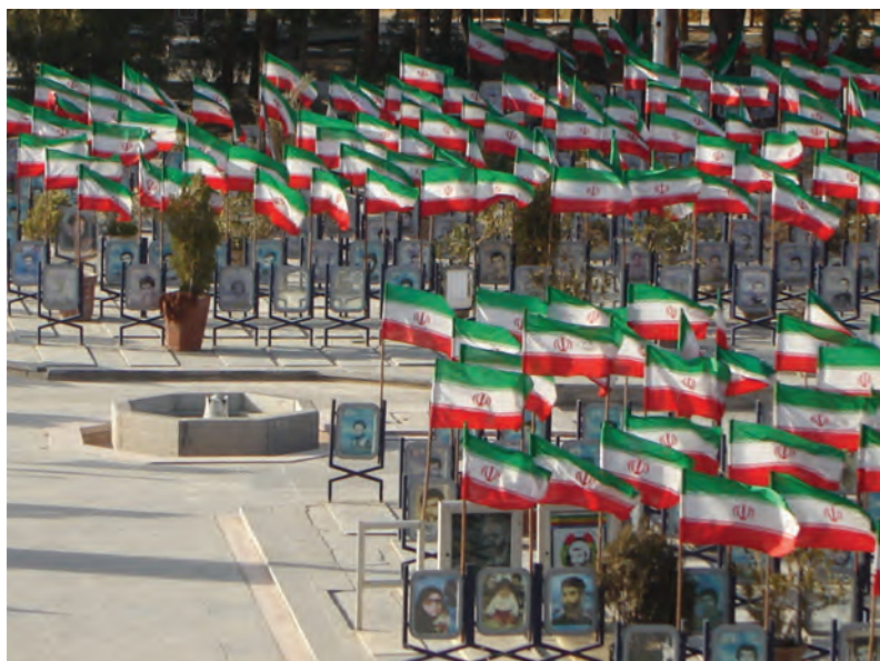
شکل ۱۷-۶- نمایی از گلستان شهدای اصفهان

مجموعهٔ چنین ارزش‌های کم‌نظیر تاریخی، فرهنگی و اجتماعی اصفهان باعث شد تا این شهر در سال ۱۳۸۵ از سوی سازمان کنفرانس اسلامی، به عنوان پایتخت فرهنگی جهان اسلام انتخاب شود. هم‌چنین در حال حاضر به عنوان پایتخت فرهنگ و تمدن ایران اسلامی نامگذاری شده است. جهت حفظ و گسترش این میراث ارزشمند چه باید کرد؟