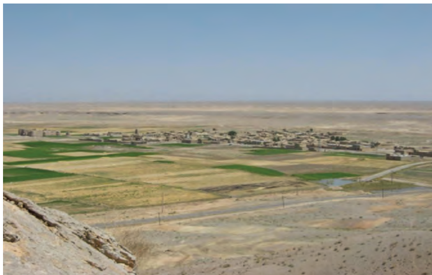
شکل ۱۳-۲- روستایی در منطقه جرقویه، این روستا چه شکلی دارد؟