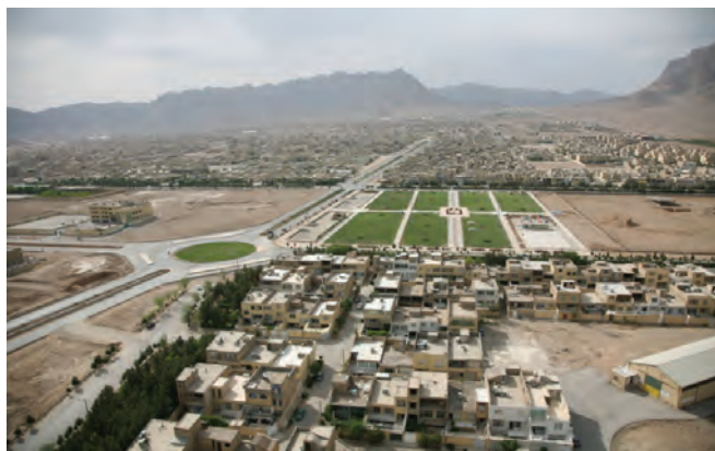
شکل ۱۱-۲- بافت جدید شهری (منظرهٔ خمینی شهر)