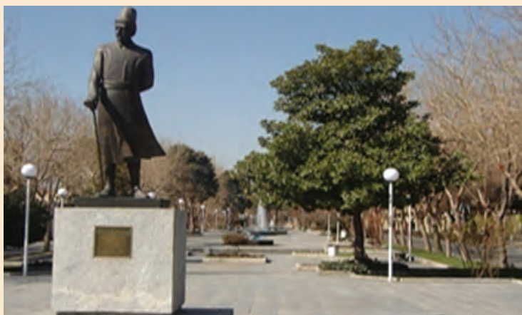
شکل ۲-۷- تندیس استاد علی اکبر اصفهانی یکی از سازندگان شهر اصفهان در زمان صفویه

شکل‌گیری اصفهان جدید : اصفهان در زمان شاه عباس اول به پایتختی ایران انتخاب شد و در معماری آن آمیزه‌ای از باغات متعدد، مادی‌های فراوان، پل‌های چند منظوره، کاخ‌ها، مساجد بزرگ و زیبا، مدارس، بازار، خیابان‌های وسیع و ... و بارعایت اصول مکان‌گزینی بهینه، زیباشناختی، پایداری شهر، حفظ مسائل زیست محیطی و حفظ بافت قدیم در کنار بافت جدید شکل گرفته است. بزرگانی چون شیخ بهایی و استاد علی اکبر اصفهانی که خود برنامه‌ریز، فیلسوف، عارف، معمار و شهرساز بوده‌اند، در طراحی و ساخت چنین فضاهایی نقش اصلی را به عهده داشته‌اند.