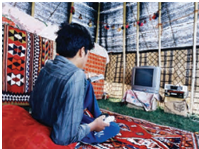
شکل ۲۰-۲ ورود فناوری ارتباطی در زندگی کوچ‌نشینان

با توجه به جدول ۱-۲ می‌توان محلّ گذران تابستان و زمستان کوچ‌نشینان استان را به تفکیک استان و شهرستان مشاهده کرد.