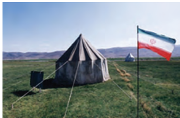
شکل ۱۷-۲ مدرسه کوچ نشینان