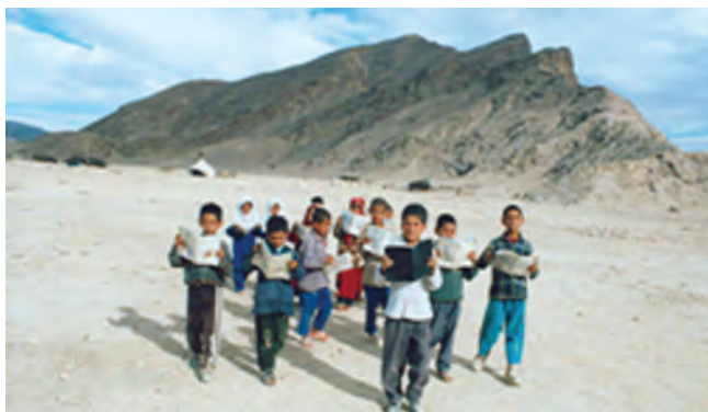
شکل ۱۸-۲ دانش آموزان کوچ نشین