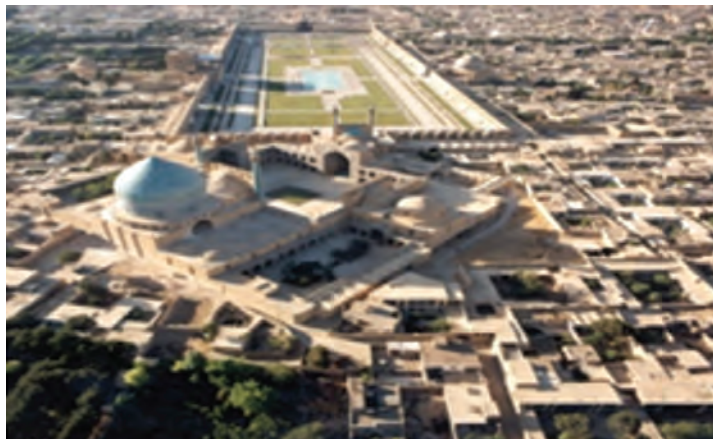
شکل ۲-۳- میدان امام (نقش جهان) - وضعیت کنونی