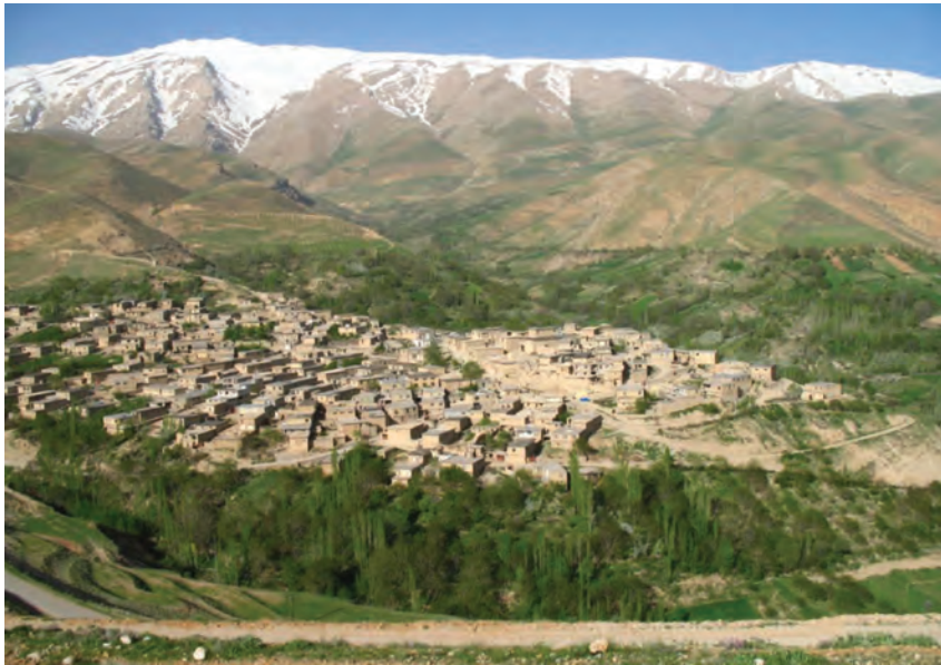
شکل ۱۴-۲- روستای کوهستانی در سمیرم

۲- به نظر شما چه تفاوتی بین شکل و فعالیت‌های اقتصادی روستا در این نواحی وجود دارد؟