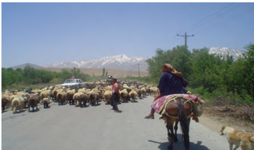
شکل ۱۶-۲- زندگی کوچ‌نشینی در استان اصفهان

کوچ‌نشینان مردمانی هستند که با کمترین هزینه‌های اقتصادی، بیشترین تولید و فایده اقتصادی را برای کشورمان دارند.