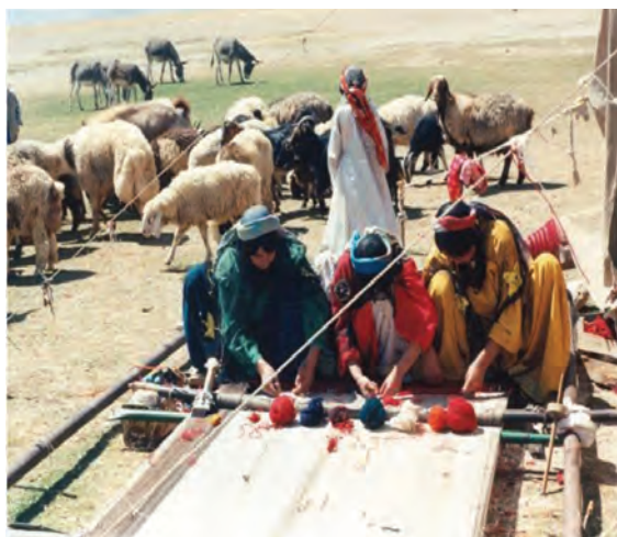
شکل ۲۱-۲ نقش بسیار چشمگیر زنان در زندگی کوچ‌نشینان