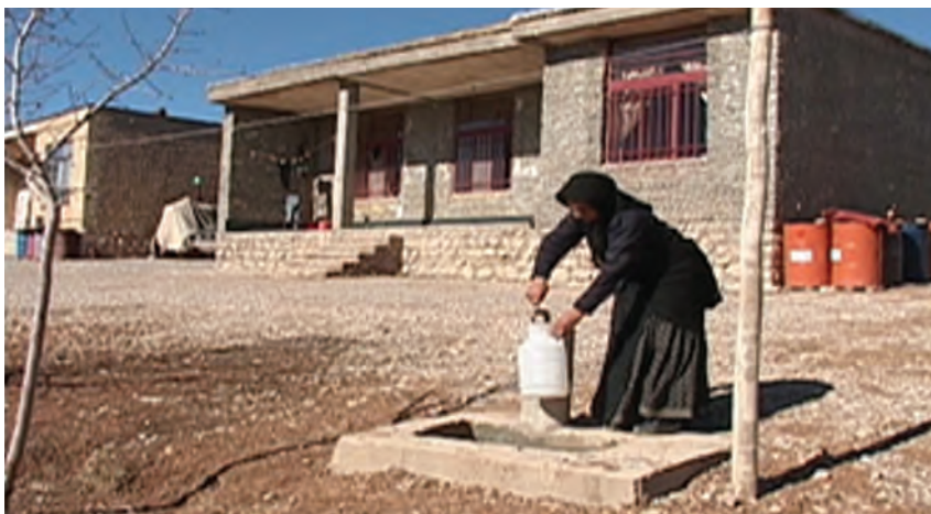
شکل ۱۵-۲- نوسازی روستاها در استان - سمیرم