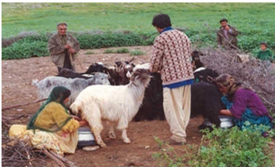
شکل ۱۹-۲ دامداری، مهم ترین فعالیت کوچ نشینان

کوچ نشینان استان اصفهان طبق آمار سال ۱۳۸۷ با جمعیتی بالغ بر ۹۶۰۵ خانوار و ۵۲۹۸۴ نفر از سه ایل قشقایی، بختیاری و عرب جرقویه تشکیل شده اند که با داشتن ۱۲۷۶۰۰۰ رأس دام از ۱/۴ میلیون هکتار مراتع استان بهره برداری می کنند. در دهه های اخیر، از جمعیت کوچ نشین استان کاسته شده و بیشتر آنان در شهرها و روستاهای مجاور مناطق بیلاقی مانند سمیرم، شهرضا، فریدونشهر و فریدن ساکن شده اند و این روند همچنان ادامه دارد. با توجه به مطالعات صورت گرفته، اغلب کوچ نشینان تمایل به یکجانشینی و اسکان دارند؛ زیرا خدمات رسانی به کوچ نشینان اسکان یافته بسیار آسان تر و با هزینه کمتری امکان پذیر است. ورود فناوری های جدید مانند خودرو و وسایل ارتباط جمعی، تغییراتی را در شیوه زندگی و کوچ این مردم ایجاد کرده است؛ برای مثال، آنان ترجیح می دهند برای کوچ به جای طی کردن، راه های بسیار خطرناک و طولانی، از کامیون برای حمل دام و اسباب و اثاثیه خود استفاده کنند.