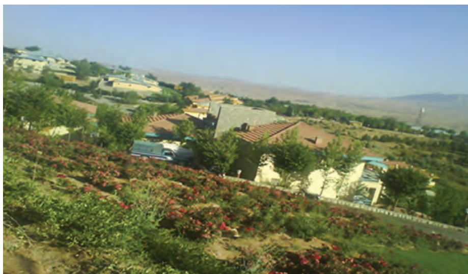
شکل ۴-۲- دهکده تفریحی جادگان

سرد این نواحی همراه با کمبود زمین‌های هموار، طولانی بودن روزهای یخبندان، مشکلات حمل و نقل و ... محدودیت‌هایی برای شهرنشینی و گسترش شهرها در این ناحیه ایجاد کرده است. از سوی دیگر بهره‌گیری از نقش بیابانی و قابلیت‌های استراحتگاهی به ویژه در سال‌های اخیر به عنوان یکی از مناسب‌ترین فعالیت‌ها برای شهرهای کوهستانی محسوب می‌شود؛ مانند ایجاد دهکده تفریحی در جادگان.