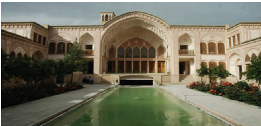
شکل ۹-۲- کاشان شهر خانه‌های بی‌نظیر با کارایی، زیبایی و هندسه شگفت آور

خانه‌ها به عنوان فراوان‌ترین عنصر شهری به گونه‌ای ساخته می‌شدند که بیشترین هماهنگی را با محیط طبیعی و فرهنگی خود دارا باشند. در طراحی آنها، استفاده از پدیده‌های اقلیمی مانند باد، خورشید و ... به خوبی در نظر گرفته می‌شد تا خانه با مصرف حداقل انرژی در تابستان و زمستان، شرایط مناسبی را برای زیستن ساکنانش فراهم آورد. توجه به خلوت (عدم اشراف دیداری و شنیداری نسبت به همسایگان و درون‌گرایی ساختمان)، زیباسازی (استفاده از باغچه، حوض آب، گچ‌بری، شیشه‌های رنگارنگ، آینه کاری و ...)، تفکیک فضای خصوصی، تفکیک فضای زمستانی و تابستانی و اختصاص هر فضا به کاربری خاص، از موارد دیگری بود که در ساخت خانه‌ها به آن توجه می‌شد.