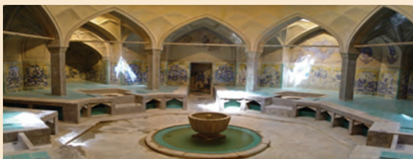
شکل ۲-۸- سربینه حمام علیقلی آقا، هر بخش متعلق به طبقه اجتماعی خاصی بوده است.