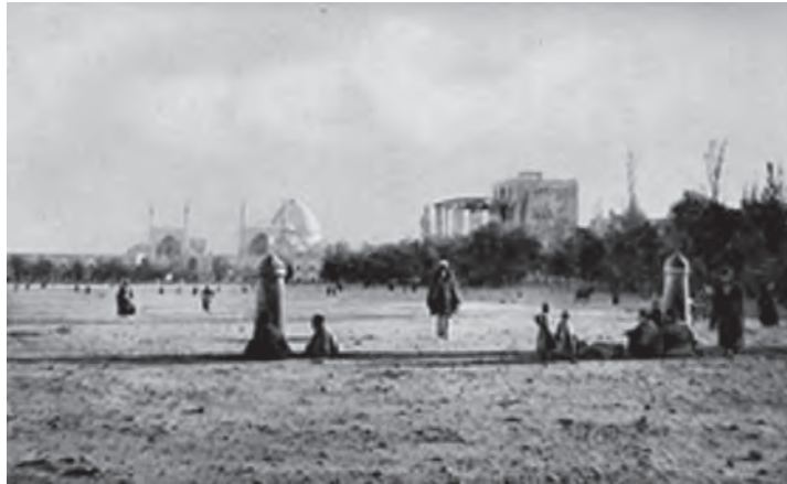
شکل ۲-۲- میدان امام (نقش جهان) در ۱۵۰ سال قبل