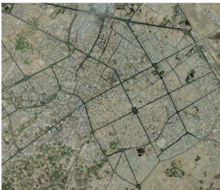
شکل ۱۰-۲. بافت شطرنجی شهرکاشان

در صد سال اخیر، همزمان با ورود وسایل نقلیه موتوری، ایجاد خیابان‌های متقاطع و شطرنجی، افزایش جمعیت و رشد شهرنشینی، مصرف‌گرایی، ورود الگوهای شهرسازی غربی، سیمای شهرهای اصفهان دگرگون شد و در اغلب آن‌ها بافت غربی‌بومی در کنار بافت اصیل و سنتی حالتی دوگانه را به وجود آورد. در این شهرها، منطقه‌بندی جدید موجب کمرنگ‌شدن نقش محله‌ها شد.