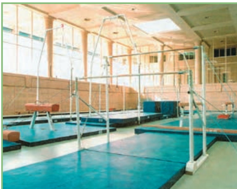
شکل ۲-۸ تجهیزات و وسایل مورد نیاز رشته‌ی ژیمناستیک