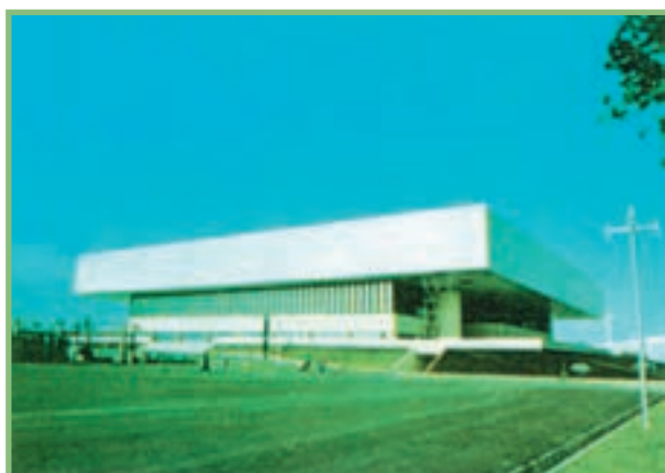
شکل ۲-۲- الف- سالن سربوشیده‌ی شنای مجموعه‌ی ورزشی آزادی با استانداردهای بین‌المللی در رشته‌های شنا، شیرجه و واترپلو.

هم‌چنین، سالن‌های چند منظوره با ابعاد و استانداردهای بین‌المللی برای مسابقات قاره‌ای و جهانی مورد استفاده قرار می‌گیرند (شکل ۲-۲- الف).