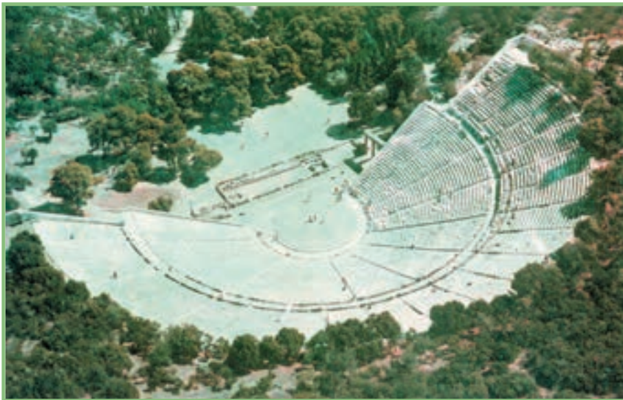
شکل ۱-۲- یکی از آمفی‌تئاترهایی که از دوران باستان به‌جا مانده است.

برنامه‌های تربیت بدنی اسپارتی‌ها در اوایل، در زمین‌های مسطحی به نام «ژیمنازیوم» اجرا می‌شد اما هرچه توجه اسپارتی‌ها به تربیت بدنی و برنامه‌های نظامی افزایش یافت، منابع و امکانات