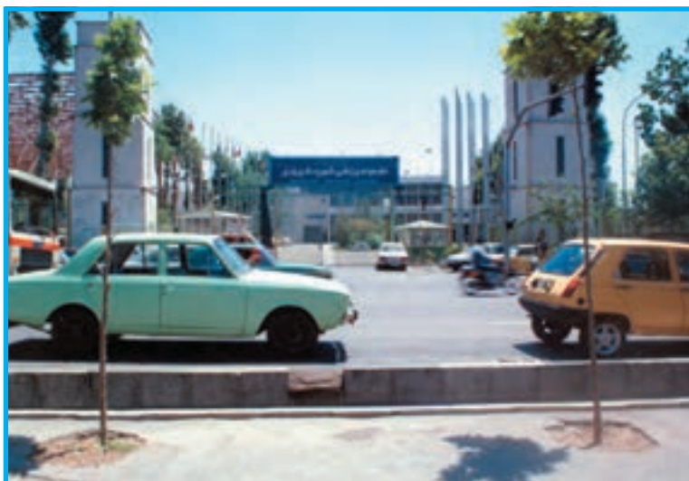
شکل ۴-۱- مجموعه ورزشی شهید شیرودی تهران