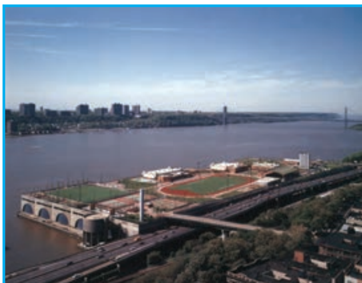
شکل ۱-۲- اماکن طبیعی سرزمینی (کوه‌ها و دریاچه‌ها) و اماکن روباز احداثی (زمین فوتبال) از نمای بالا به خوبی قابل تشخیص هستند.