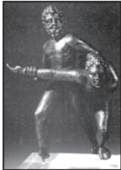
شکل ۱-۱- این تندیس به‌جا مانده از زمان بسیار دور، نشان‌دهنده‌ی نقش ورزش کشتی در فرهنگ آن دوران است.

«مدرسه‌ی نوجوانان» مکان ورزشی دیگری بود که در آتن جدید، برنامه‌ی دوساله‌ای برای تربیت بدنی تدارک دیده بود (شکل ۱-۲).