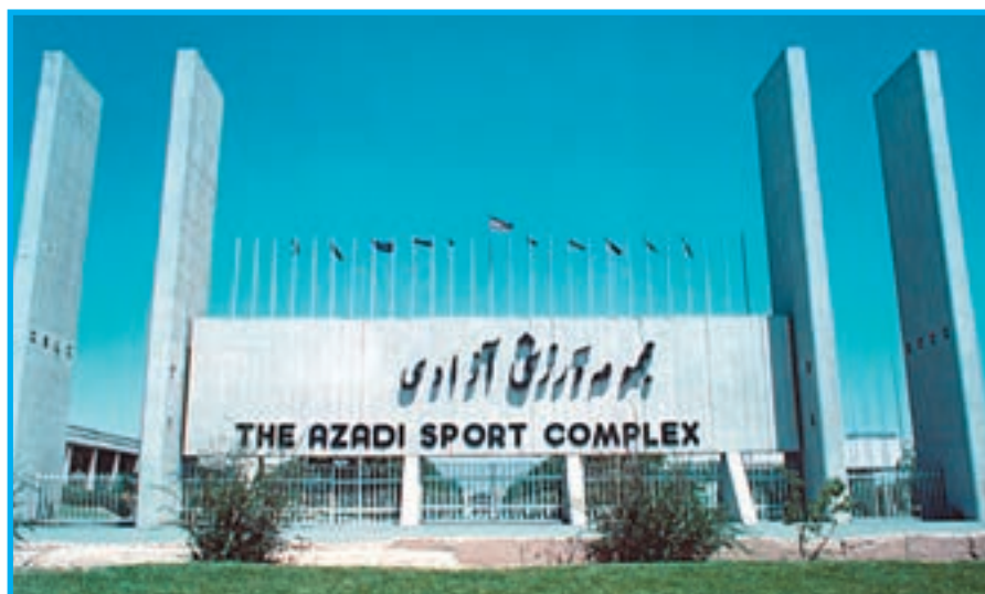
شکل ۵-۱- در ورودی - خروجی غربی مجموعه ورزشی آزادی تهران

مجموعه ورزشی آزادی تهران: این مجموعه که به منظور برگزاری مسابقات آسیایی ۱۳۵۳ ساخته شد، در غرب شهر تهران واقع شده است. عملیات جدی ساختمان های این مجموعه در محدوده دوساله‌ی ۱۳۵۱ تا ۱۳۵۳ اجرا شد. از بخش های مهم این مجموعه می توان استادیوم یکصد هزار نفری