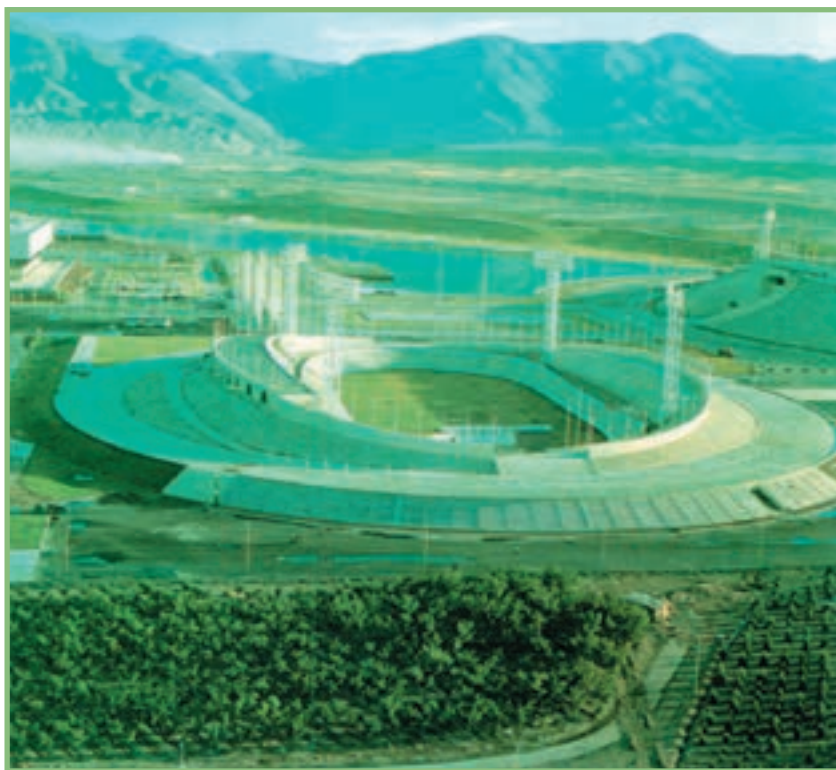
شکل ۲-۲-ب - ولودروم (استادیوم دوچرخه‌سواری) و دریاچه‌ی مصنوعی مجموعه‌ی ورزشی آزادی تهران

استادیوم ورزشی: مکانی ورزشی است که معمولاً از یک میدان بازی (مثل فوتبال، دوچرخه‌سواری و یا دوومیدانی) به‌وجود آمده است (شکل ۲-۲-ب). دورتا دور میدان، جایگاه تماشاچیان به‌صورت پلکانی قرار دارد و زیر جایگاه هم ممکن است مکان‌های سرپوشیده‌ی ورزشی برای بسکتبال، والیبال، اسکواش، نرمش، ژیمناستیک، شنا و غیر آن‌ها ساخته شده باشد. هر استادیوم ممکن است برای ورزش‌هایی نظیر تنیس هم