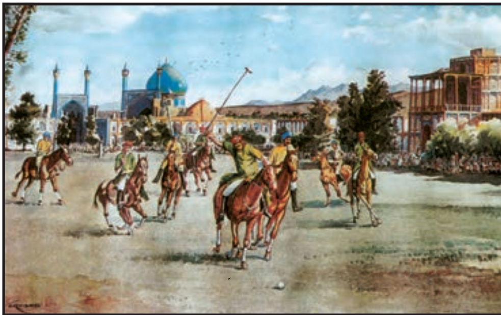
شکل ۳-۱- میدان بزرگ اصفهان (میدان امام) محل بازی چوگان و عالی قاپو، اولین عمارت برای تماشای چوگان.