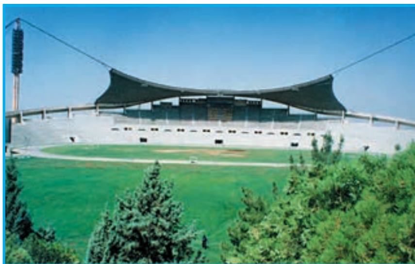
شکل ۱-۶- نمایی از زمین چمن، سکوها و جایگاه مجموعه‌ی ورزشی تختی تهران

مجموعه‌ی ورزشی تختی: این ورزشگاه در دامنه‌ی کوهستان‌های شرق تهران پی‌ریزی شده است. عملیات ساختمان‌های استادیوم، از اوایل سال ۱۳۴۸ آغاز شد. ورزشگاه بزرگ شرق تهران با طرح نعل اسبی، برای اولین بار در ایران پیاده شده است. در ساخت این استادیوم برای اولین بار در خاورمیانه از یک روش فنی خاص استفاده شده است که می‌توان برای برگزاری بازی‌ها و نمایش‌های ملی، از