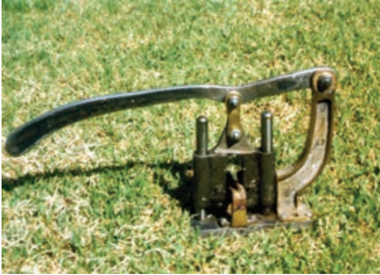
شکل ۱-۷- یک نوع دستگاه پیوندزنی