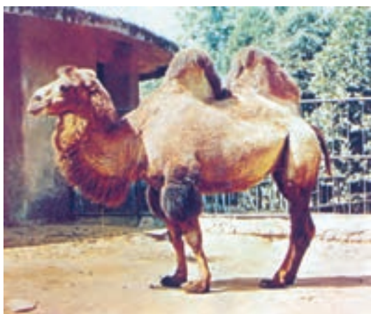
شکل ۶-۴ - شتر دوکوهان