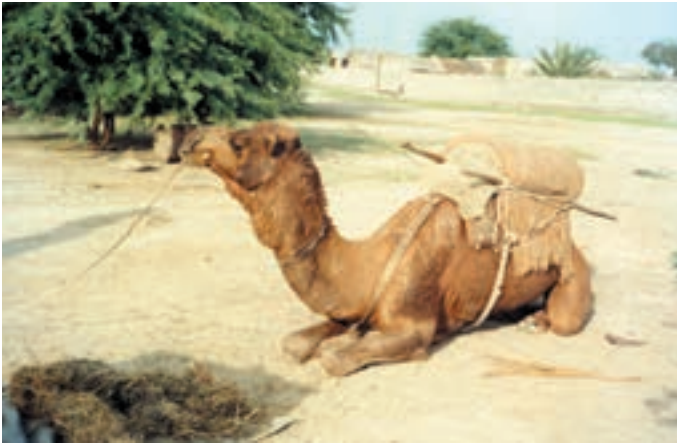
شکل ۱- ۴- حمل بار با شتر

۳- شتر دو کوهانه. ( Camelus Bacterianus )