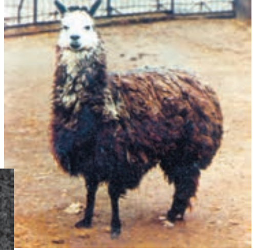
شکل ۲-۴ - شتر بی کوهان (لاما)