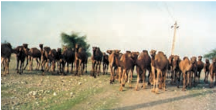
شکل ۷-۴- نگهداری شتر بصورت گله ای

شترهای ضعیف برای خریداری توصیه نمی شوند، زیرا آنها مستعد ابتلا به بعضی از بیماریها می باشند.