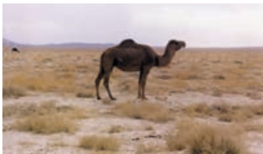
شکل ۵-۴ - شتر یک کوهان

در استان آذربایجان شرقی، به دلیل وجود کیلومترها جاده سنی بین شهرها و راه‌های خاکی بین بخشها و دهات مختلف، ضرورت استفاده از شتر به رنگهای سفید، سیاه و گاهی ابلق دیده می‌شود.