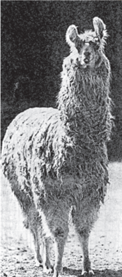
شکل ۳-۴ - شتر لاما