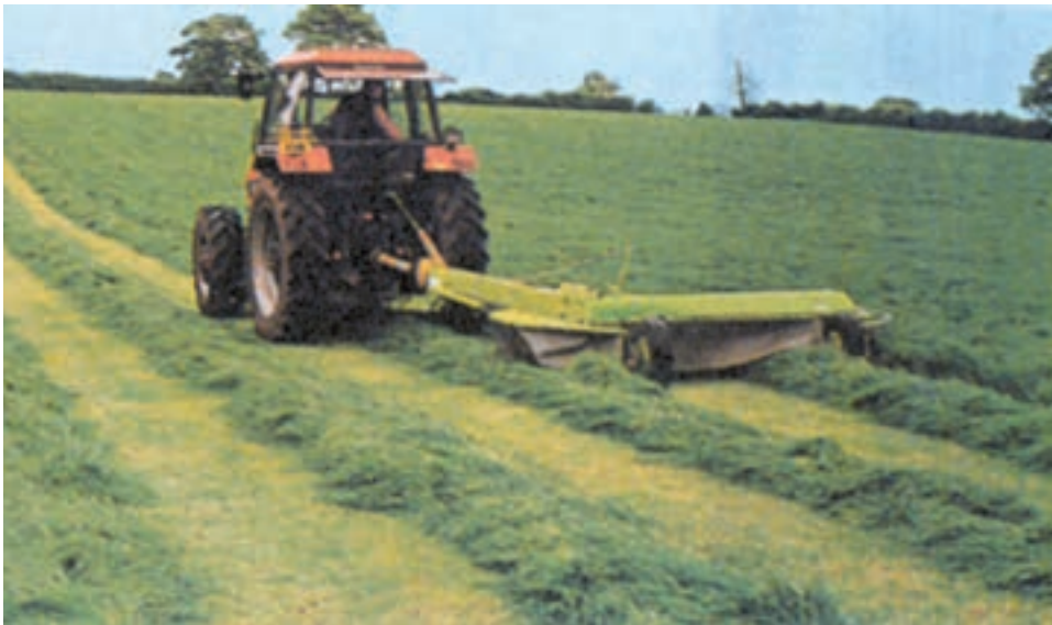
شکل ۸-۱- موور در حال برداشت علوفه

— ماشین علف‌بر (موور) : تنها ساقه را از نزدیک زمین قطع می‌کند و در یک مسیر قرار می‌دهد (شکل ۸-۱).