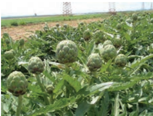
شکل ۹-۲- کنگر فرنگی