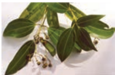
برگ و گل دارچین

گیاهان دارویی، تدخینی، ادویه ای: گیاهانی از تیره های مختلف هستند که به منظور استفاده از برخی مواد و ترکیبات آنها در تهیه دارو، دخانیات یا استفاده از عطر و رنگ و طعم آنها به عنوان ادویه کشت می شوند، مانند: توتون، خشخاش، خردل، زعفران، دارچین، زردچوبه، هل، گاوزبان، سنبل الطیب و غیره (شکل ۷-۲).