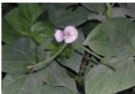
لوبیا چشم بلبلی

حبوبات : گیاهانی از تیره نخود هستند که به منظور تولید دانه کشت می شوند. این نوع گیاهان از نظر پروتئین غنی بوده و به مصرف تغذیه‌ی انسان و دام می‌رسند گونه‌های آن عبارتند از : نخود، لوبیا، ماش، عدس، باقلا، بادام زمینی، سویا، لوبیا چشم بلبلی، نخود فرنگی و... (شکل ۲-۲).