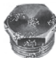
شکل ۸-۶- درپوش

جعبه تقسیم‌های چهارگوش: چون جعبه تقسیم‌های گرد حداکثر چهار راهه هستند، لذا در مسیری که تعداد لوله‌ها بیش‌تر باشد، از جعبه تقسیم چهارگوش استفاده می‌شود. سوراخ‌های این جعبه‌ها دارای رزوه نبوده و برای اتصال لوله به آن‌ها باید از بوشن و بوش برنجی استفاده کرد. شکل ۹-۶ چند نمونه جعبه تقسیم چهارگوش را نشان می‌دهد.