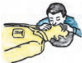
شکل ۱-۳- روش دهان به دهان

ریه‌ی مصدوم خارج شود، بینی را رها کنید و به آرامی به قفسه‌ی سینه‌اش فشار آورید. این عمل را آنقدر تکرار کنید تا مصدوم بتواند نفس بکشد. تناوب دم و بازدم بایستی با تنفس شخص کمک‌دهنده هم زمان باشد (شکل ۱-۳).