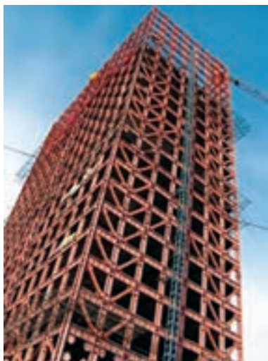
نمونه‌ی سازه‌ای سافتمانی در تهران