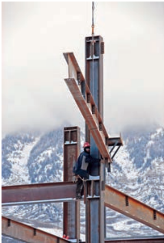
اجرای اسکلت فولادی در ارتفاع

از دیگر مزایای اسکلت فولادی می‌توان به امکان توسعه‌ی سازه، اتصال چند قطعه به یکدیگر توسط جوش یا پیچ، امکان پیش‌ساخته کردن قطعات، سرعت نصب، اشغال فضای کمتر، و قابلیت کاربرد در ارتفاع زیاد اشاره کرد.