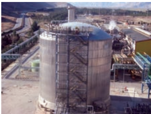
شکل ۲-۷- سازه پوسته ای- مفرز آمونیاک واقع در مجتمع پتروشیمی