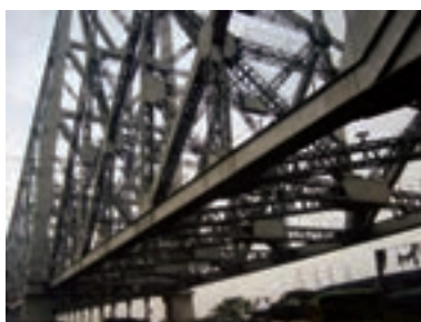
شکل ۲-۶- قسمت‌هایی از پل‌های فولادی