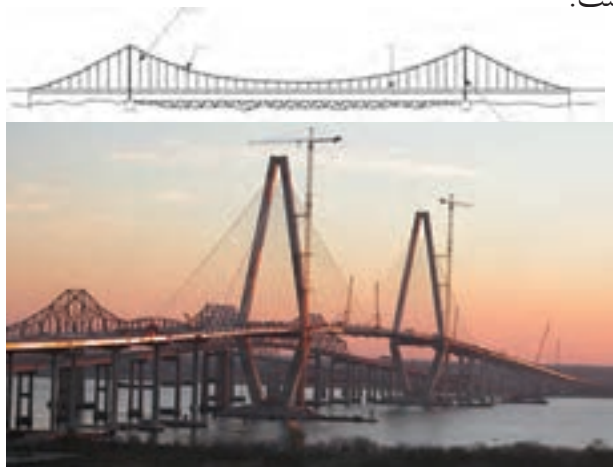
شکل ۲-۸- پل معلق

سازه‌های معلق اغلب در طرح پوشش‌ها (سقف‌ها) و پل‌های با دهانه بلند مورد استفاده قرار می‌گیرند (شکل ۲-۸ و ۲-۹). در چنین سازه‌هایی یک اسکلت قاب‌بندی شده وجود دارد (مثلاً در پل‌سازی، عبورگاه یا عرشه پل و در پوشش‌ها، اسکلت سقف) که توسط آویزهایی از کابل‌های کششی اصلی آویزان است. استفاده از سازه‌های معلق در پل‌سازی بسیار متداول است.