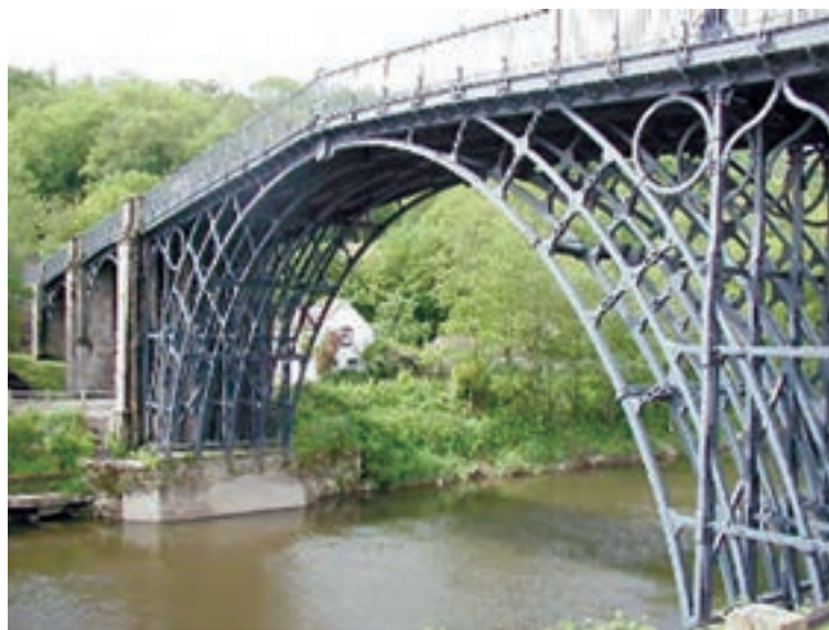
شکل ۲-۲- اولین پل فلزی جهان