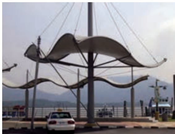
شکل ۲-۹- سازه‌ی معلق