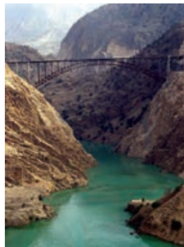
بزرگ‌ترین پل قوسی فولادی در ایران بر روی رودخانه کارون