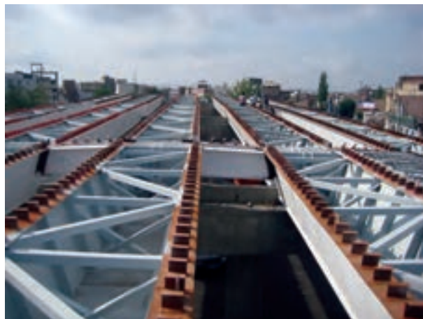
شکل ۲-۶- سازه یک پل در حال سافت