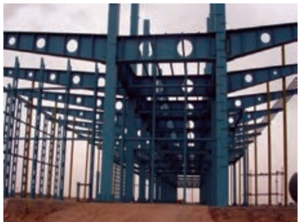
شکل ۲-۵- سازه‌های قابی صنعتی