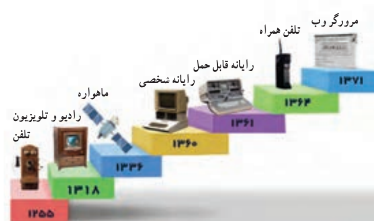
شکل ۲-۲- سیر تحول و تکامل فناوری اطلاعات و ارتباطات

فناوری اطلاعات و ارتباطات در گذر زمان تغییرات گسترده‌ای داشته است. شکل ۲-۲ برخی از تغییرات مهم را نشان می‌دهد.