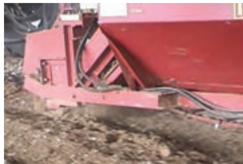
تصویر ۲-۷ جمع‌آوری کود با ماشین‌آلات مکانیکی