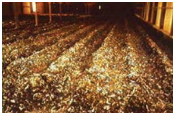
تصویر ۱۰-۷- جمع‌آوری کود در روش گودال عمیق

۳- هرگاه تیغه را بر روی ۵ متر تنظیم نمایید، تیغه از انتهای سالن حرکت می‌کند و تا ۵ متر جلو می‌آید، سپس در نقطه‌ی ۵ متر متوقف می‌شود و به عقب باز می‌گردد و تمام کودهای این فاصله را به داخل کانالی در عرض سالن می‌ریزد.