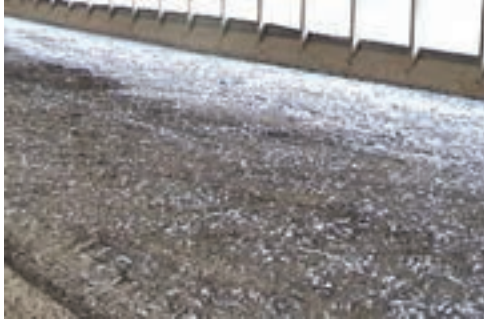
تصویر ۱-۷ کود ناخالص در پایان دوره‌ی پرورش

یکی از مسائل صنعت طیور چگونگی حذف مواد زائد از سالن‌های مرغداری است. کود به علت داشتن عوامل بیماری‌زا، افزایش رطوبت بستر، تولید بوی نامطلوب و نیز ازدیاد حشرات مشکلات زیادی در واحدها ایجاد می‌کند. با توجه به این مسائل جمع‌آوری مناسب کود، به‌ویژه در واحدهای مرغ تخم‌گذار که دوران پرورش طولانی‌تری دارند، اهمیت زیادی دارد.