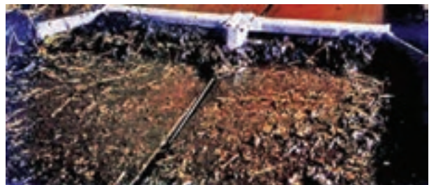
تصویر ۹-۷- تیغه‌ی جمع‌آوری کود