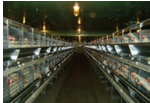
تصویر ۴-۴ - انواع قفس باتری