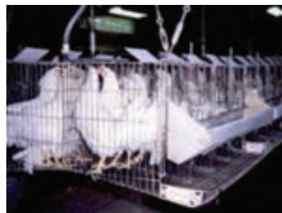
تصویر ۴-۲- قفس مرغ تخم‌گذار