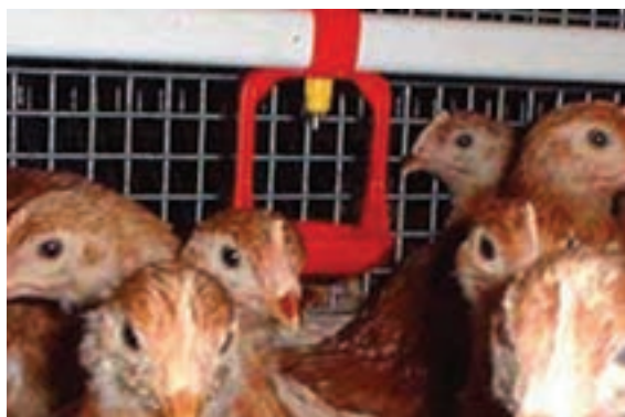
تصویر ۱۰-۴- انواع آب خوری چکه ای