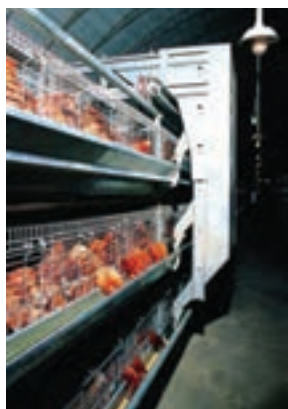
تصویر ۹-۴- دان خوری خودکار

آب خوری های چکه ای و فنجانای می توانند به نحوی نصب شوند که مرغ های دو قفس مجاور از آن استفاده کنند. آب خوری چکه ای مرسوم ترین نوع آب خوری در سیستم قفس است. میزان هدر رفتن آب در این سیستم به حداقل می رسد. به ازای هر ۶ تا ۸ قطعه مرغ تخم گذار باید یک عدد آب خوری چکه ای و به ازای هر ۱۰ تا ۱۲ قطعه مرغ تخم گذار یک عدد آب خوری فنجانای در نظر بگیرید ۴ (تصاویر ۹-۴ و ۱۰-۴).