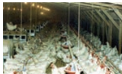
تصویر ۱۱-۴- انواع لانه تخم گذاری