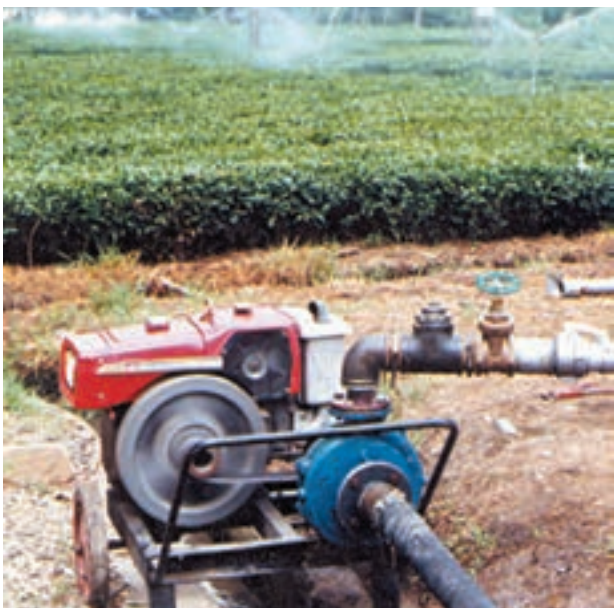
شکل ۴-۶- آبیاری بارانی با سیستم ثابت