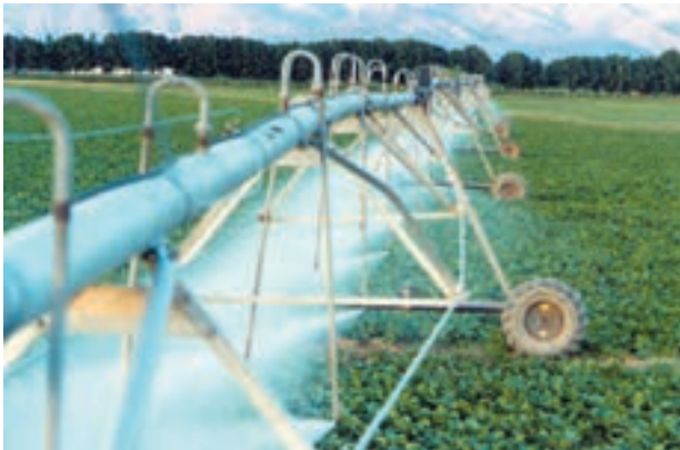
شکل ۸-۶- آبیاری بارانی خطی

۶-۴-۶ آبیاری بارانی با سیستم خطی (لینیر): این سیستم مانند سیستم دوار مرکزی عمل می کند با این تفاوت که به جای حرکت دایره ای، بال حرکت مستقیم است و زمین را به صورت چهارگوش آبیاری می کند (شکل ۸-۶).