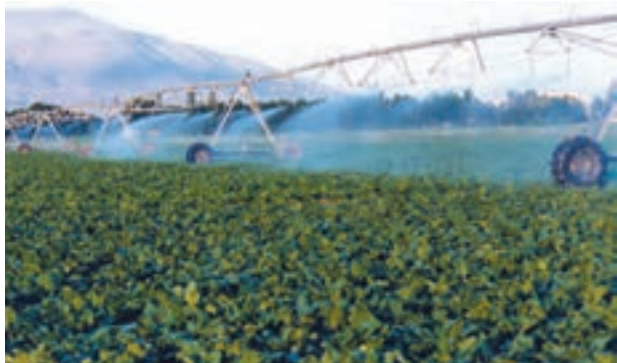
شکل ۶-۶- آبیاری بارانی قرقره‌ای