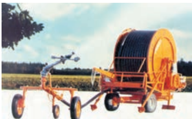
شکل ۷-۶- آبیاری بارانی دوار مرکزی (سنترپیوت)