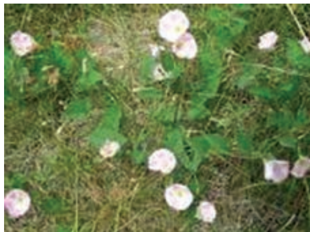
ج- پیچک صحرائی