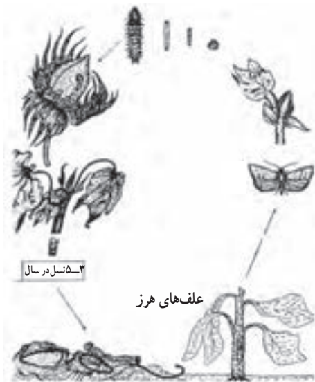
شکل ۱۶-۳- چرخه زندگی کرم خاردار پنبه. کرم خاردار پنبه قسمتی از زندگی خود را روی علف های هرز می گذراند.

پنبه نمونه هایی از این گروه اند (شکل ۱۶-۳).