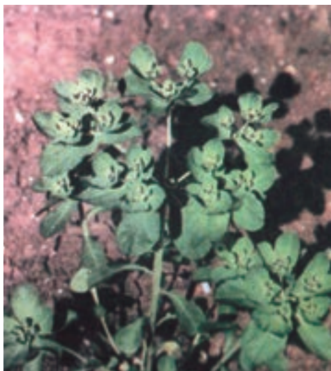
ب - فرفیون