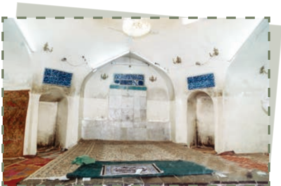
خانه امام علی علیه السلام در کوفه

نیرنگ بر نیزه کردن قرآن‌ها اثر خود را بخشید و گروه مقدس‌مآب نادان از سپاه امام علیه السلام را فریفت. بنا بر آن شد که از هر طرف یک حکم (داور) انتخاب شود و تا زمان حکمیت ۱ ، میان دو سپاه آتش بس برقرار باشد.