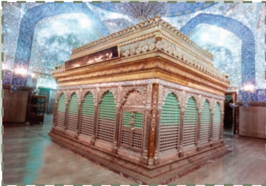
مرقد مطهر امیر مؤمنان علی علیه السلام