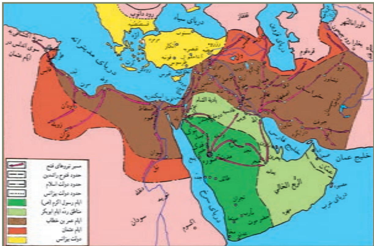
دولت اسلام در عصر پیامبر خدا ﷺ و فتوحات عصر راشدین

شدند؛ مشروط بر آنکه شخص خلیفه خود به این شهر بیاید و پیمان صلح را امضا کند. عُمر نیز پس از مشورت با اصحاب رسول خدا ﷺ و با تشویق امیر مؤمنان علی المرتضیٰ در سال شانزدهم یا هفدهم هجری به بیت‌المقدس رفت و تعهدات متقابلی میان مسلمانان و مسیحیان امضا شد. مسلمانان تعهد کردند افزون بر تأمین مالی و جانی مردم مسیحی، کلیسایی را تخریب نکنند؛ یهودیان را در بیت‌المقدس ساکن نکنند؛ صلیبی شکسته نشود و اجباری در دینداری نباشد. مسیحیان نیز متعهد شدند مالیاتی همچون مردم مدائن بپردازند؛ در مهاجرت از بیت‌المقدس یا سکونت در آن شهر مختار باشند و با رومیان همکاری نکنند.