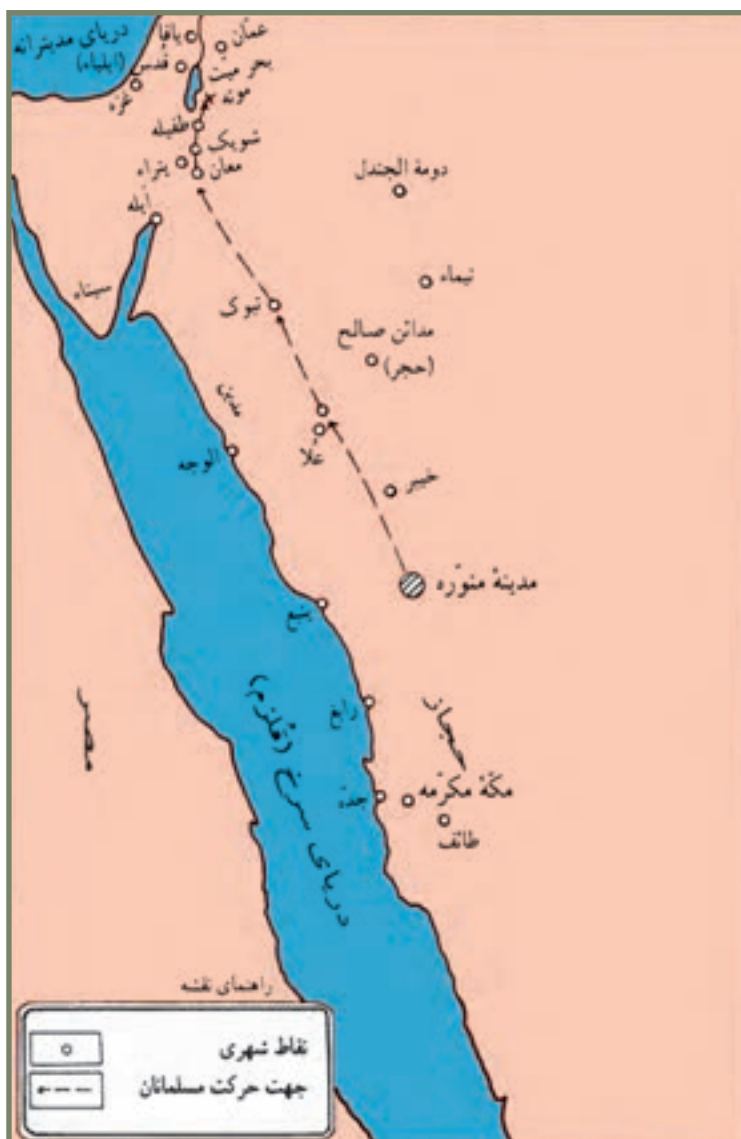
غزوه موته (جیش الامراء)

رسول خدا ﷺ در ادامه تلاش برای گسترش دعوت اسلامی به نقاط مختلف جهان آن روز، در سال هشتم هجری، نامه‌ای را برای حاکم «بُصرا» ۱ در شام ارسال کرد اما او ناجوانمردانه، سفیر پیامبر ﷺ را در دهکده موته به قتل رساند. از آنجا که این رفتار، نوعی