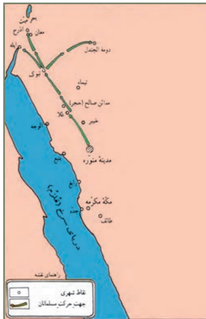
غزوه تبوک، مأخذ: اطلس تاریخ اسلام، صادق آئینه‌وند

اصلی فرمان رسول خدا (صلی الله علیه و آله) برای بسیج قوا و حرکت به سوی تبوک، گزارش‌هایی دال بر آمادگی امپراتوری روم برای حمله به حکومت نوپای مدینه بوده است. رسول خدا (صلی الله علیه و آله) در غیاب خود، علی (علیه السلام) را به عنوان جانشین، در مدینه منصوب کرد و فرمود: «کار مدینه جز با من یا با تو، سامان نمی‌یابد.» دلیل این کار نیز تحرکات مرموز منافقان در مدینه بود. آن حضرت، همچنین در پاسخ شایعات منافقان، مبنی بر عدم صلاحیت علی (علیه السلام)