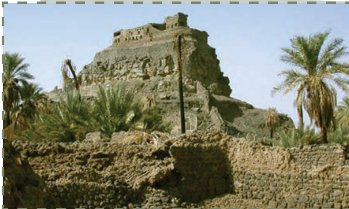
بقایای قلعه خیبر

در سال هفتم هجری رسول خدا صلی الله علیه و آله ناچار شد به همراه ۱۴۰۰ مسلمان به سوی قلعه‌های خیبر ۱ حرکت کند؛ زیرا فتنه‌گران یهودی، پس از خیانت‌ورزی و اخراج از مدینه، در خیبر سکونت کرده، آنجا را به کانون جدید توطئه بر ضد مدینه تبدیل کرده بودند. با ورود سپاه اسلام