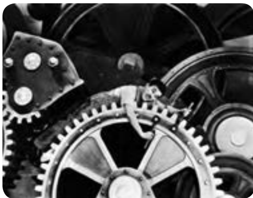
● صحنه‌ای از فیلم عصر جدید چارلی چاپلین

پنجم: زوال عقلانیت ذاتی ؛ منظور از عقلانیت ذاتی، سطحی از عقلانیت است که درباره ارزش‌ها، آرمان‌ها و اهداف زندگی به تأمل می‌پردازد. در جهان متجدد، متافیزیک و علمی که داوری‌های ارزشی می‌کنند از بین می‌روند.