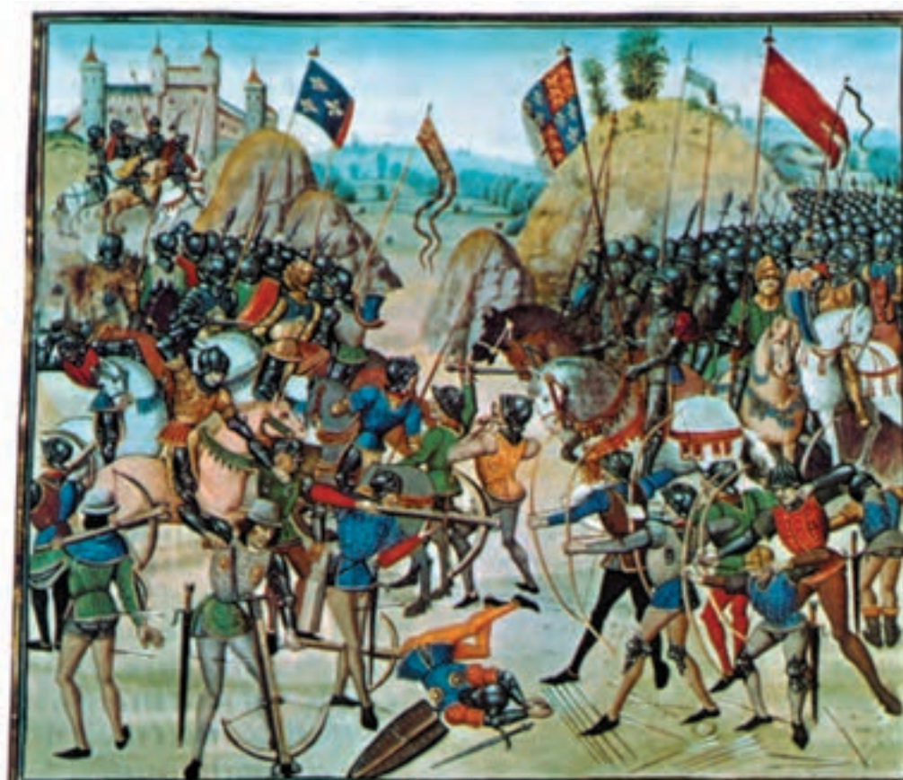
صحنه‌ای از جنگ‌های صدساله بین انگلیس (سمت راست) و فرانسه (سمت چپ)

می‌کردند. در روسیه نیز فئودال‌ها قدرت بسیار داشتند. سلطه مغولان بر روسیه که نزدیک به یکصد و پنجاه سال طول کشید نیز آنان را ضعیف نکرد. تا اینکه با به قدرت رسیدن ایوان چهارم ۱ اشراف سرکوب شدند و هرچند از بین نرفتند، اما حکومت مرکزی قدرتمند و وسیعی در روسیه شکل گرفت. ایوان چهارم (۱۵۳۳-۱۵۸۴) از مشهورترین پادشاهان روسیه است که به سبب خشونت‌هایش به ایوان مخوف مشهور است. او یک بار در حال عصبانیت پسر خود را کشت! توسعه مذهب ارتدوکس نیز به تقویت وحدت معنوی روس‌ها کمک می‌کرد.