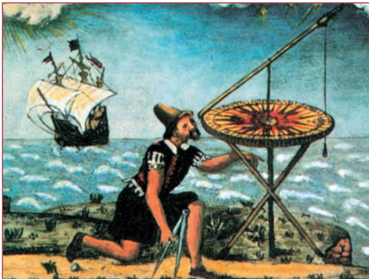
دریانوردان عصر رنسانس با استفاده از ستارگان به تعیین موقعیت خود می برداختند.

این زایش دوباره فکری و فرهنگی در اروپا که رنسانس نامیده شده است کم کم به عصر دنیای کهن در اروپا پایان داد و عصر جدیدی را آغاز کرد. نتایج مثبت و منفی این تحولات در چند قرن اخیر توسط