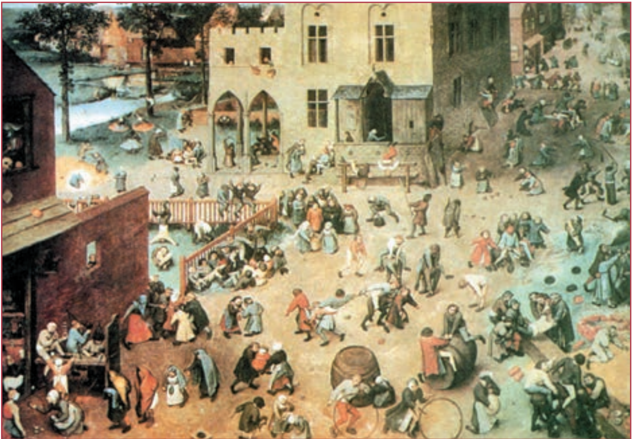
نمونه‌هایی از بازی‌های دوره رنسانس

رشد شهرها در ابتدا بیشتر در نواحی ساحلی بود؛ زیرا در آنجاها کشاورزان و حکمرانان فتودال کمتر حضور داشتند. رشد شهرهای بندری شمال ایتالیا و سپس شمال آلمان زودتر از شهرهای دیگر آغاز شد، اما دیگر شهرها نیز با رشته‌ای از فعالیت‌های تجاری مرتبط با هم به وجود آمدند و رشد کردند. به ساکنان شهرها بورژوا می‌گفتند که به معنای شهرنشین است. شهر، به خصوص محل داد و ستد بود و چون لازمه داد و ستد هم، پول است، استفاده از پول گسترش یافت.