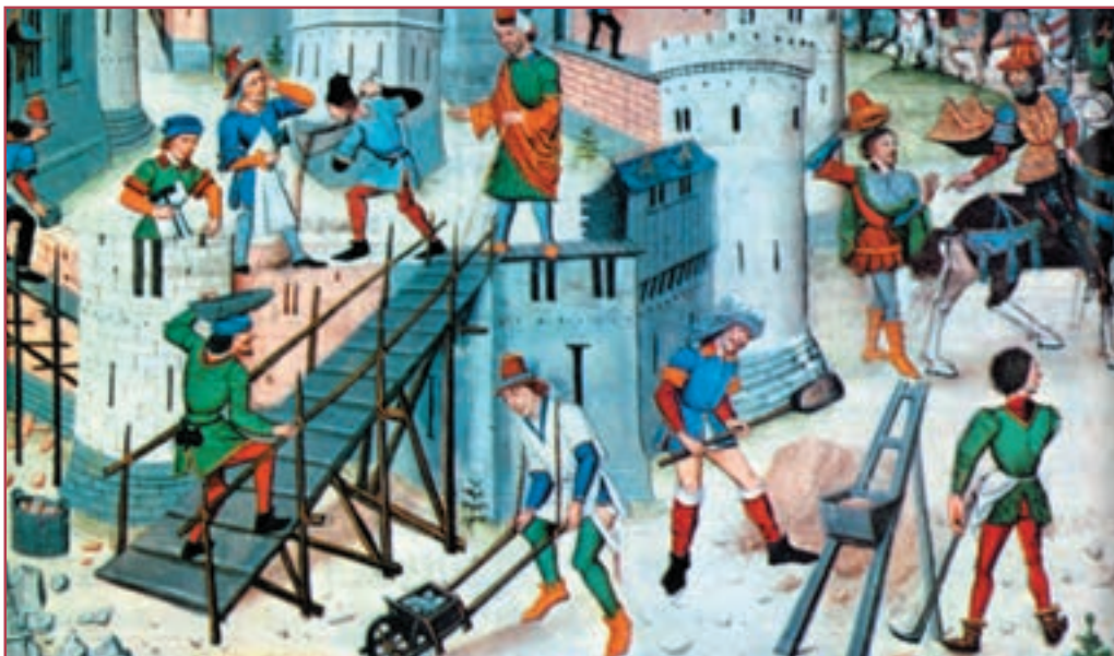
انواع فعالیت‌های عمرانی و اقتصادی در شهرهای اروپا در اواخر قرون وسطا

هاروی ۲ چگونگی گردش خون را کشف کرد. استفاده از علوم تجربی در رشته‌های دیگر نیز مورد توجه قرار گرفت. در ریاضیات، نجوم و جغرافیا هم اندیشه‌های نوینی مطرح شد. کپرنیک ۳ کروی بودن زمین را و پس از او گالیله ۴ گردش زمین به دور خورشید را اثبات کردند.