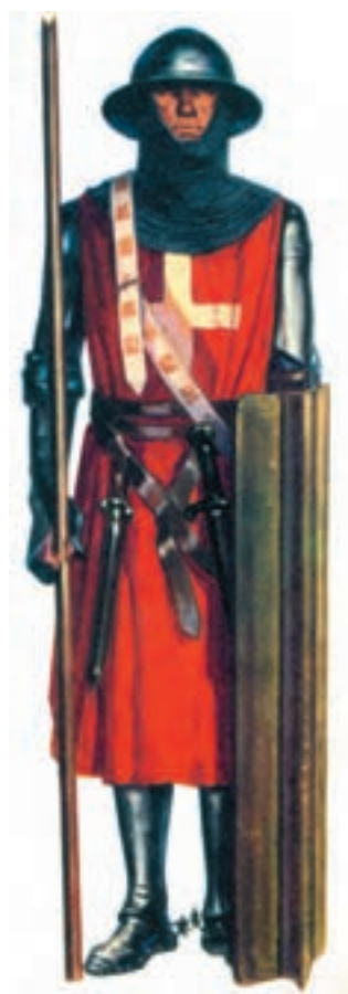
یک جنگجوی صلیبی