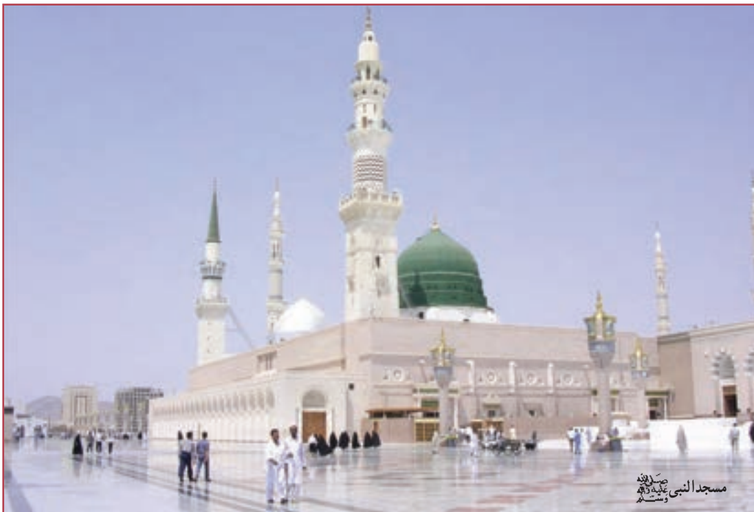
مسجد النبی صلی الله علیه و آله و سلم

نخستین اقدام پیامبر صلی الله علیه و آله و سلم در بدو ورود به مدینه دستور ساخت مسجد بود. مسجد در اجتماع نبوی فقط محل عبادت، عرضه و ابلاغ آیات الهی نبود؛ بلکه اصلی‌ترین مرکز مدیریت و اعمال حاکمیت پیامبر صلی الله علیه و آله و سلم بر جامعه تلقی می‌شد.