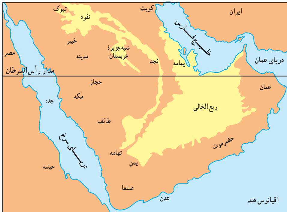
شبه جزیره عربستان

با یکدیگر بر سر مسائل کوچک و بزرگ در جنگ و کشمکش به سر می بردند. جنگ‌هایی که گاه سال‌ها به طول می انجامید و جز گسترش کینه و تشدید خشونت و بی‌رحمی، نتیجه دیگری نداشت. ریش سپیدان قبیله از میان خود فردی را که به شجاعت، سخاوت و تدبیر شناخته شده بود به ریاست قبیله برمی‌گزیدند. رئیس یا شیخ قبیله که مورد احترام همه افراد قبیله بود، ضمن برخورداری از امتیازاتی ویژه، با هرگونه خطا و سرپیچی افراد از مقررات و سنت‌های قبیله برخورد می‌کرد.