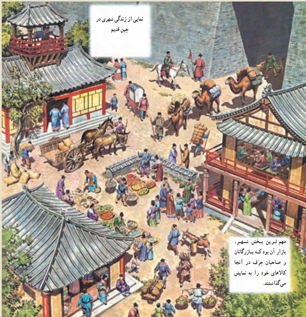
نمایی از زندگی شهری در چین قدیم

مهم ترین بخش شهر، بازار آن بود که بازرگانان و صاحبان جَرَف در آنجا کالاهای خود را به نمایش می گذاشتند.