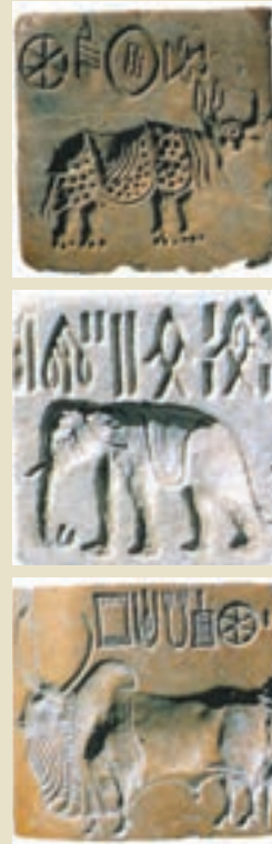
آثار به جا مانده از موهنجودارو (تصویر سمت راست) در تصویر سمت راست تعدادی از مهرهای کشف شده در آنجا نیز دیده می‌شود.