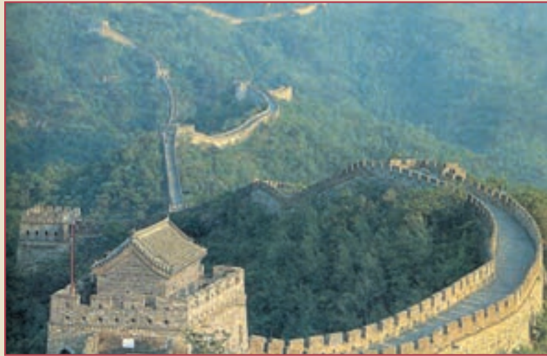
دیوار بزرگ چین یکی از آثار تاریخی مشهور جهان به شمار می‌رود.

در سال ۲۴۶ ق.م در خاندان چه این، پسری سیزده ساله که به شی هوانگ تی شهرت داشت، به سلطنت رسید. شی هوانگ تی نوع نظامی زیادی داشت، به همین دلیل، طی چند پیروزی در جنگ توانست حکومت‌های کوچک را یکی پس از دیگری از میان بردارد و برخاک گسترده چین مسلط شود. او خود را نخستین امپراتور