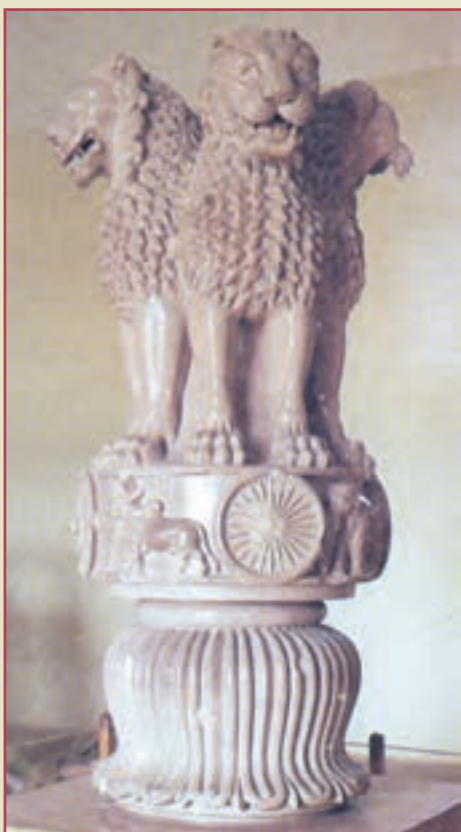
مجسمه شیرها مربوط به دوره حکومت آشوکا

هنر و معماری: قدیمی‌ترین جلوه‌های هنر و معماری