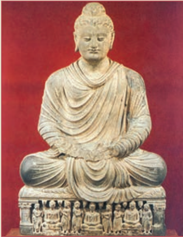
مجسمه بودا. در سرزمین‌های بودایی نشین تعداد نسبتاً زیادی از این‌گونه مجسمه‌ها وجود دارد.

طریق به آنچه می‌خواهد نرسیده است. بنابراین، شیوه‌های رایج ریاضت را که اساس آن عبارت از انزوا و روزه‌های طاقت‌فرسا بود، ترک کرد. سرانجام، روزی در زیر یک درخت احساس کرد به آرامش رسیده و راه درست زندگی را دریافته است. از آن پس، سیدارتا که به بودا (نجات یافته، روشن شده) معروف شده بود، پیروانی یافت و به تبلیغ اندیشه‌های خود پرداخت. بودا با قربانی کردن حیوانات، تناسخ و ... مخالف بود؛ به همین دلیل، برهمنان با او دشمن شدند و با عقایدش به مخالفت پرداختند.