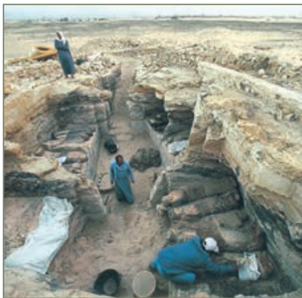
بخش بسیاری از آگاهی‌های تاریخی - به ویژه دربارهٔ گذشته‌های دور - از طریق حفاری‌های باستان‌شناسی به دست آمده است.

قدیمی و طبقه‌بندی آنها و پژوهش دربارهٔ آنها می‌پردازد و با حفاری و کشف آثار مربوط به انسان‌های پیشین، نظیر خرابه‌های مسکونی، ظرف‌ها، سکه‌ها، لوحه‌ها، مجسمه‌ها و... از دل زمین و یا بررسی آثار باقی‌مانده مانند تخت جمشید، طاق‌بستان، مسجد جامع اصفهان و صدها اثر دیگر، گزارش‌هایی دربارهٔ آنها تهیه می‌کند. باستان‌شناسان تاکنون موفق شده‌اند نکات بسیاری دربارهٔ زندگی انسان در روی زمین و تمدن‌های بسیار قدیمی کشف و شناسایی کنند. علاوه بر این، در گذشته در دربار شاهان، وقایع نگارانی بوده‌اند که وظیفه‌شان ثبت وقایع و اخبار بوده است. آنها ماجراهای مربوط به جنگ، ازدواج، شکار، میهمانی، ساختن بناها و... را می‌نوشتند.