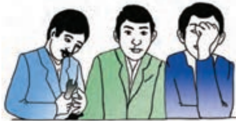
بشنو و فراموش کن ..... ببین و به خاطر بسپار ..... عمل کن و بفهم

گاهی اوقات یادگیری فقط از طریق دیدن رفتار سایرین شکل می‌گیرد.