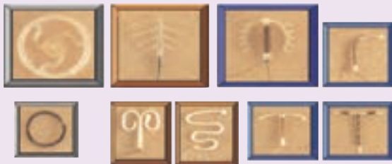
انواع آی - یو - دی