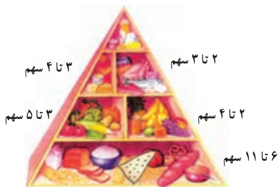
هرم غذایی نوجوان

نمونه‌ی رژیم غذایی برای افراد در دوره‌ی بلوغ