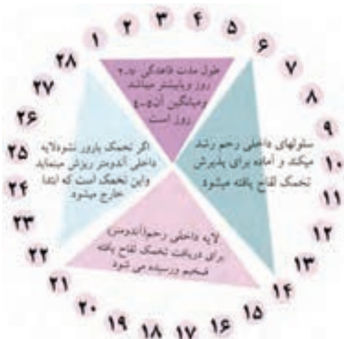
چرخه تغییرات در یک دوره قاعدگی

قاعدگی با افزایش بیش‌تر هورمون‌ها دیواره‌ی داخلی رحم ضخیم‌تر می‌شود. چنانچه در این زمان لقاح صورت بگیرد، تخمک آزاد شده از تخمدان، بارور شده و در دیواره جایگزین می‌شود اما اگر تخمک بارور نشود، مجدداً میزان هورمون‌ها کاهش می‌یابد و به تدریج دیواره‌ی داخلی رحم نازک می‌شود تا این‌که با نزدیک شدن به زمان خونریزی قاعدگی دوباره ریزش می‌کند و خونریزی بعدی اتفاق می‌افتد.