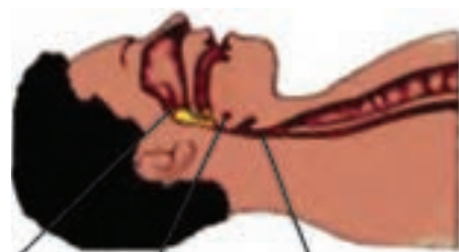
مسیر عبور هوا باریک شده است زبان به عقب افتاده استفراغ در عقب گلو

ممکن است راه تنفس مصدوم به خصوص اگر بی‌هوش باشد بر اثر عواملی مانند تنگ شدن مسیر عبور هوا (در اثر تنگ بودن یقه لباس) افتادن زبان به عقب دهان یا وجود مواد و یا استفراغ در عقب گلو تنگ یا بسته شده باشد.