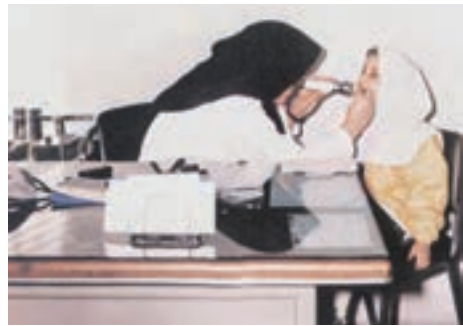
۳- سطح سوم: این سطح از پیشگیری زمانی مطرح از عینک و ... است.

بیماری یعنی تب رماتیسمی در شخص مبتلا می‌شود.