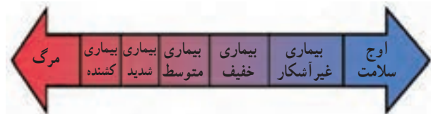
شکل طیف سلامت و بیماری

سلامت و بیماری دارای درجات مختلفی است. عده‌ای از مردم در ظاهر هیچ‌گونه ناراحتی یا علامتی از بیماری ندارند اما با انجام آزمایش و معاینه دقیق مشخص می‌شود که آن‌ها بیمارند. این‌گونه بیماری‌ها را بیماری‌های بدون علامت می‌نامند. در اغلب بیماری‌ها نشانه‌هایی هست که سبب تشخیص آن بیماری‌ها می‌شود، بیماری شدید شکل دیگر بیماری است که ممکن است به معلولیت و حتی مرگ منتهی شود. بنابراین طیف سلامت و بیماری از نقطه اوج سلامت شروع و به مرگ منتهی می‌شود.