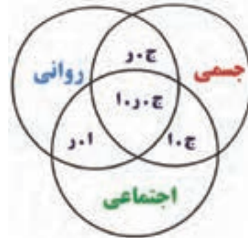
ارتباط ابعاد جسمی، روانی، اجتماعی در انسان

اغلب مردم برای تعیین سلامت افراد، به ظاهر فیزیکی آن‌ها توجه می‌کنند و اگر در ظاهر آن‌ها نشانه‌ای از درد و علائمی از بیماری جسمی مشاهده نشود او را شخصی سالم می‌دانند. براساس تعریفی که در اساس نامهٔ سازمان جهانی بهداشت ۱ آمده است، سلامت عبارت است از رفاه کامل جسمی، روانی و اجتماعی و نه فقط نبودن بیماری و معلولیت