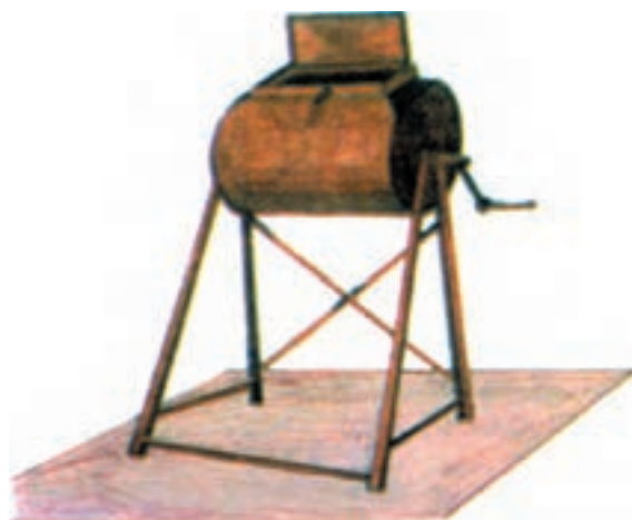
شکل ۴-۱۱ بشکه ضد عفونی بذور

زمان مناسب کاشت پنبه برحسب نوع خاک، شرایط اقلیمی، نوع رقم و نظام آیش بندی و تناوب زراعی متفاوت است. جوانه زنی و رویش سریع پنبه در زراعت آبی، موقعی است که دمای خاک در حالت گاورو در عمق ۲۰ سانتیمتری به مدت حداقل ۳-۵ روز متوالی ۱۸ C ثابت باشد. اما در زراعت دیم، رطوبت خاک و نظام بارندگی منطقه نیز عامل تعیین کننده ای است. به عبارت دیگر، با رعایت سایر شرایط کاشت، زمانی که معدل درجه حرارت روزانه منطقه به حداقل ۱۵-۱۴ درجه