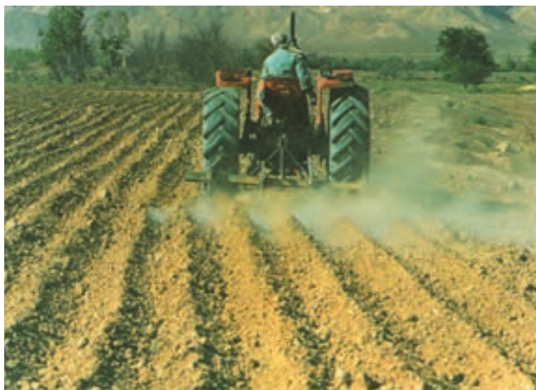
شکل ۱۷-۴- ایجاد شیار یکنواخت و دقیق، در توزیع مناسب آب بسیار مؤثر خواهد بود.

هر چند مطلوب آن است که عمل کاشت با ماشینهای ردیف‌کار دقیق صورت گیرد، اما در برخی مناطق و شرایط، از جمله کمبود