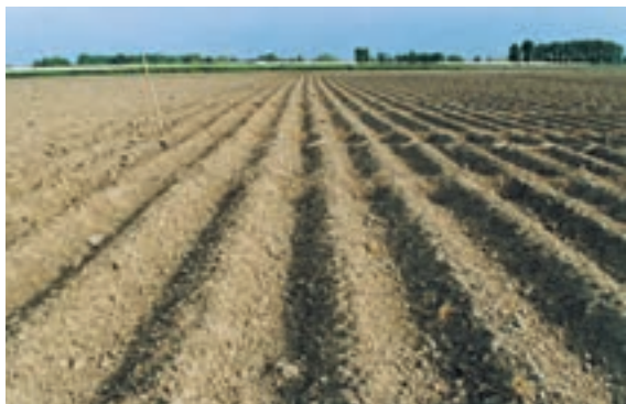
شکل ۱۲-۴ - پس از بذریابی و زیرخاک کردن آنها اقدام به ایجاد شیارهای آبیاری مزرعه می‌نمایند.

که سطح پشته‌ها از هر طرف حداقل تا فاصله ۲۰ سانتیمتری از لبه جوی به خوبی نم بکشد. پس از گاورو شدن زمین، بذور را که معمولاً خیس‌انده شده‌اند، به تعداد ۵-۳ عدد در گوده‌ای به عمق مناسب در سطح پشته به فاصله ۱۰-۷ سانتیمتر از لبه جوی و ۳۰-۲۰ سانتیمتر از گوده قبلی با دست می‌کارند.