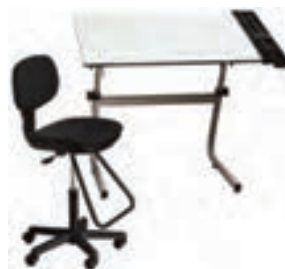
۲. میز و صندلی نقشه کشی