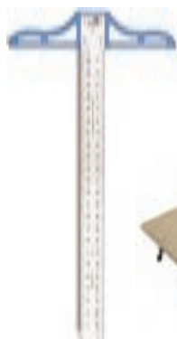
۵. خط کش تی