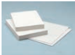
۳. کاغذ A۳ و A۴