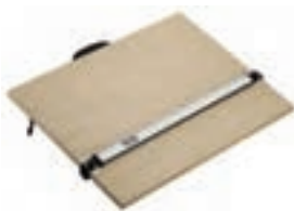
۴. تخته رسم