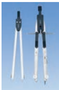
۱۱. پرگار معمولی و پرگار انتقال اندازه