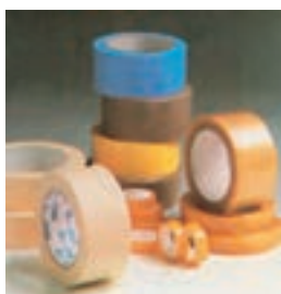
۱۲. نوار چسب