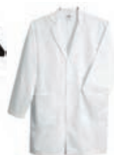
۱. روپوش سفید