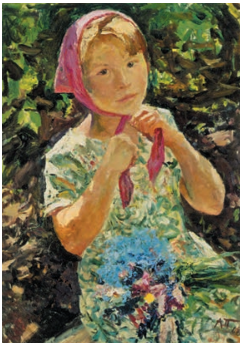
تصویر ۲۰-۳ — اثر آرکادی پلاستف، رنگ روغن روی بوم، (۷۰×۵۰ سانتی‌متر)

طراحی از او و نشانه‌هایی از فضای اطراف او، نظیر درختها و گلها و ... که حضور رنگهای سرد و گرم در آن دیده شود تهیه کنید. در این مرحله، می‌توانید از رنگهای گرم و سرد و ترکیبات آن استفاده کنید دقت کنید که وارد جزئیات نشوید و کلیت موضوع را در نظر بگیرید. بازتاب رنگهای طبیعت در پیکره و پوست و لباس و موهای مدل شما دیده خواهد شد. به تصویر (۲۰-۳) اثر آرکادی پلاستف ۱ نگاه کنید. پیکره در میان درختها نشسته است و روسری خود را محکم می‌کند. به خاطر نور شدید روز و بازتاب رنگ روسری، مجموعه‌ای از رنگ گرم مایل به قرمز را در چهره او مشاهده می‌کنیم. ولی در جای جای چهره و دستها بازتاب رنگ سبز لباس و برگهای اطراف را می‌بینیم. نقاش، به درستی از مجموعه رنگهای موجود بهره گرفته است تا در اثرش تعادل و هماهنگی رنگی ایجاد نماید.