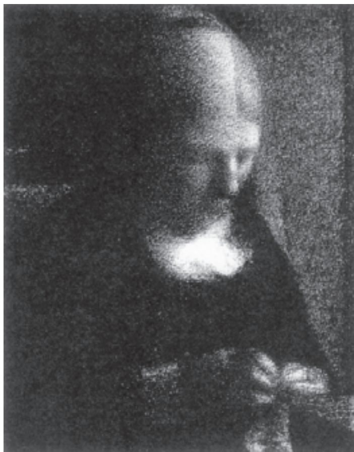
تصویر ۲-۳- اثر ژرژ سورا، زغال روی کاغذ، (۳۱×۲۴ سانتی متر)