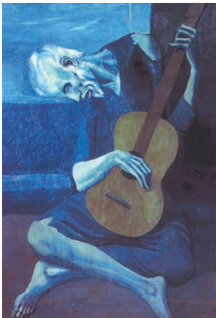
تصویر ۱۸–۳ – اثر پابلو پیکاسو، رنگ روغن روی بوم، (۱۲۱×۸۲/۵ سانتی‌متر)

تصویر (۱۸–۳)، به شما در انتخاب طرح و رنگ کمک می‌کند. این نقاشی، اثر پابلو پیکاسو ۱ نقاش کوبیست ۲ است و «گیتارزن پیر» نام دارد. او با خطوط منحنی و شکسته، پیکری را به‌طور فشرده در کادر قرار داده و برای آن، رنگهای سرد – آبی سبز بنفش را انتخاب کرده است. او توانسته است گیتار زن پیر را بسیار نحیف و فقیر و افسرده در فضای سرد و دل‌تنگ قرار دهد و فضای سردی بر اثر حاکم سازد.