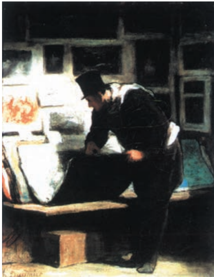
تصویر ۳-۶ — اثر انوره دومیه، رنگ روغن روی بوم

دومیه ۱ ، در تصویر (۳-۶) با تفکیک کلی فضای کار خود به روشنی و تیرگی به اثر خود عمق بخشیده است. او به پیکره انسان خیلی کلی پرداخته و از نمایش جزئیات پرهیز کرده است. چرخش روشنایی از قسمت جلوی تصویر تا سفیدی کاغذهای داخل پوشه تا کاغذهای پس‌زمینه، باعث چرخش چشم از جلو به عقب در تصویر است. دومیه با ترکیب رنگ سبز در خاکستریهای خود، قسمت پس‌زمینه اثر را که به وسیله بومها تقسیم‌بندی شده، به عقب برده است در نتیجه، پوشه کاغذها و کاغذهای کنار آن جملگی به خاطر روشنی زیاد، جلوتر دیده می‌شوند. در تصویر (۳-۷)، یک پرتره و تصویر (۳-۸)، فضای داخلی نمونه‌های دیگری از این تمرین را می‌توان دید.