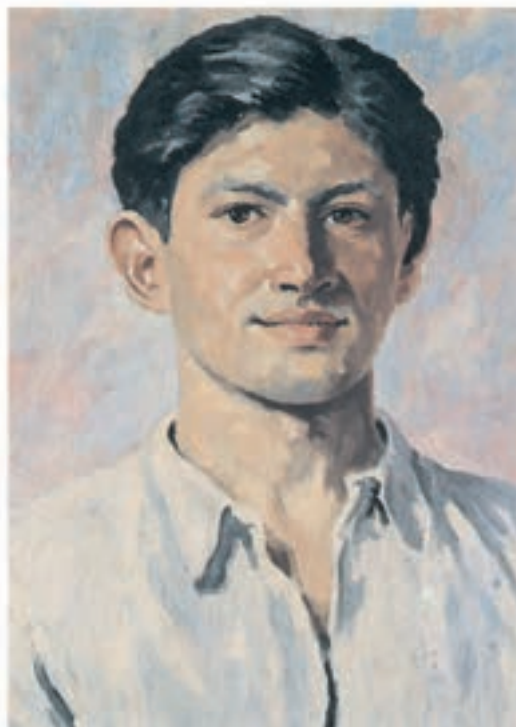
۳۹×۵۷ سانتی متر

تصویر ۲۱-۳- اثر محمود جوادی پور، رنگ روغن روی بوم