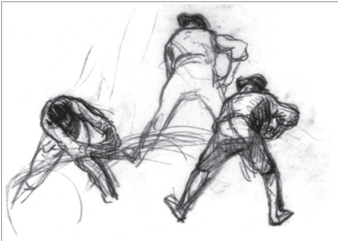
تصویر ۳-۳- اثر فرانسوا میله، طراحی با زغال