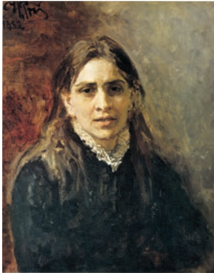
تصویر ۷-۳- اثر ایلیا رپین ۱ ، رنگ روغن روی بوم، (۶۱×۵۰ سانتی متر)