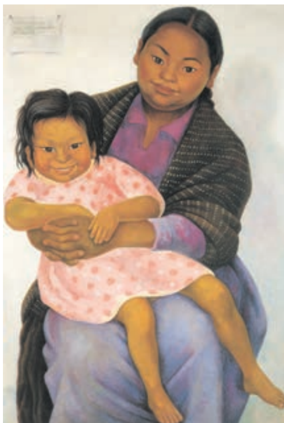
تصویر ۱۶-۳ اثر دیه‌گو ریورا، رنگ روغن روی بوم، (۱۰۴×۸۶ سانتی‌متر)

۱- RIVERA، نقاش واقع‌گرای اجتماعی مکزیکی، سده ۲۰ میلادی