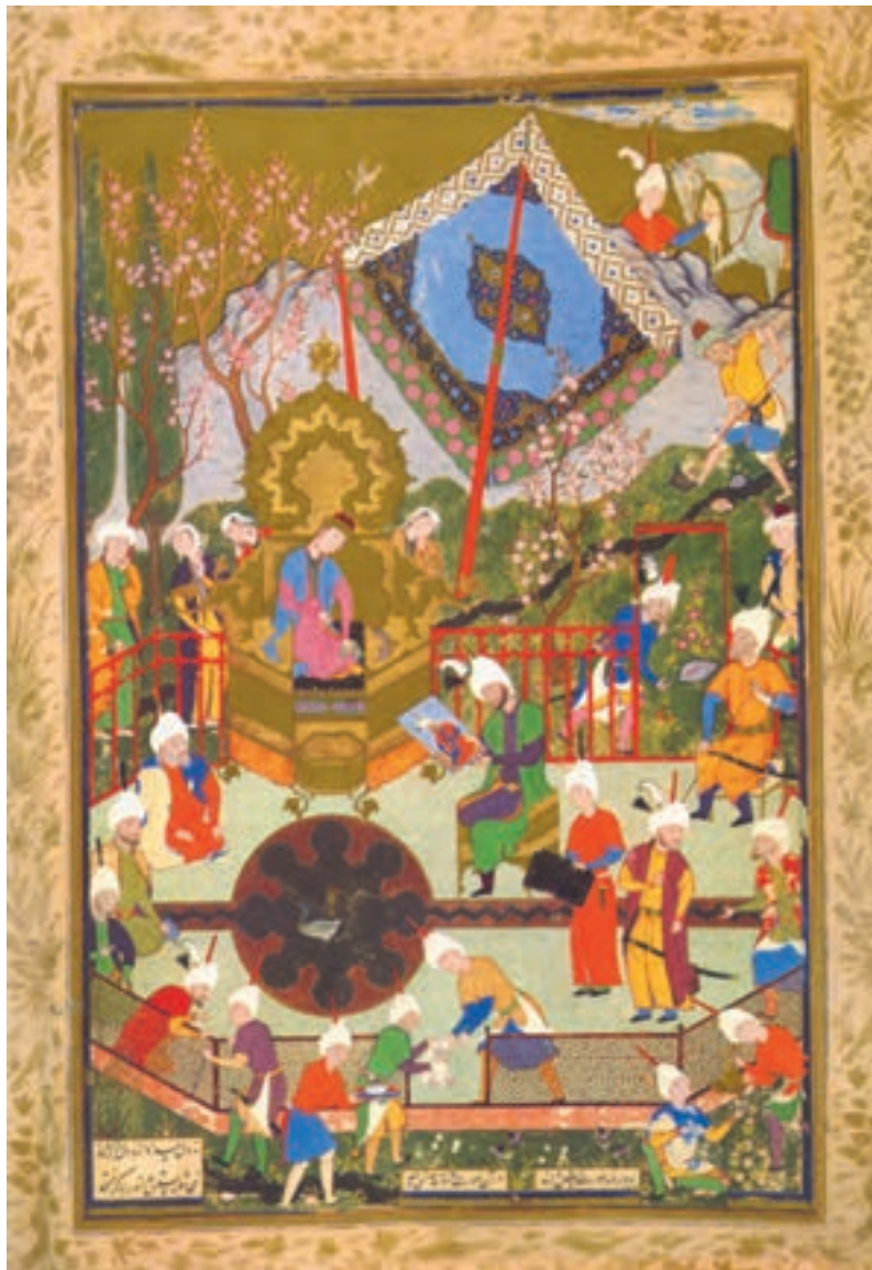
تصویر ۲۶-۳- اثر میرزا علی، نسخه خطی خمسه نظامی، سدهٔ ۱۰ هجری

رنگهای اصلی و ثانویه، در سطح اثر پخش شده‌اند و برای این که چشم، تمام تصویر را ببیند، خاکستریهای رنگی، در واقع عاملی برای چرخش چشم و تقویت رنگهای اصلی می‌شوند.