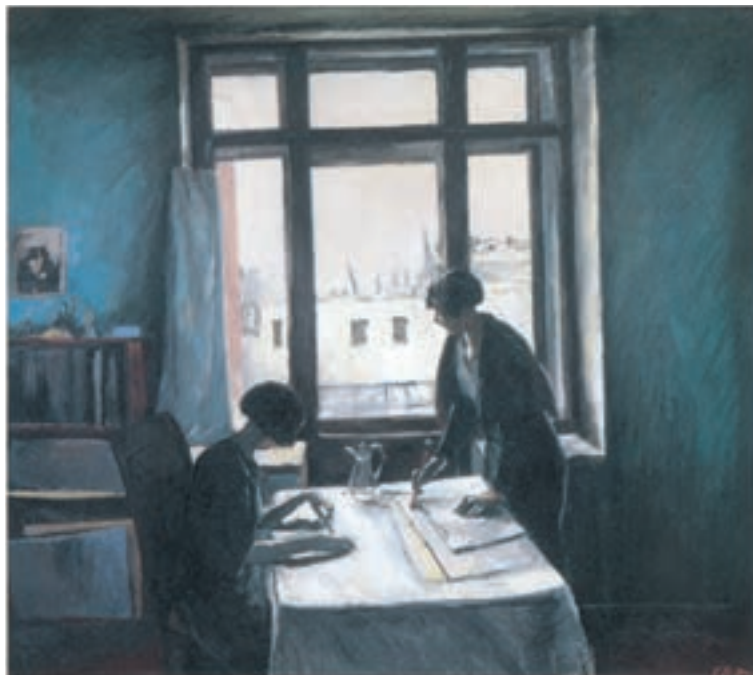
تصویر ۸-۳- اثر کنستانتین ایستومن ۲ ، رنگ روغن روی بوم، (۱۲۵/۵×۱۴۱/۵ سانتی متر)