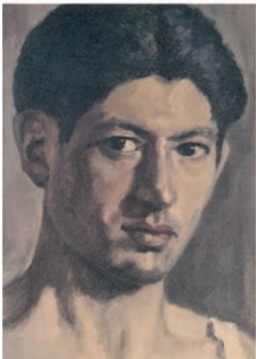
۲۷×۳۵ سانتی متر