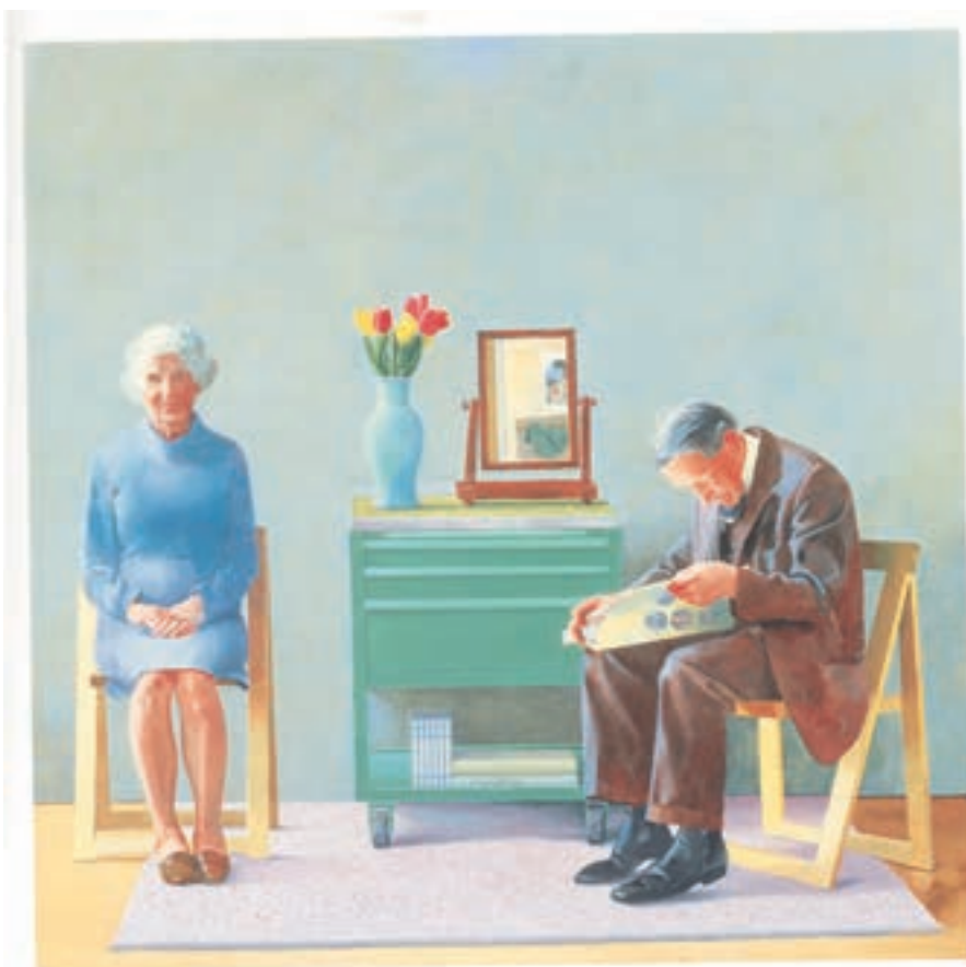
تصویر ۲۹-۳ اثر دیوید هاکنی ۱ ، رنگ روغن روی بوم، (۱۸۳×۱۸۳ سانتی متر)