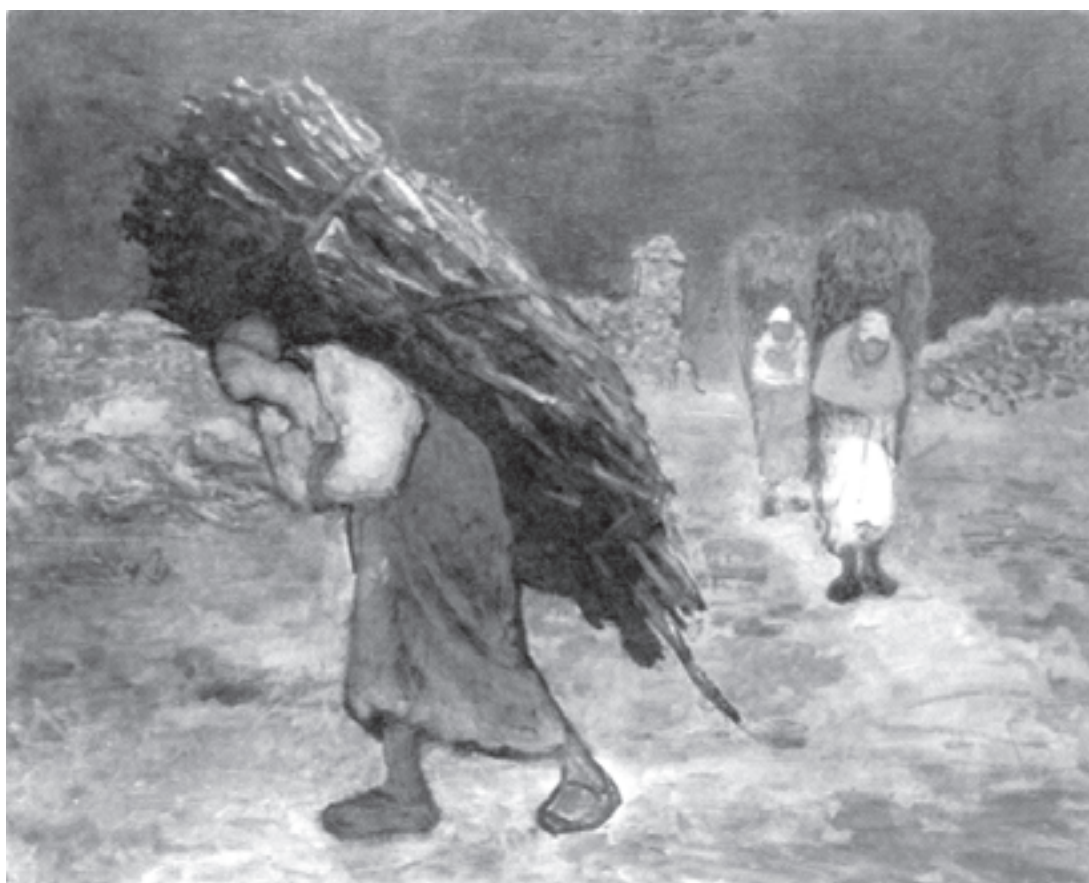
تصویر ۵-۳. اثر فرانسوا میله، رنگ روغن روی بوم، (۷۸/۷×۹۷/۸ سانتی‌متر)

پیش طرح به شما کمک می‌کند تا هنگام اجرای کار با سیاه و سفید و خاکستریهای مابین با رنگ روغن، آمادگی داشته باشید. به تصویر (۵-۳) دقت کنید میله، در این اثر طرح خطی خود را با سیاه و سفید و تعداد محدودی خاکستری مابین در جهت حجم‌پردازی پوشانده است. توجه او بیشتر بر عناصر اصلی و نورپردازی کلی کار متمرکز بوده، به همین دلیل، از پرداختن به جزئیات چهره‌ها صرف‌نظر کرده است. ملاحظه می‌کنید که حال و هوای کلی کار چنان است که نقاش، در خود، نیازی به توجه به جزئیات احساس نکرده است. در این مرحله، شما نیز می‌توانید نقاشی خود را به همین روش آغاز کنید. یعنی به حالت و شکل کلی توجه داشته باشید و به جزئیات نپردازید. نورپردازی صحیح، شما را در جهت به‌دست آوردن تیرگی و روشنیها و نیز حجم‌پردازی کمک می‌کند. کار خود را در ابتدا به سطوح کلی سیاه و سفید و خاکستریهای مابین (به تعداد محدود) تفکیک کنید. بعد در محدوده تاریکیها، خاکستریهای مایل به سیاه و در روشنیها، خاکستریهای متمایل به سفید را جاگذاری کنید تا نتیجه بهتری بگیرید.