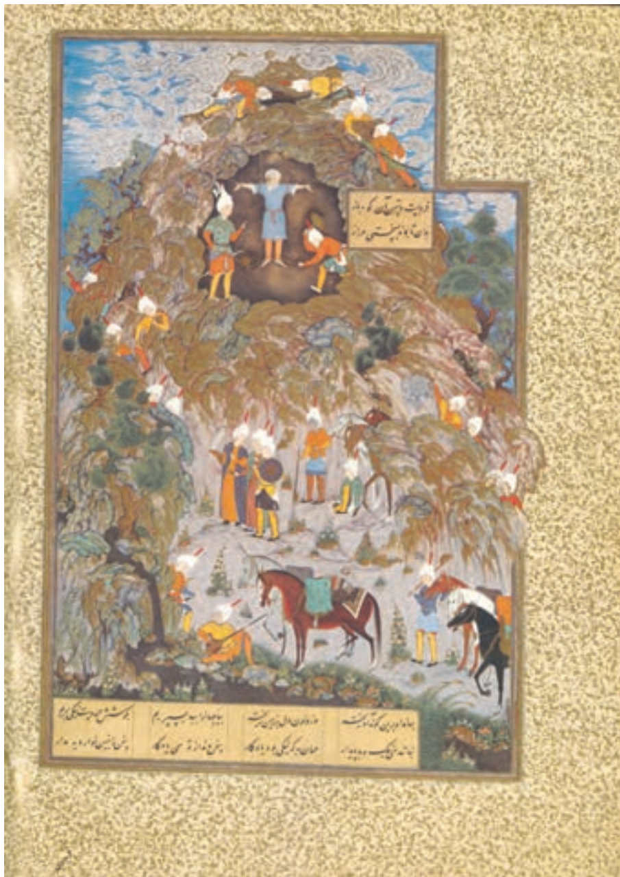
تصویر ۲۷-۳- اثر سلطان محمد، نسخه خطی شاهنامه طهماسبی، سده ۱۰ هجری

کار در کارگاه: نقاشی از انسان با خاکستریهای رنگی حاصل از ترکیب مکملها اهداف: