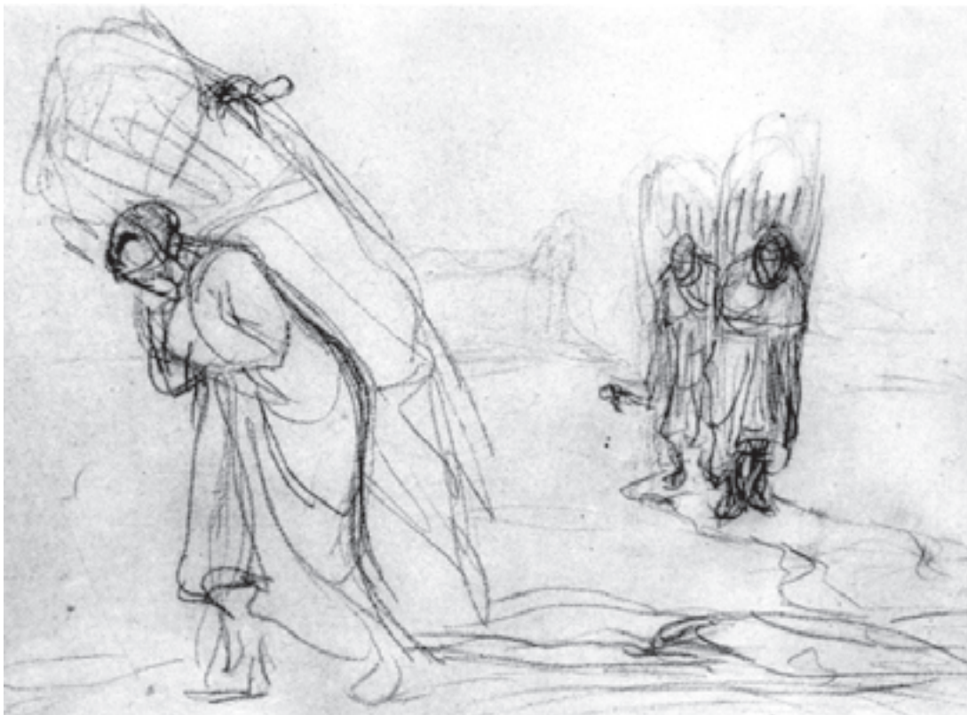
تصویر ۳-۴- اثر فرانسوا میله، طراحی با زغال