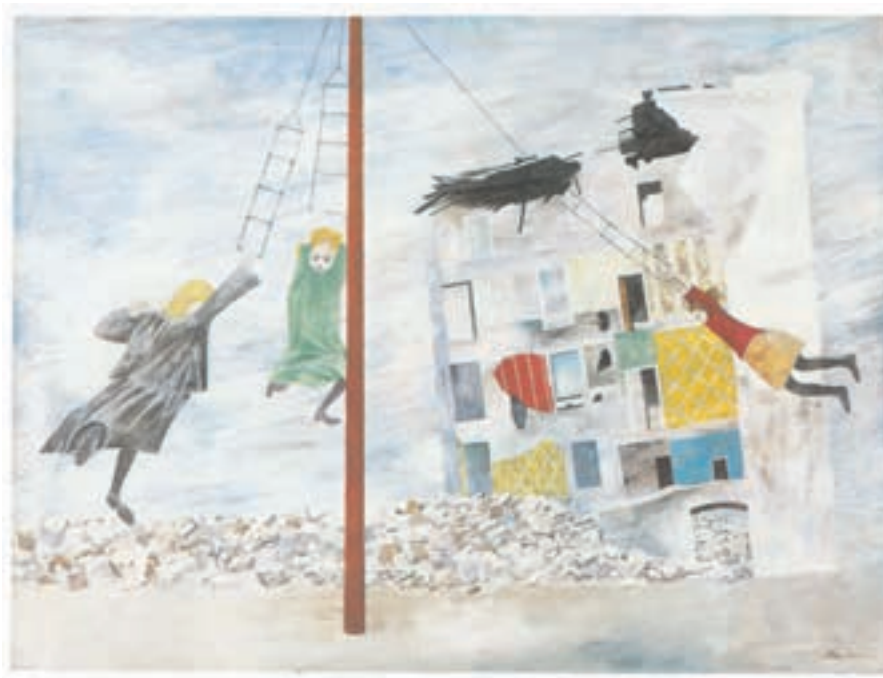
تصویر ۳۰-۳ اثر بن شان ۲ ، رنگ روغن روی بوم، (۱۰۱/۴×۷۵/۶ سانتی متر)