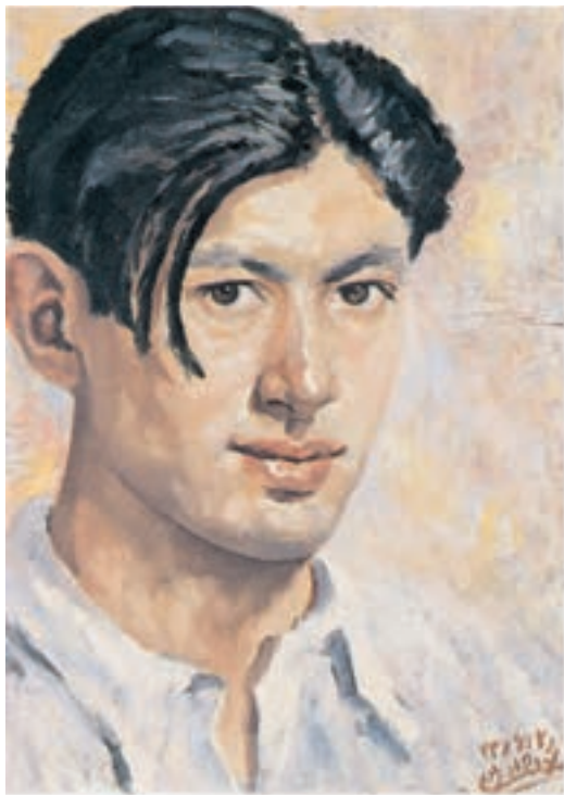
۳۰×۴۱ سانتی متر

در تصویر ۲۱-۳ چهار نقاشی از چهره هنرمند، اثر محمود جوادی پور استفاده از رنگهای گرم و سرد را در نورهای مختلف می بینیم. علی رغم این که ما محیط پیرامونی را نمی بینیم ولی بازتاب رنگهای اطراف به خوبی در چهره ها نمایان است.