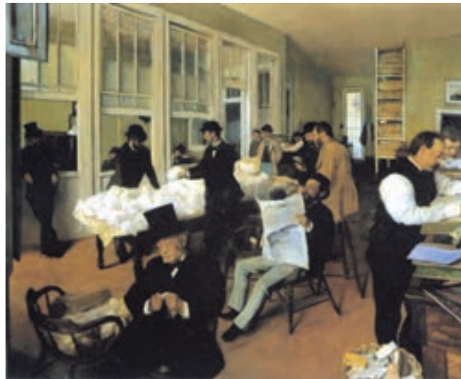
تصویر ۳-۲۴- اثر ادگار دگا، رنگ روغن روی بوم

رنگ کف اتاق در تضاد با دیوارها، گرمای فضای اتاق را که ناشی از جنب و جوش و فعالیت است بیشتر نشان می‌دهد. اگر دیوارها و کف اتاق را خاکستری رنگی بدانیم پیکره‌های انسانی با تیرگی لباسهایشان کاملاً جلوتر دیده می‌شوند. مجموعه رنگها، یعنی خاکستریهای رنگی مایل به سبز، آبی، قهوه‌ای و سفید در کنار رنگهای قهوه‌ای تیره، هرکدام عاملی در جهت چرخش چشم در سطح نقاشی هستند. تصویر (۳-۲۵) نمونه جالب دیگری برای این برنامه است.