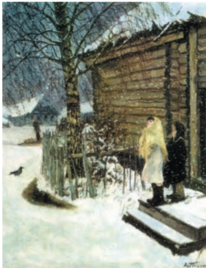
تصویر ۲۳-۳- اثر آرکادی پلاستف، رنگ روغن روی بوم، (۱۱۳×۱۴۶ سانتی متر)

تصویر (۲۳-۳) اثر پلاستف، یک روز برفی را نشان می دهد. دو کودک با شیفتگی به تماشای بارش برف ایستاده اند. این اثر از دو رنگ مکمل زرد و بنفش به همراه خاکستریهای رنگی حاصل از ترکیب دو رنگ، نقاشی شده است. رنگ زرد در روسری دخترک و بنفش در آسمان دیده می شود. زرد، به خاطر شدت درخشش نسبت به بنفش، وسعت سطح کمتری دارد. بین زرد و بنفش رنگ کلبه قرار دارد که از ترکیب این دو رنگ ساخته شده است و عامل چرخش چشم بین این دو رنگ است.