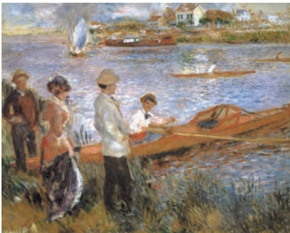
تصویر ۱۵-۳ اثر اگوست رنوار، رنگ روغن روی بوم