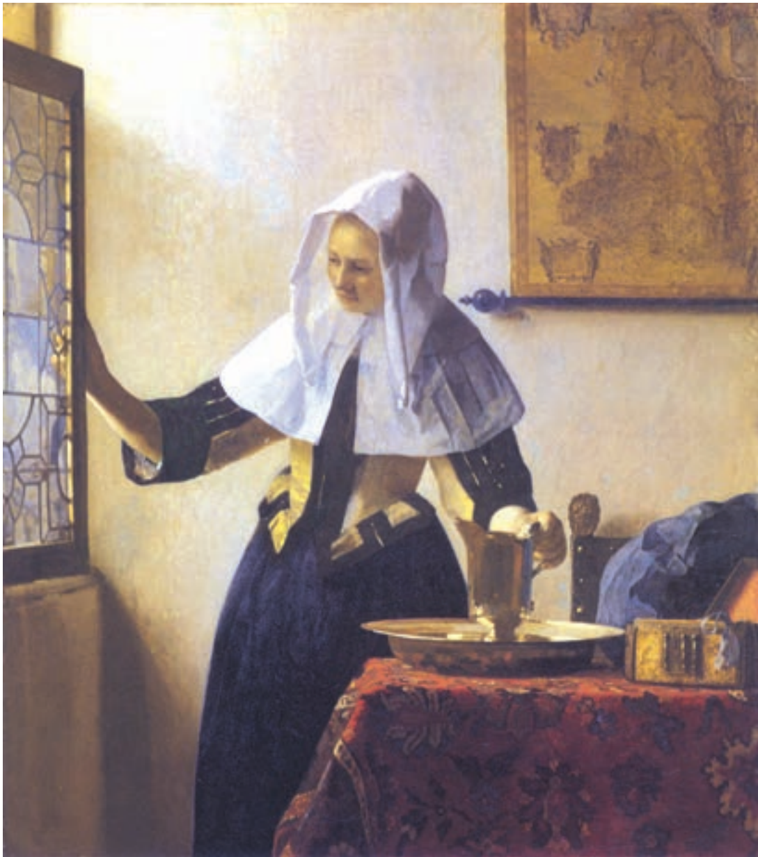
تصویر ۱-۳- اثر یان ورمیر ۱ ، رنگ روغن روی بوم، (۴۵/۷×۴۰/۶ سانتی متر)

سورا ۲ نقاش پست امپرسیونیست ۳ نیز، با استفاده از نورپردازی متمرکز در تصویر (۲-۳) توانسته است تیرگی و روشنیهای بسیار جذابی را در اثر خود ایجاد نماید. وی، استادانه، تغییر مایه سیاه و سفید را به منظور القای عمق فضایی اثرش به کار گرفته است. شما هم می‌توانید در این مرحله از تأکید بر جزئیات دوری کنید. با تار کردن چشمها، تفکیک نور و سایه کلی در کار میسر خواهد بود. این کار باعث می‌شود تا کمتر به جزئیات پردازید.