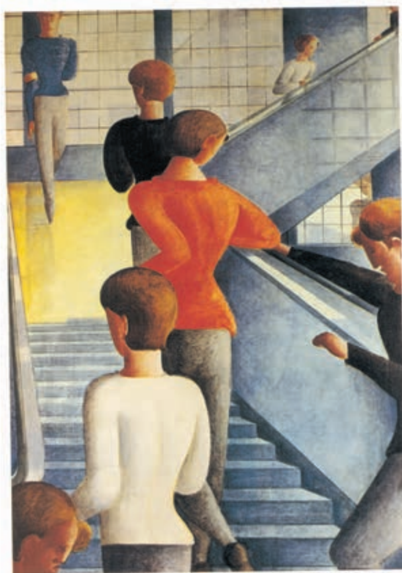
تصویر ۳-۲۸- اثر اسکار شلمر ۱ ، رنگ روغن روی بوم، (۱۱۴/۳×۱۶۲/۳ سانتی‌متر)

طرح خود را به کمک یک جفت رنگ مکمل مناسب با موضوع و خاکستریهای رنگی حاصل از ترکیب آنها، رنگ آمیزی کنید. در مرحلهٔ نخست، از یک جفت رنگ مکمل استفاده کنید تا بر تمامی خاکستریهای رنگی مسلط شوید. رفته رفته می‌توانید جفت مکملهایی دیگر به آن اضافه کنید. استفاده از ترکیبهای بیشتر نیاز به تجربهٔ عملی بیشتر شما در این زمینه دارد. (تصاویر ۳-۲۸، ۳-۲۹، و ۳-۳۰) نمونه‌هایی از به‌کارگیری خاکستریهای حاصل از ترکیب مکملها می‌باشند.