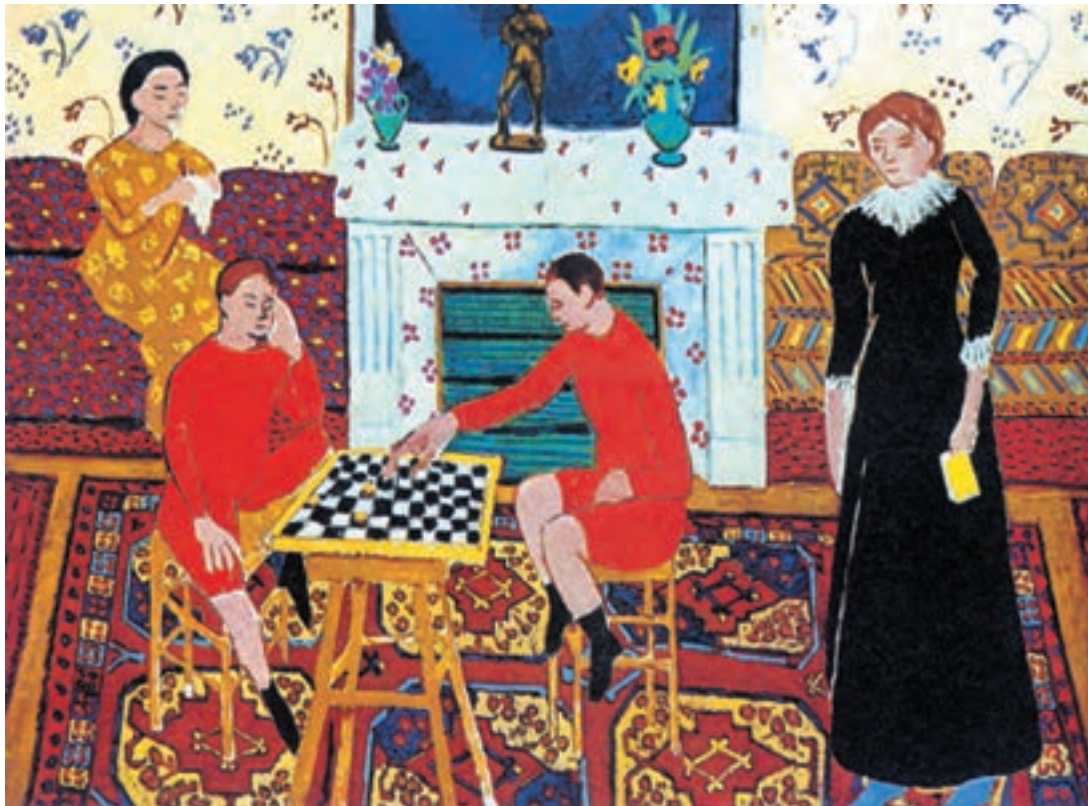
تصویر ۱۳-۳ — اثر هانری ماتیس، رنگ روغن روی بوم، (۱۹۴×۱۴۳ سانتی‌متر)

تصویر (۱۳-۳) اثر هانری ماتیس که از مجموعه چهار پیکره در فضای بسته (اتاق) شکل گرفته است می‌تواند به شما کمک کند. شما نیز به صورت آزاد و با رنگهای اصلی و ثانویه، به صورت تخت، چند فیگور را در داخل فضایی مشخص ترکیب کنید. ماتیس در این اثر آزادی و راحتی نقاشی کودکان را دارد. از طرفی پختگی و تجربه زیاد در شناخت رنگها در ترکیب چند پیکره را به نمایش می‌گذارد. دقت کنید که با وجود حذف جزئیات پیکره‌ها و چهره‌ها و اشیاء، چگونه از نقوش فرش، کاغذ دیواری و مبلمانها، برای هماهنگی و چرخش رنگها استفاده کرده است. تصویر (۱۴-۳) نیز دارای همین ویژگیهاست.