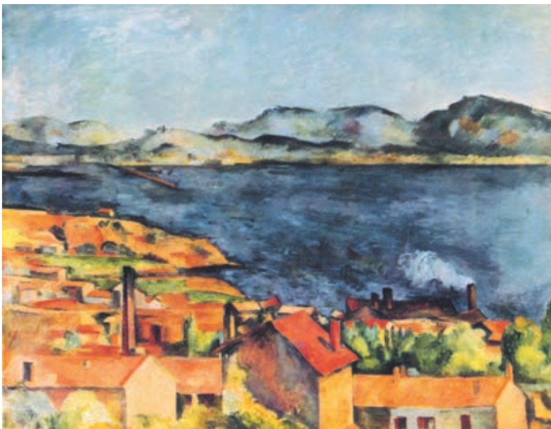
تصویر ۳۲-۲ اثر پل سزان، رنگ روغن روی بوم، (۸۰×۹۷/۷ سانتی‌متر)