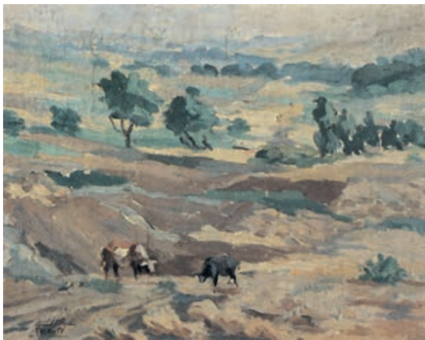
تصویر ۴۱-۲ اثر محمود جوادی پور ۲ ، رنگ روغن روی بوم، (۴۷×۶۰ سانتی متر)