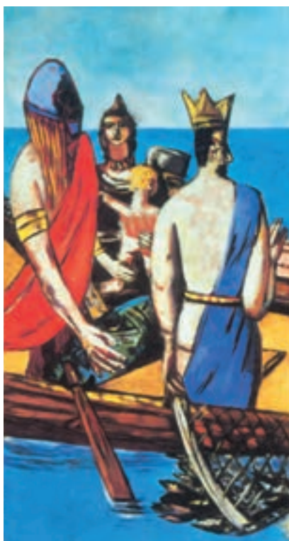
تصویر ۲۳-۳- ماکس بکمان - عزیمت - بخشی از قاب سه لوحی - ۳۲ - ۱۹۳۰ - رنگ و روغن روی بوم ۲/۲×۱۱۵ سانتی‌متر