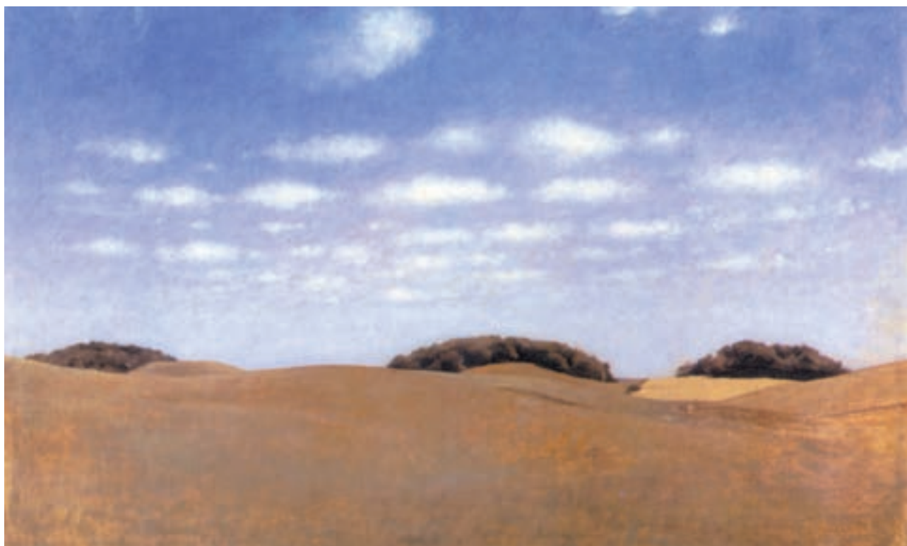
تصویر ۶۲-۲- ویلهلم هامرشوی - ۱۹۰۵ - رنگ و روغن روی بوم

پس از خشک شدن رنگ، برای محو کردن و برجسته کردن، از «رنگابه کاری» استفاده می‌شود. این کار در طبیعت برای اجزای دورتر مثل کوه‌ها و درختان دوردست و همچنین، برای ساخت و ساز ابرها استفاده می‌شود.