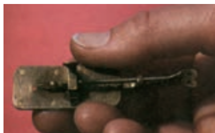
شکل ۱ - ۱ میکروسکوپ اولیه که لیون هوک ساخته بود. شکل ۲ - ۱ - اشکال ترسیم شده به وسیله لیون هوک

وی در نامه‌ای به محافل علمی چنین نوشت: «موجودات بسیار ریز برخی کروی شکل، برخی بیضوی، برخی دارای شاخکهای ریز، بعضی با ضمائی در انتهای بدن و برخی با حرکت کنه یا تند به رنگهای مختلف دیده می‌شوند.»