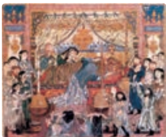
مرگ اسکندر - شاهنامه ایلخانی - تبریز