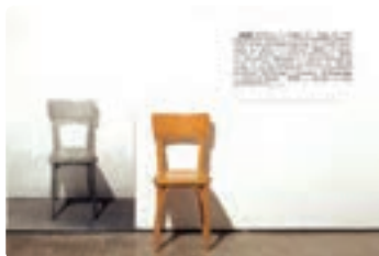
یک و سه صندلی - جوزف کاسوت

هنرمندان برجسته: پیت موندریان، مارک روتکو، جوزف آبرز، بورگان دیلر.