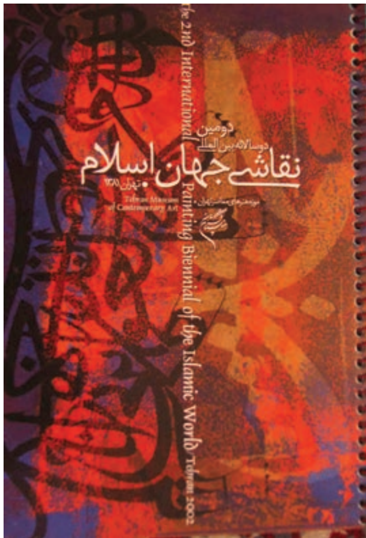
تصویر ۲۸-۳ - به کارگیری بافت در پوستر