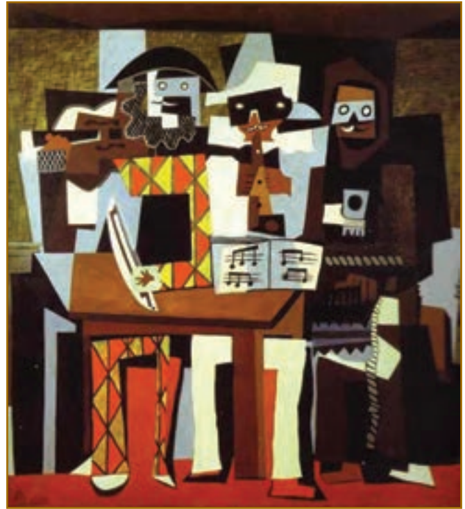
تصویر ۱۴-۳- پابلو پیکاسو، ترکیب نقاشی و کلاژ