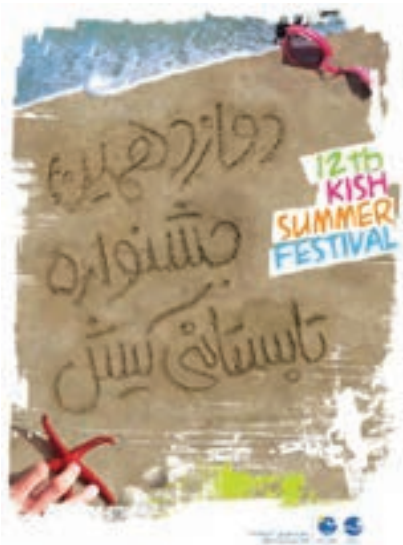
تصویر ۳۰-۳- هماهنگی موضوع و بافت در پوستر

نوع بافت به کار رفته در آثار هنری علاوه بر بیان موضوع می‌تواند معرف فرهنگ و باورهای مورد نظر هنرمند نیز باشد.