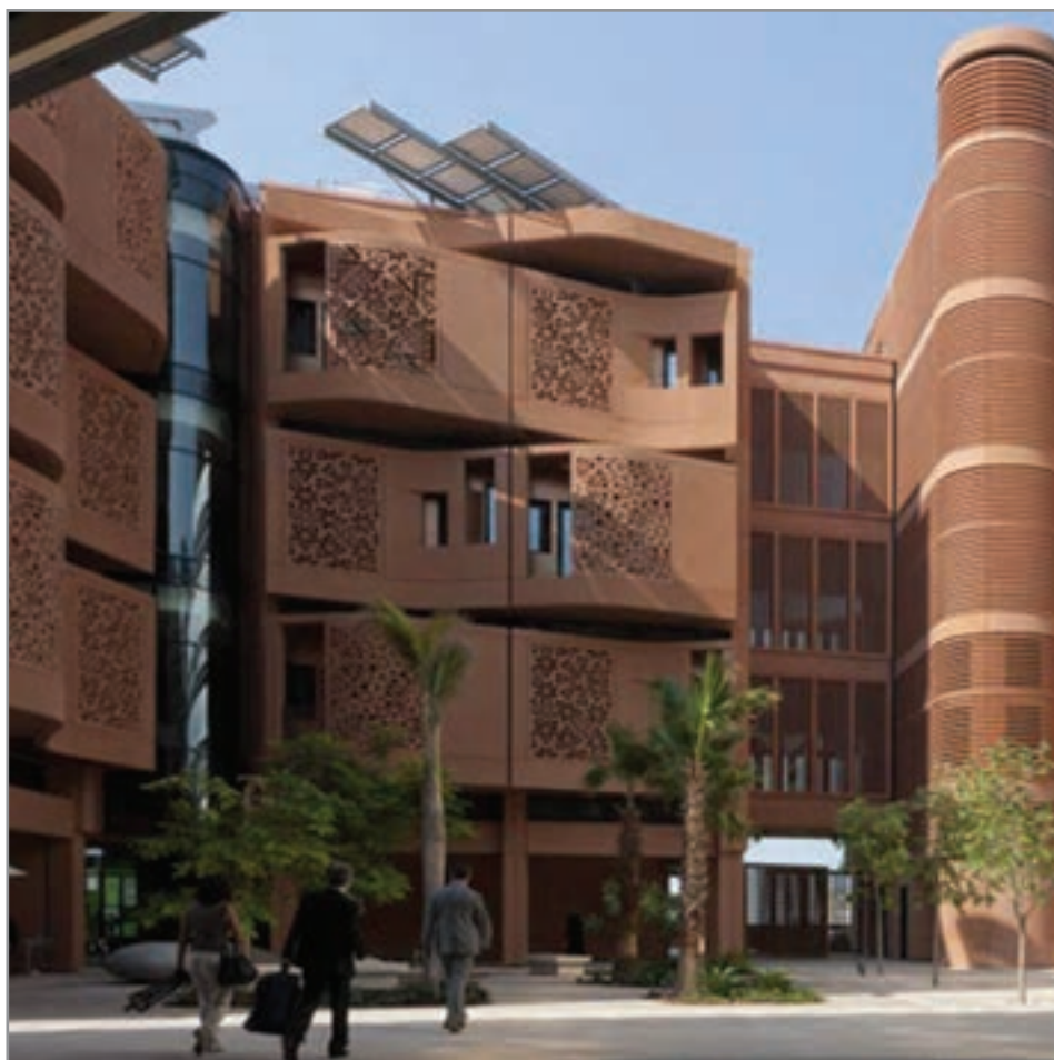
تصویر ۳-۸ در معماری به کارگیری بافت هماهنگ با فرهنگ و محیط می‌تواند جاذبه خاصی به وجود آورد

تصویر ۳-۷ ایجاد بافت با تکرار نقش مایه، گره‌چینی اسلامی