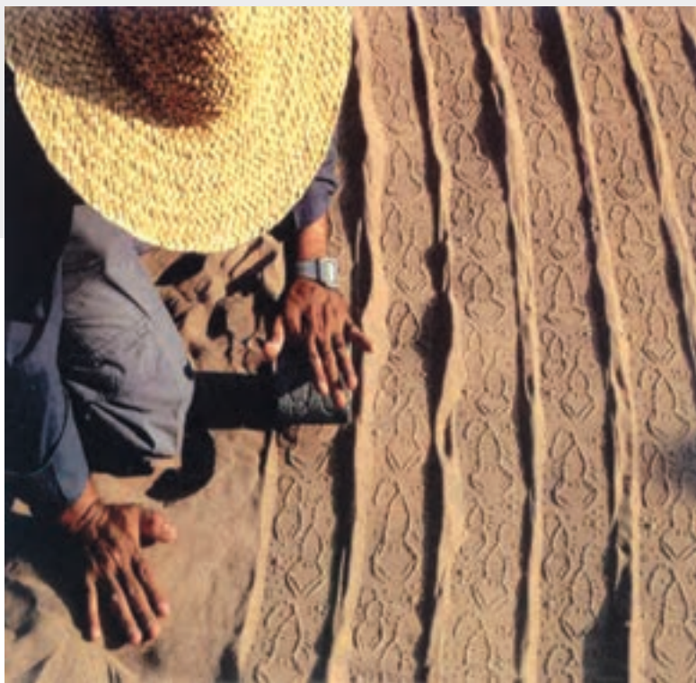
تصویر ۳-۱۹ - هنر محیطی، احمد نادعلیان