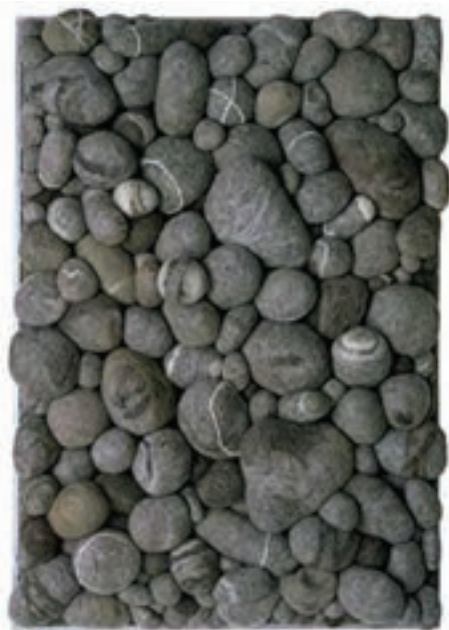
تصویر ۳-۲- نمونه‌هایی از بافت‌های بصری و بصری لامسه‌ای