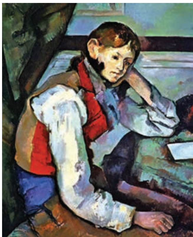
تصویر ۱۳-۳- پل سزان، پسری با جلیقه قرمز