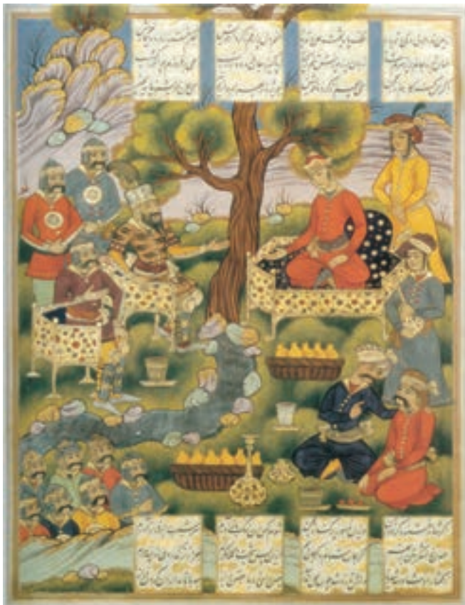
تصویر ۱۶-۳- گونه‌ای بافت در نگارگری

در نگارگری ایرانی نیز بافت از اهمیت ویژه‌ای برخوردار است و در دوران مختلف متفاوت بوده است. با مقایسه در تصاویر ۱۶ و ۱۵-۳ می‌توان تغییر نوع بافت در نگارگری ایرانی را مشاهده کرد. بافت به صورت‌های مختلفی از قبیل: ضربات نوک قلم‌مو، افشان‌گری، تکرار یک نقش‌مایه هندسی و یا به وسیله ریتیم خطوط به وجود می‌آید. و این شیوه‌ها در طول تاریخ باعث به وجود آمدن آثار بدیع و قابل توجهی بوده است. در تصویر ۱۸-۳ که توسط هنرمند معاصر صورت گرفته است به کمک همین شیوه‌ها کار شده اما جلوه‌ای کاملاً متفاوت به وجود آورده است.