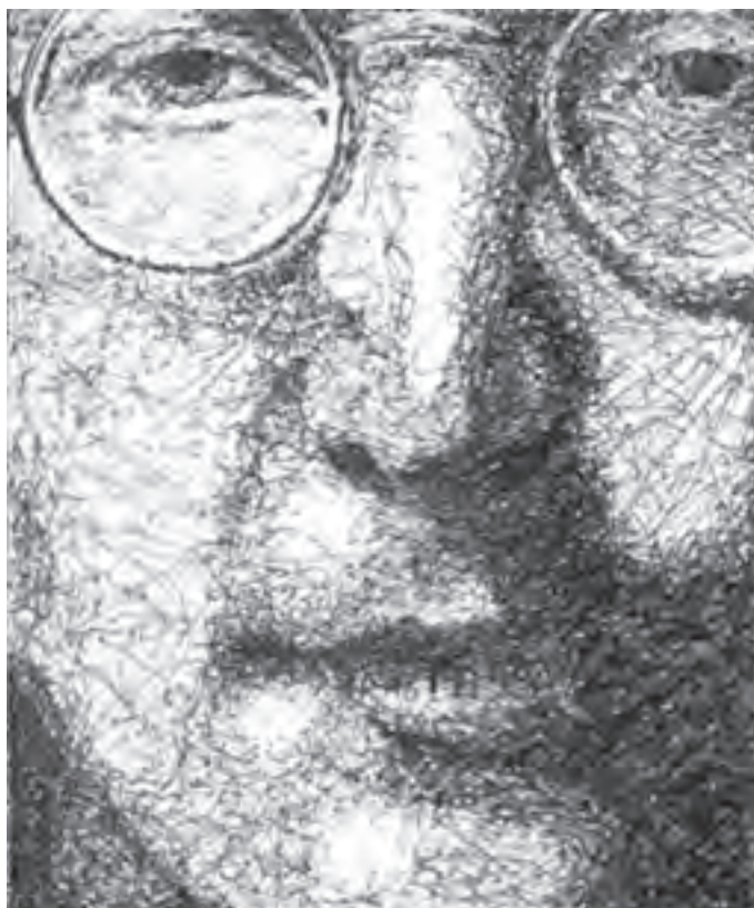
تصویر ۲۲-۳ تغییر بیان طراحی از طریق بافت طراحی با مداد و ایجاد سایه روشن