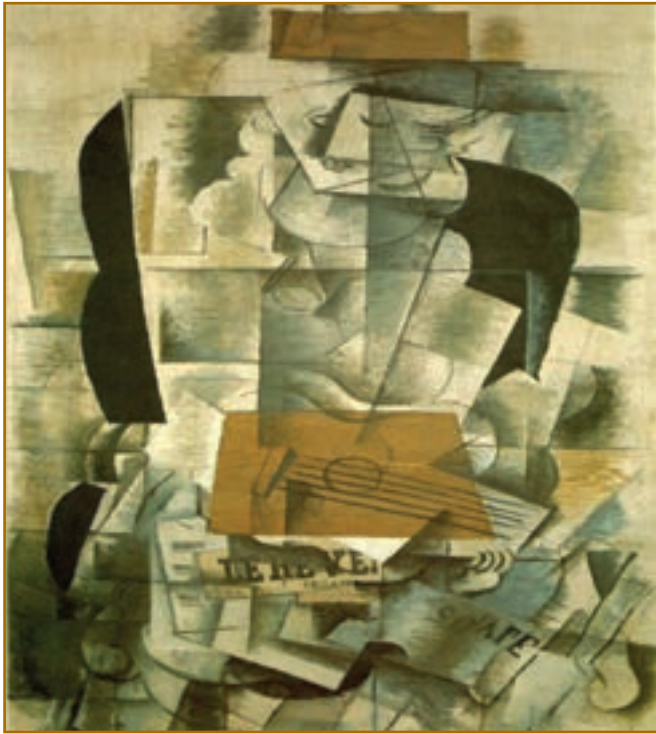
تصویر ۱۵-۳- ژرژ براک