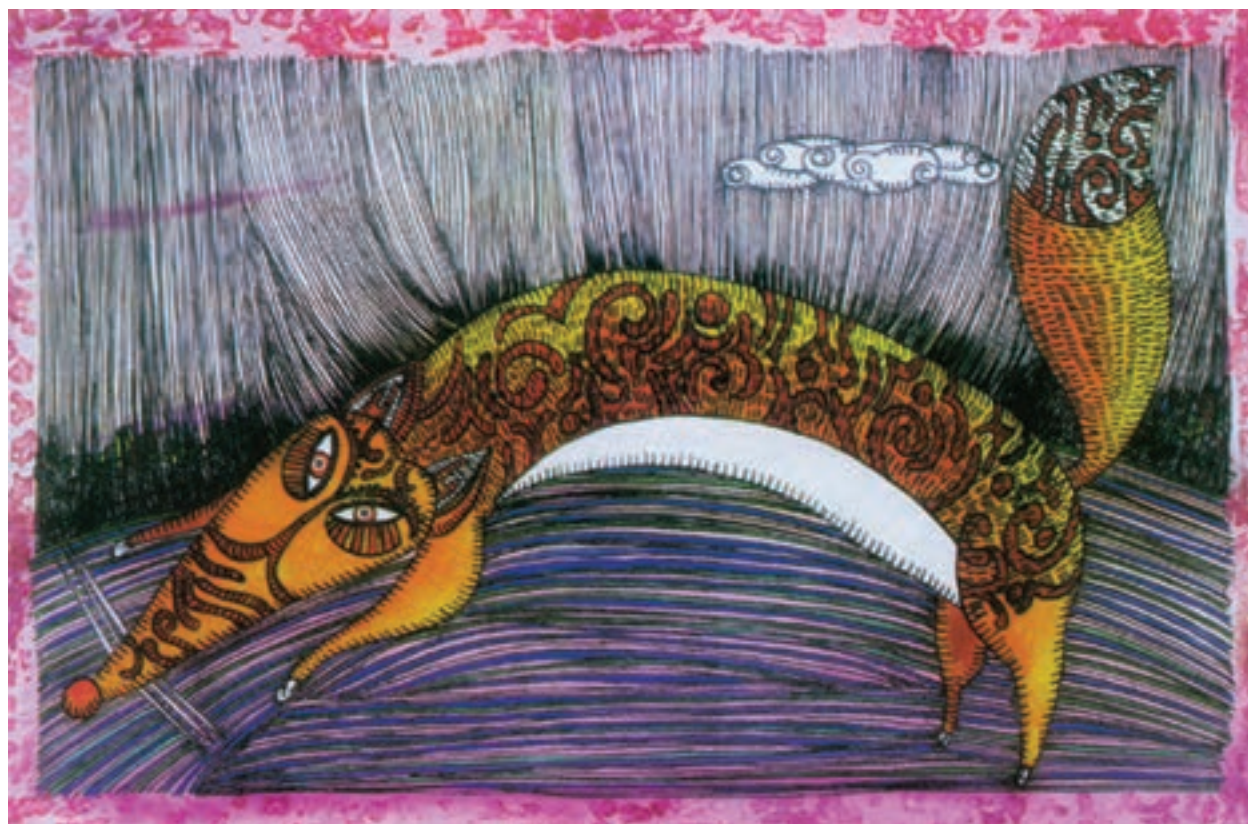
تصویر ۳-۲۱ - بافت در تصویر سازی