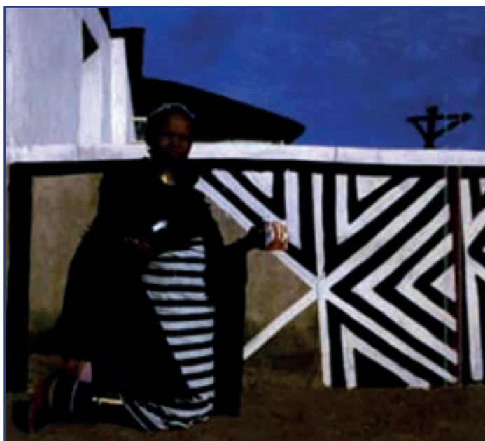
تصویر ۳-۳- نقاشی دیوار خانه برای جشن جنوب افریقا