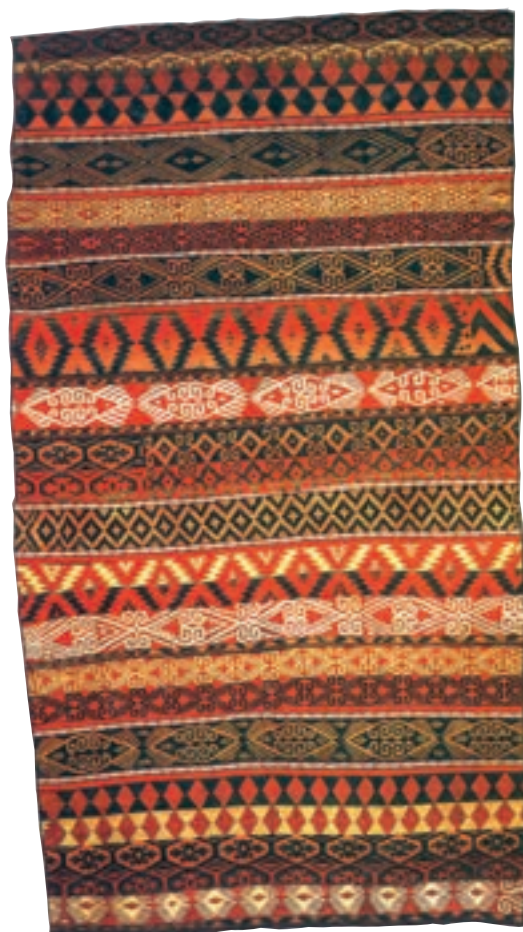
تصویر ۲۵-۳- ایجاد بافت متنوع با استفاده از نخ