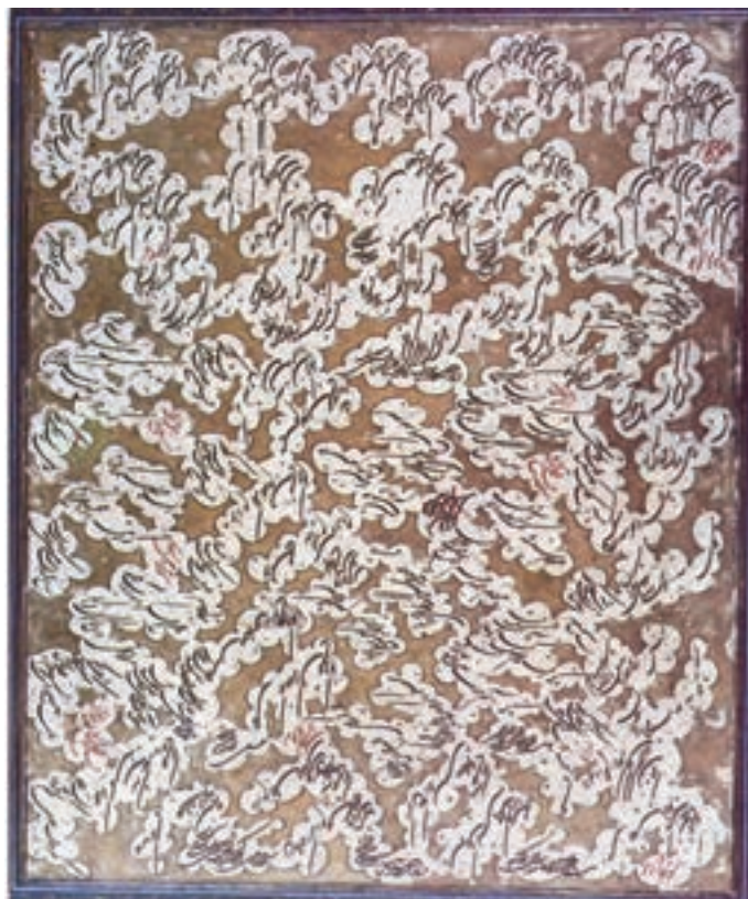
تصویر ۲۳-۳ خوشنویسی به عنوان بافت

در شیوه خوشنویسی به صورت سیاه مشق خود حروف با تکرار و تغییر ضخامت‌های متنوع به وجود آورنده بافت می‌شوند (تصاویر ۲۶ و ۲۵ و ۲۴-۳). در هنرهای کاربردی نیز نقش بافت بسیار مهم است و می‌توان گفت در بسیاری از این هنرها تنوع بافت الیاف مختلف باعث دگرگونی شده است (تصاویر ۲۸ و ۲۷-۳). به طور مثال با دقت در دست بافته‌های مناطق مختلف کشورمان می‌توانیم به این نتیجه برسیم که حتی با استفاده از مواد یکسان نیز می‌توان بافت‌های متفاوت ایجاد کرد. که این تنوع در اثر تفاوت‌های محیطی، جغرافیایی و فرهنگی است (تصویر ۲۹-۳).