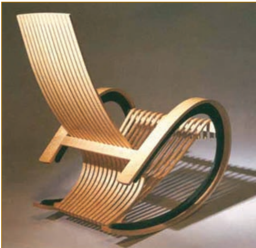
تصویر ۳-۶ خط در طراحی صنعتی — صندلی راحتی