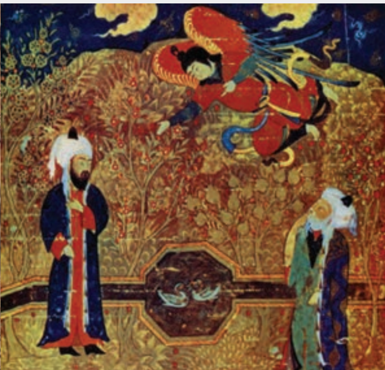
تصویر ۳-۱۷—گونه‌ای بافت در نگارگری

هنرمندان نقاش ایرانی امروزه نیز در آثارشان از بافت به شیوه‌های مدرن یعنی از طریق ترکیب مواد، بسیار بهره می‌گیرند و جلوه‌های بصری ویژه و گاهی خاص خود به وجود می‌آورند. تصاویر زیر نمونه‌هایی از این آثار می‌باشند (تصاویر ۲۱ و ۲۰ و ۱۹-۳).