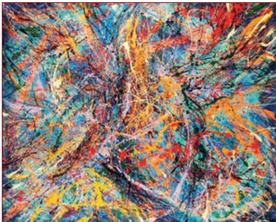
تصویر ۱-۳- جکسون پولاک، هنر کنشی (Action Painting)

بافت به عنوان یکی از عناصر هنرهای تجسمی قابلیت به وجود آوردن جلوه‌های بصری بسیاری دارد و به همین دلیل مورد توجه هنرمندان زیادی است (تصویر ۱-۳).