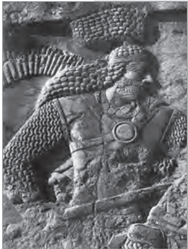
تصویر ۳-۵ نقش برجسته دوره ساسانی، اردشیر اول — فیروزآباد فارس

امروزه برخی از هنرمندان نوگرا آثار هنری خود را در سطح یا در حجم، به نحوی ارائه می‌دهند که علاوه بر جنبه‌های بصری، از طریق لامسه نیز ارتباط را به گونه‌ای دیگر برقرار می‌سازد و ممکن است یک اثر مجسمه سازی یا نقش برجسته به نحوی به وجود آید که کاملاً یا بخشی از آن از طریق حس لامسه قابل درک و فهم باشد. البته اگر میدان عمل هنرهای تجسمی را گسترده‌تر تصور کنیم و زمینه‌های جدیدی را که برخی از مواد امروزی خصوصاً برای طراحی صنعتی و هنرهای کاربردی فراهم ساخته است در نظر بگیریم، اهمیت موضوع را بهتر درک می‌کنیم (تصویر ۳-۶).