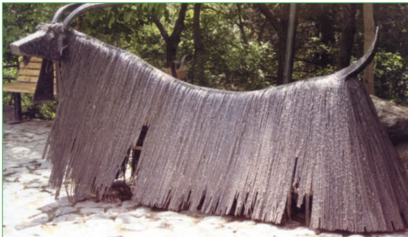
تصویر ۱۰-۳- بافت در آثار حجمی، مشهدی اسماعیل