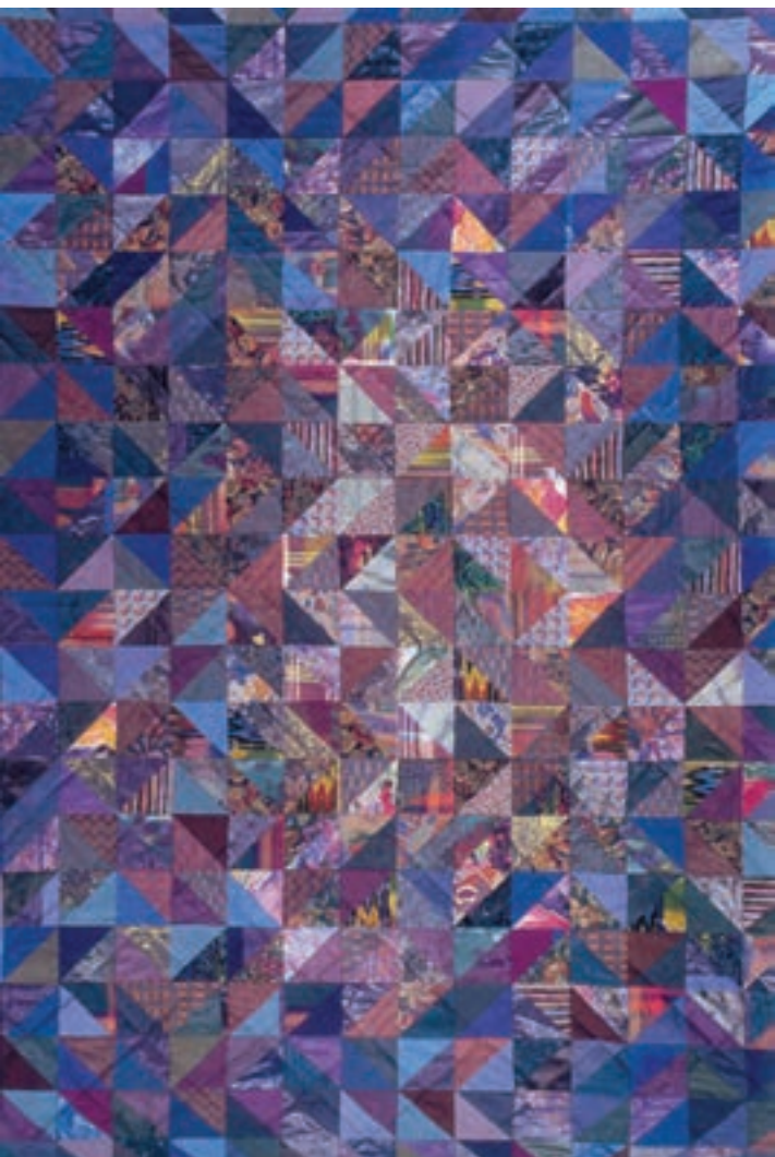
تصویر ۲۹-۳ - ایجاد بافت از طریق چهل تکه پارچه‌ای

بافت به عنوان یک عنصر ویژه در انتقال مفهوم و یا حس خاص، می‌تواند بسیار مؤثر باشد. ابزار و مواد با توجه به خاصیت وجودی و نوع به کارگیری‌شان اثرات متفاوتی در بیننده به وجود می‌آورند. هنر استفاده از بافت مناسب برای هر موضوع به ارزش اثر می‌افزاید و می‌توان گفت علت موفقیت بسیاری از هنرمندان شناخت صحیح بافت و به کارگیری آن می‌باشد (تصویر ۳۰-۳).