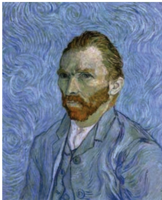
تصویر ۱۲-۳- ونسان ون گوگ، پرتره هنر

اما مهم‌ترین تحول در رابطه با کاربرد بافت در نقاشی، مربوط به زمانی است که برای اولین بار نقاشان مدرن از جمله پابلو پیکاسو و ژرژ براک علاوه بر استفاده از مواد رنگی مرسوم، اشیاء جدیدی را مانند سطوح کاغذ، روزنامه، تخته، دانه‌های شن و غیره در ترکیبات نقاشی خود به کار گرفتند تا کیفیت تصویری جدیدی را ارائه دهند و برای نمایان شدن بافت‌های بسیار متنوع در آثار نقاشان این شروع جدیدی بود (تصویر ۱۴ و ۱۵-۳).