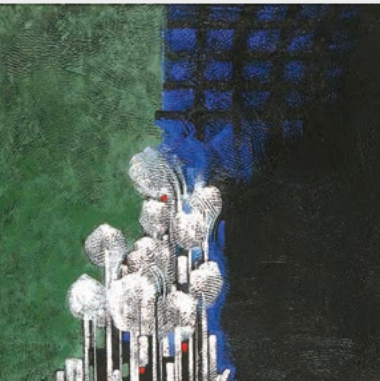
تصویر ۳-۲۰ - بافت در نقاشی، مرتضی گودرزی، نقاشی معاصر