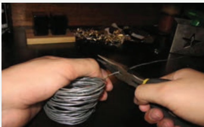
تصویر ۶۸-۱ طرز کاربرد سیم چین، دم باریک