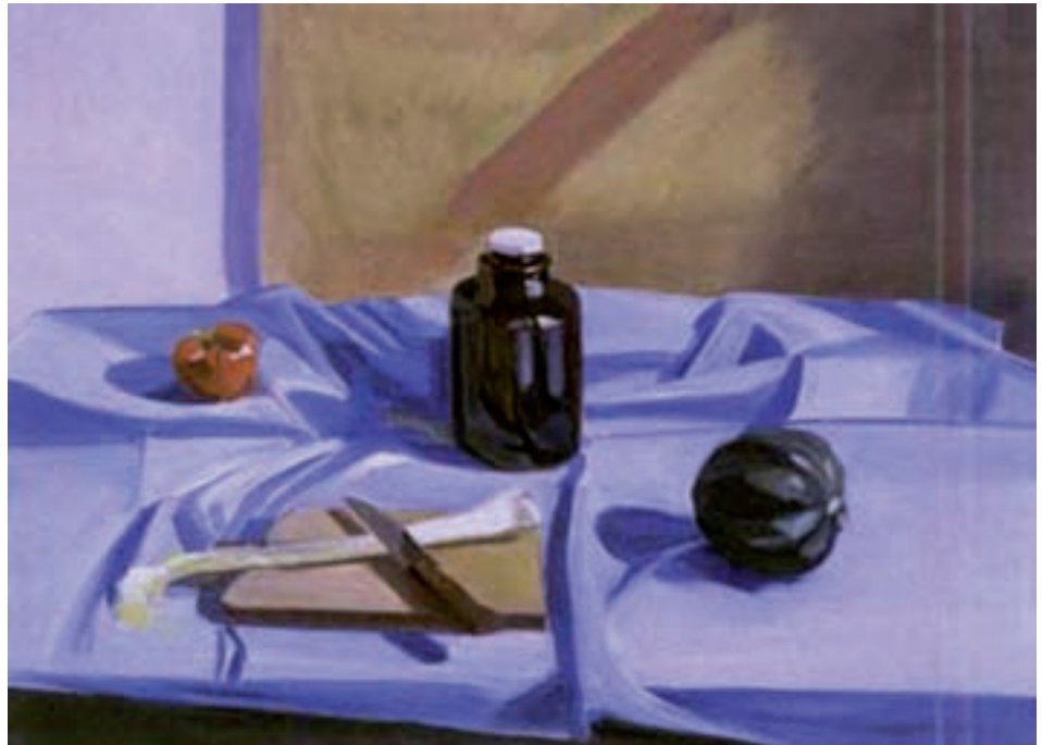
تصویر ۶۱-۱- نقاشی رنگ و روغن با تأکید بر روی خط

خط صریح و روشن : گاهی خط در آثار نقاشی به طور واضح و صریح به کار می رود . در بعضی از نقاشی های طبیعت بی جان نیز خطوط لبه های گوناگون اشیاء را معین می کنند و با وجود نبودن خطوط واقعی این نقاشی ها نیز در رده بندی نقاشی های خطی جامی گیرد (تصاویر ۶۲ و ۶۱-۱).