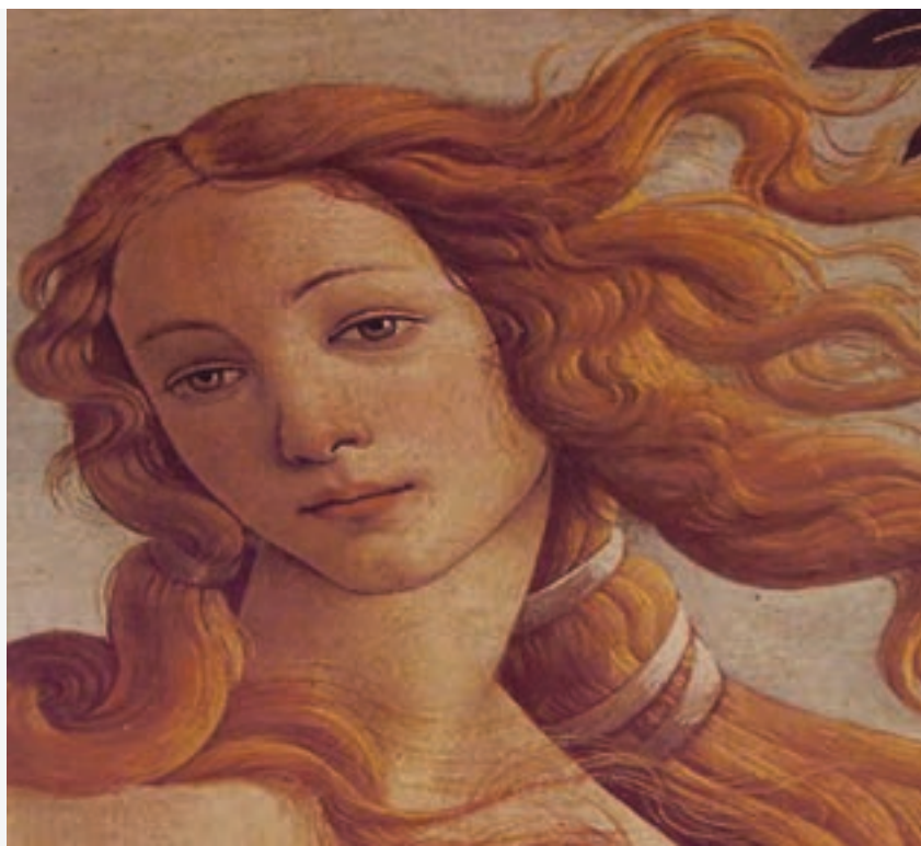
تصویر ۶۰-۱ بخشی از اثر تولد ونوس - ساندرو بوتیچلی

خط در نقاشی می‌تواند عنصر مهمی باشد، زیرا یک نقاشی با فضای رنگی نسبت به طراحی از محدودیت کم‌تری برخوردار است، رنگ و خط می‌توانند مکمل یکدیگر باشند. وقتی هنرمند عمداً خط را به عنوان خطوط محیطی در نقاشی در نظر می‌گیرد، خط از ارزش زیادی برخوردار می‌شود زیرا به وسیله تیره و ضخیم شدن آن تصویر مورد نظر مشخص می‌گردد. به کمک تکرار و تغییر در کیفیت خط در نقاشی می‌توان بافت‌های متنوع و بدیعی به وجود آورد. (تصویر ۶۰-۱).