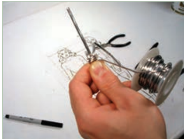
تصویر ۱-۶۹- نحوه ایجاد حلقه ها جهت تولید فرم یا گره ، سیم