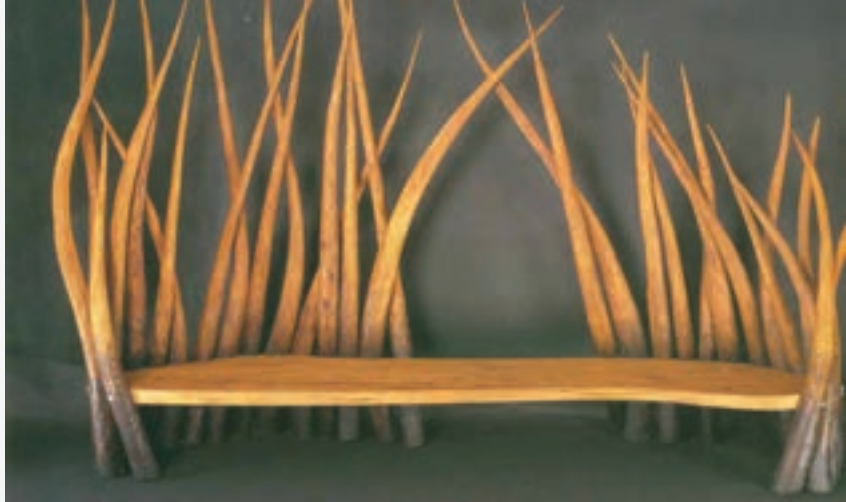
تصویر ۵۹-۱ کاربرد خط در طراحی اشیاء کاربردی

خط در نقاشی می‌تواند عنصر مهمی باشد، زیرا یک نقاشی با فضای رنگی نسبت به طراحی از محدودیت کم‌تری برخوردار است، رنگ و خط می‌توانند مکمل یکدیگر باشند. وقتی هنرمند عمداً خط را به عنوان خطوط محیطی در نقاشی در نظر می‌گیرد، خط از ارزش زیادی برخوردار می‌شود زیرا به وسیله تیره و ضخیم شدن آن تصویر مورد نظر مشخص می‌گردد. به کمک تکرار و تغییر در کیفیت خط در نقاشی می‌توان بافت‌های متنوع و بدیعی به وجود آورد. (تصویر ۶۰-۱).