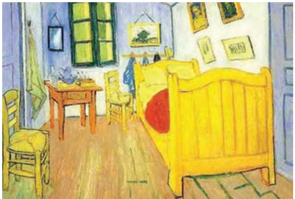
تصویر ۶۲-۱- اثری از ونگوگ