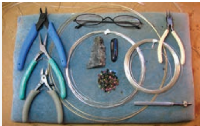
تصویر ۶۷-۱ لوازم اولیه

پیش طرح کار را به روش طراحی خطی اجرا نمایید. با خم کردن مفتول و پیچ و خم‌های لازم طرح را بوجود آورید. تا حد امکان از گره‌ها یعنی برش و اتصال پرهیز نمایید. به تصاویر با دقت توجه کنید. در اجرا به خطوط و تقسیم بندی‌ها در تصویر توجه کنید. حالات انواع خطوط را به لحاظ هویت آنها را با استفاده از سیم (ضخیم، نازک، ....) به کار بگیرید. (تصاویر ۷۶ الی ۶۷-۱)