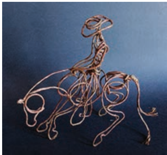
تصویر ۱-۷۳ - مراحل ساده تبدیل حجم و سه بعدی کار