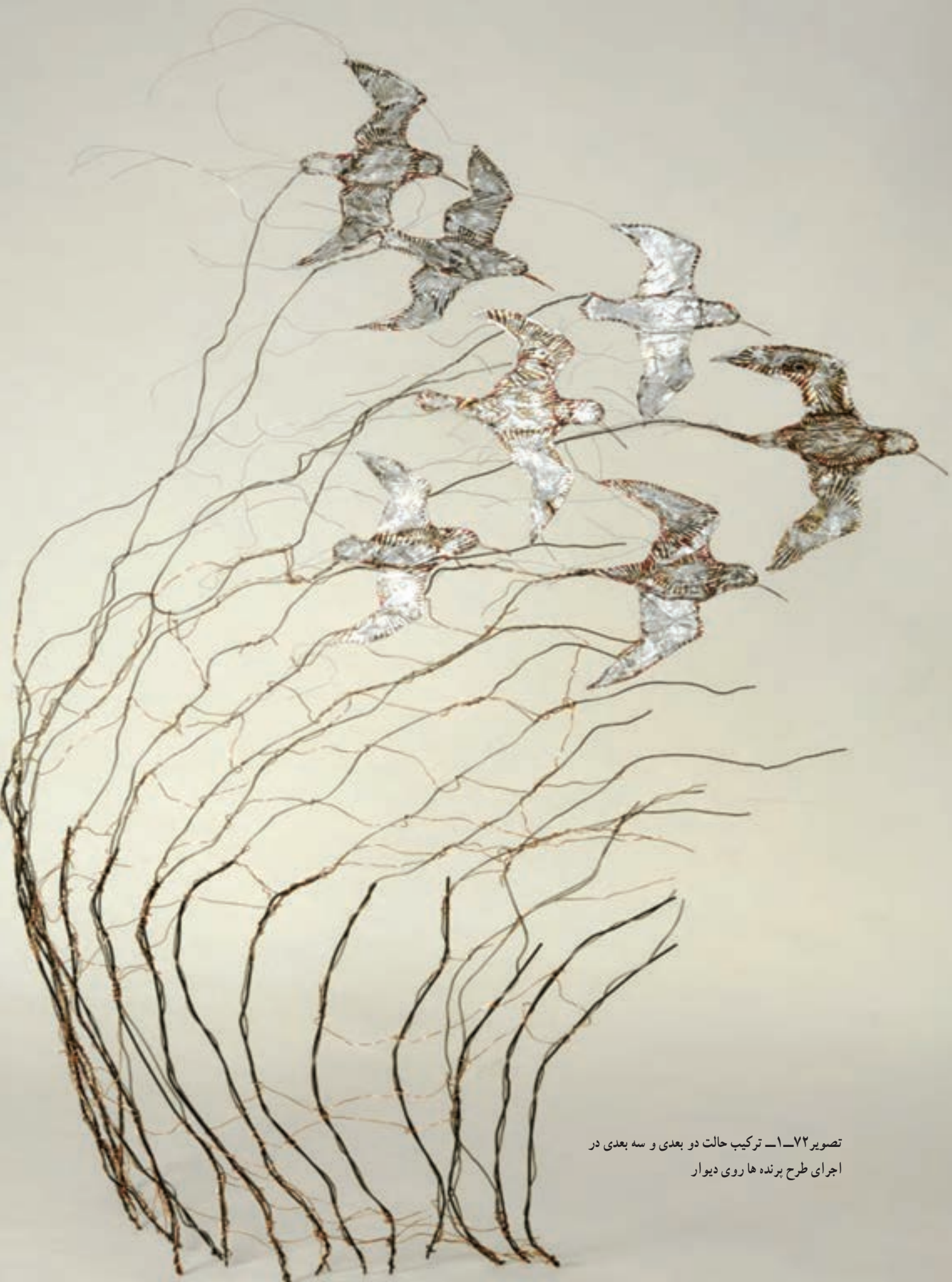
تصویر ۷۲-۱ ترکیب حالت دو بعدی و سه بعدی در اجرای طرح پرنده ها روی دیوار