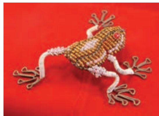
تصویر ۱-۷۴ - استفاده از منجوق برای تولید بافت در ابعاد ساده