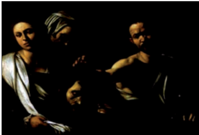
تصویر ۶۶-۱- کاراواجو