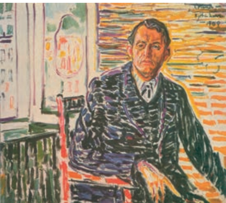
تصویر ۱-۶۳- اثری از ادوارد مونک (مونش)