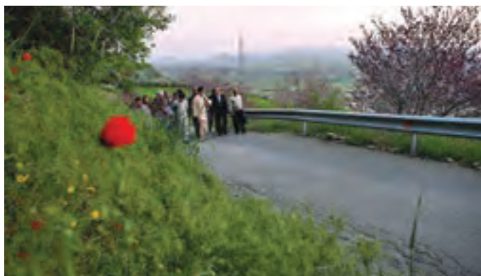
شکل ۵-۵- بازدید رهبر معظم انقلاب اسلامی از پارک کوهستانی آبیدر سنندج

● دریاچه زریبار : این دریاچه که مهم‌ترین جاذبه طبیعی گردشگری استان کردستان است، در غرب شهر مریوان واقع شده و شرق و غرب آن را دو رشته کوه پوشیده از جنگل‌های بلوط در بر گرفته است. در شمال و جنوب آن نیز، دشت‌های سرسبز بیلو و مریوان واقع شده‌اند. این دریاچه در هر فصل، چشم‌اندازهای زیبایی به نمایش می‌گذارد و شرایط مناسبی را برای گردش و تفریح در طبیعت پیرامون آن، قایقرانی، ماهی‌گیری، شنا، شکار و ... در اختیار گردشگران قرار می‌دهد. یکی از جالب‌ترین چشم‌انداز گردشگری زریبار، یخبندان سطح دریاچه در فصل زمستان است که امکان تفریح، گشت و گذار و اسکی بر روی آن را برای علاقه‌مندان فراهم می‌آورد.