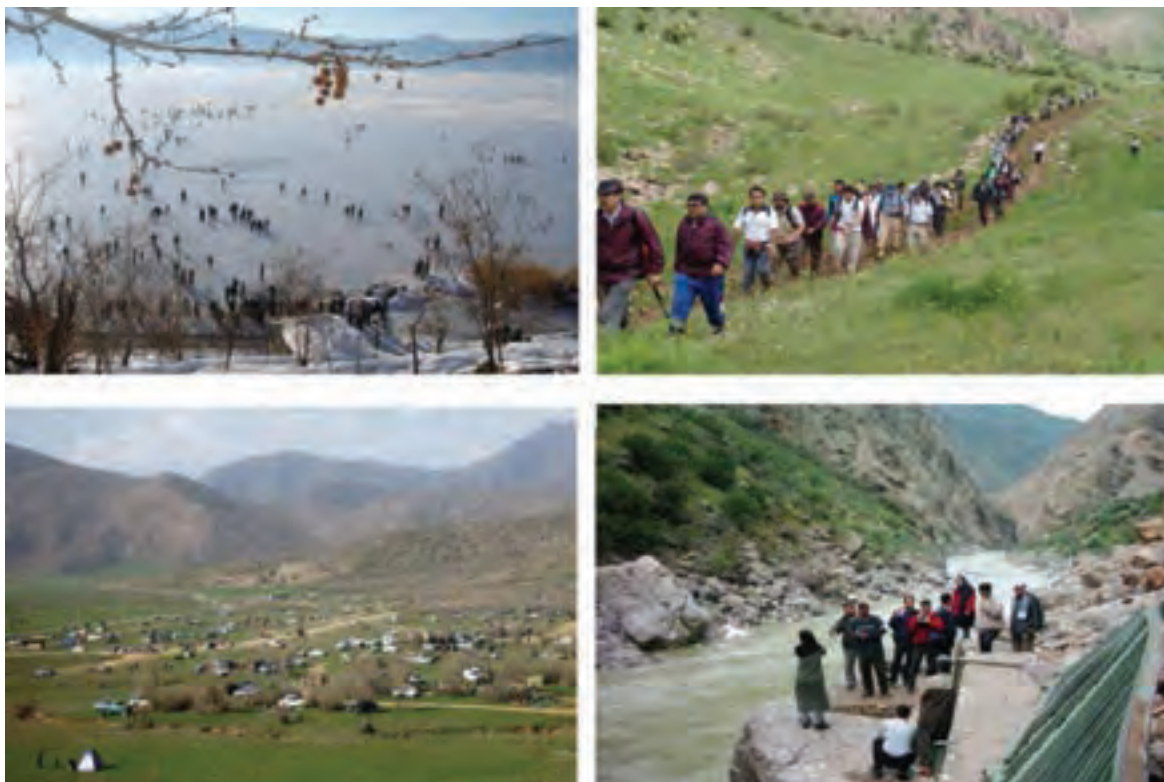
شکل ۱-۵- برخی از چشم‌اندازهای گردشگری استان کردستان

* به عکس‌های زیر نگاه کنید و بگویید چرا استان ما جزو استان‌های برتر در زمینه طبیعت‌گردی است؟