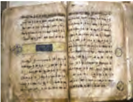
شکل ۲۱-۵ قرآن تاریخی نگل

● روستای نگل و قرآن تاریخی آن : روستای نگل در ۶۵ کیلومتری جاده سنندج - مریوان واقع شده است. بنا به روایت در قرون اولیه اسلامی، چهار جلد قرآن نوشته شده و به چهار منطقه فرستاده شده است که یکی از آن‌ها هم اکنون در مسجد روستای نگل نگهداری می‌شود. این قرآن که به خط کوفی و بر روی پوست آهو نوشته شده است، در میان مردم منطقه جایگاه خاصی دارد و به دلیل برخورداری از ارزش معنوی، هنری و تاریخی، هر ساله مشتاقان زیادی را به سوی خود جذب می‌کند.