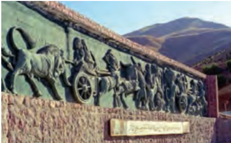
شکل ۱۳-۵- نقش برجسته زیویه در بوستان آبیدر