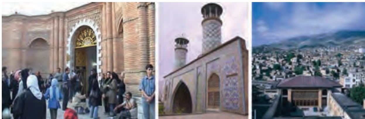
شکل ۱۰-۵- بخشی از آثار و جاذبه‌های تاریخی و فرهنگی - مذهبی استان

* آیا می‌دانید که استان کردستان یکی از کانون‌های فرهنگ و تاریخ کشور ماست و دارای آثار فراوانی در این زمینه است؟