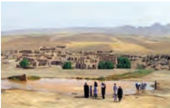
شکل ۵-۶- چشمه آب معدنی باباگرگر و بقعه امامزاده سیدجلال الدین در جوار آن