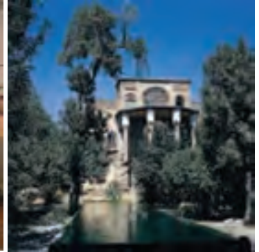
شکل ۲۰-۵ روستای تاریخی پالنگان