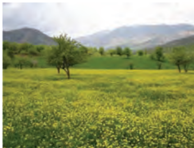
شکل ۹-۵- نمایی از طبیعت شهرستان بانه