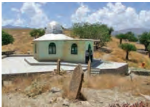
شکل ۲۴-۵- مقبره حضرت عکاشه