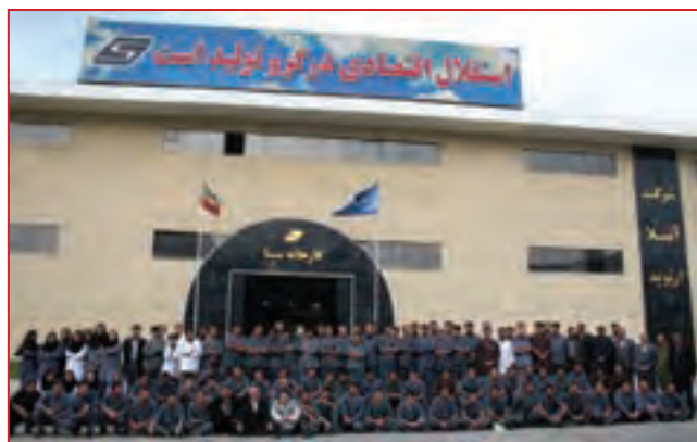
شکل ۳۸-۵- شرکت تولید تجهیزات پزشکی آتیلا ارتوپد

● شرکت تولیدی آتیلا ارتوپد: مجتمع صنایع تولید تجهیزات پزشکی شرکت آتیلا ارتوپد واقع در شهرک صنعتی شماره ۳ سنندج با برخورداری از دانش روز و به کارگیری فن‌آوری بسیار پیشرفته، برای اولین بار در کشور، لوازم جراحی تخصصی و فوق تخصصی ارتوپدی و ستون فقرات را تولید می‌کند. محصولات این شرکت که مطابق با بالاترین استانداردهای بین‌المللی توسط جوانان تحصیل کرده و متخصص استان تولید می‌شود در درمان ده‌ها هزار بیمار کشورمان از جمله بیماران مبتلا به بیماری‌های صعب‌العلاج با نتایج بسیار مطلوب مورد استفاده قرار می‌گیرد. این مجتمع تولیدی منحصر به فرد در کشور، حاصل بهره‌برداری از سه طرح از طرح‌های نه‌گانه شرکت آتیلا ارتوپد در استان کردستان است. هم‌اکنون طرح چهارم شرکت جهت تولید مفصل مصنوعی لگن در شهرک صنعتی شماره یک سنندج در حال احداث است. بدین ترتیب با راه‌اندازی طرح‌های شرکت آتیلا ارتوپد، استان کردستان در راستای اهداف و راهبردهای توسعه در بخش صنعت و معدن به قطب صنایع و تجهیزات پزشکی کشور با اشتغال‌زایی قابل توجه‌ای تبدیل خواهد شد.