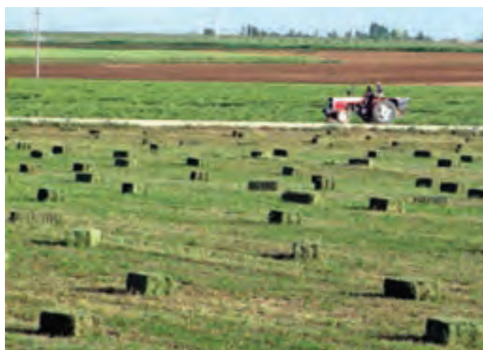
شکل ۳۰-۵ تولید علوفه یکی از توان‌های بخش کشاورزی استان

فرآورده‌های دامی استان: فرآورده‌های دامی مانند: گوشت قرمز، شیر، پنیر، و محصولات فرعی نظیر چرم و پوست، موهر و کُرک از جمله محصولات مهم استان به شمار می‌روند. کُرک بز مرخز کردستان بسیار مرغوب است و در تولید انواع لباس و صنایع دیگر از آن استفاده می‌شود. بز مرخز که خاستگاه آن استان کردستان است، شهرت جهانی دارد. یکی دیگر از دام‌های اصیل استان کردستان، اسب کُردی است.