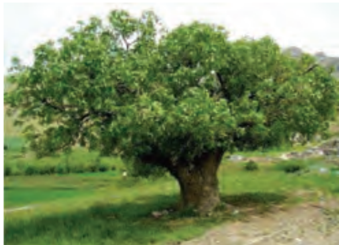
شکل ۲۷-۵- درخت بنه

قابلیت توسعه باغداری از دیگر توانمندی‌های بخش کشاورزی استان ماست. از میان محصولات کشاورزی و باغی کردستان ۱۰ محصول به ترتیب اولویت در زمینه میزان تولید، سرمایه‌گذاری و صادرات از سایر محصولات برجسته‌ترند که عبارت‌اند از: توت‌فرنگی، گردو، انگور، زردآلو، هلو، شلیل، سیب، بادام، به، گیلان و آلبالو. در استان کردستان گیاهان دارویی و صنعتی و میوه‌های نسبتاً منحصر به فرد (توت‌فرنگی و انگور دیم) تولید می‌شود، به طوری که استان ما بالاترین میزان برداشت توت‌فرنگی در سطح کشور را دارد. گذشته از آن با توجه به برخورداری استان کردستان از شرایط مناسب کشت چغندر قند، دانه‌های روغنی و درختان بنه، هم‌چنین فراوانی بوته‌گون، شیرین بیان و تنوع سایر گیاهان دارویی، می‌توان به ایجاد صنایع تبدیلی مرتبط با این محصولات اقدام کرد.