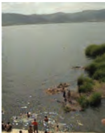
شکل ۴-۵- دریاچه زریبار مریوان

● دریاچه زریبار : این دریاچه که مهم‌ترین جاذبه طبیعی گردشگری استان کردستان است، در غرب شهر مریوان واقع شده و شرق و غرب آن را دو رشته کوه پوشیده از جنگل‌های بلوط در بر گرفته است. در شمال و جنوب آن نیز، دشت‌های سرسبز بیلو و مریوان واقع شده‌اند. این دریاچه در هر فصل، چشم‌اندازهای زیبایی به نمایش می‌گذارد و شرایط مناسبی را برای گردش و تفریح در طبیعت پیرامون آن، قایقرانی، ماهی‌گیری، شنا، شکار و ... در اختیار گردشگران قرار می‌دهد. یکی از جالب‌ترین چشم‌انداز گردشگری زریبار، یخبندان سطح دریاچه در فصل زمستان است که امکان تفریح، گشت و گذار و اسکی بر روی آن را برای علاقه‌مندان فراهم می‌آورد.