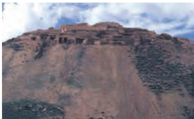
شکل ۱۱-۵- قلعه باستانی زیویه

● قلعه باستانی زیویه : این قلعه در ۴۵ کیلومتری شرق سقز و در شمال روستای زیویه واقع شده است. قلعه زیویه هم از نظر معماری و هم از نظر آثار هنری یکی از شاخص‌ترین مکان‌های تاریخ ایران باستان محسوب می‌شود و مربوط به اقوام مان‌نایی و ماد است که ۲۷۰۰ سال پیش در شمال غرب ایران حکومت می‌کرده‌اند. اشیای به دست آمده در این قلعه از چیره‌دستی استادان مان‌نایی حکایت دارد که از لحاظ مطالعه، سرآغاز و منشأ هنر ایران در دوران هخامنشیان است.