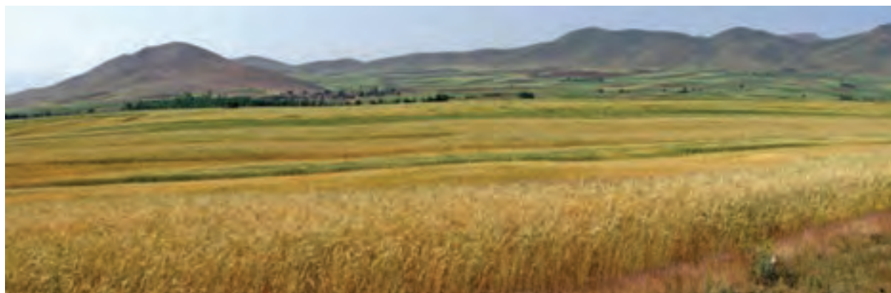
شکل ۲۶-۵- منظره‌ای از مزارع گندم استان

● زراعت و باغداری: حدود ۳۰ درصد از سطح استان (۱۰۴۵۶۸۸ هکتار) به زمین‌های کشاورزی اختصاص دارد که از این مقدار، ۱۴/۶۴ درصد زیر کشت آبی و مابقی آن به صورت دیم کشت می‌شود. استان کردستان از نظر سطح زیر کشت در کشور رتبه هفتم، سطح زیر کشت دیم رتبه اول و از نظر تولید توت فرنگی رتبه اول و تولید گندم رتبه ششم کشور را داراست. میزان تولید محصولات کشاورزی استان در سال ۱۳۸۷ در جدول ۳-۵ درج شده است.