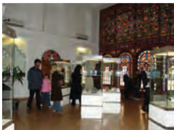
شکل ۱۷-۵- گنجینه (موزه سنندج)

● قلعه باستانی قم چقایی : این دژ باستانی در ۴۵ کیلومتری بیجار و در ۱۲ کیلومتری روستای قم چقایی قرار گرفته است. موقعیت طبیعی آن باعث شده که این قلعه از اهمیت خاصی برخوردار باشد؛ زیرا از یک سو به پرتگاهی بسیار هولناک و از سوی دیگر به دره‌ای عمیق مشرف است که رودخانه‌ای در خط القعر آن جاری است. در سمت شمالی آن که از ارتفاع کمتری برخوردار است، بقایای دیواری عریض و محکم از سنگ لاشه با ملات و برج‌های نیم استوانه‌ای قرار دارد. معماری باشکوه قلعه در کنار دره عمیق موجب شگفتی هر بازدیدکننده‌ای می‌شود.