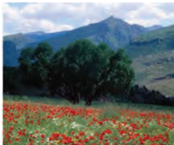
شکل ۵-۷- چشم اندازهای طبیعی و فرهنگی هورامان