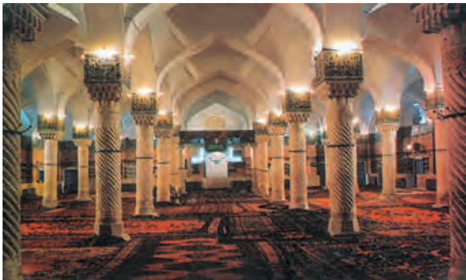
شکل ۲۲-۵ شبستان مسجد جامع سنندج