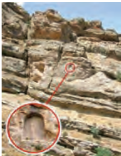
شکل ۱۶-۵- کتیبه (زینانه) تنگی ور (شهرستان کامیاران)