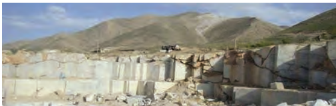
شکل ۳۶-۵- ذخایر معدنی یکی از توانمندی‌های استان

استان کردستان با ۱۹۹ معدن فعال، ذخیره قطعی ۳۸۶ میلیون تن و استخراج سالیانه ۴/۵ میلیون تن مواد معدنی یکی از قطب‌های معدنی کشور محسوب می‌شود. این استان از نظر تنوع و میزان کانسارهای معدنی بسیار غنی است؛ به طوری که ذخیره و منابع معدنی شناسایی شده و در حال بهره‌برداری استان، بسیار فراوان است و موارد مهم آن عبارت‌اند از: سنگ آهن، طلا، سیلیس، فلدسپات، خاک صنعتی، میکا، انواع سنگ‌های تزئینی، سنگ آهک، نمک، پوکه معدنی، سنگ گچ و ... .