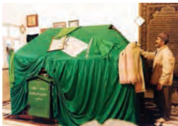
شکل ۲۳-۵- مقبره متبرکه حضرت امامزاده هاجره خاتون