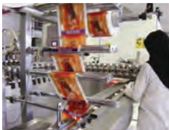
شکل ۳۲-۵ گوشه‌هایی از فعالیت‌های صنعتی در استان