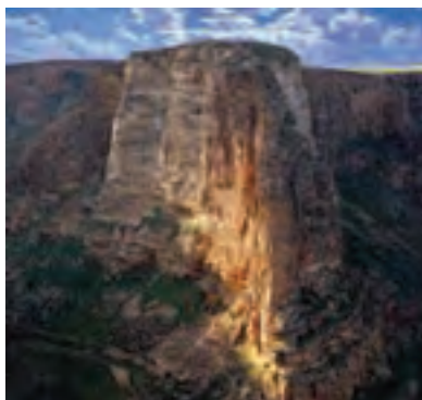
شکل ۱۵-۵- قلعه قم چقایی بیجار