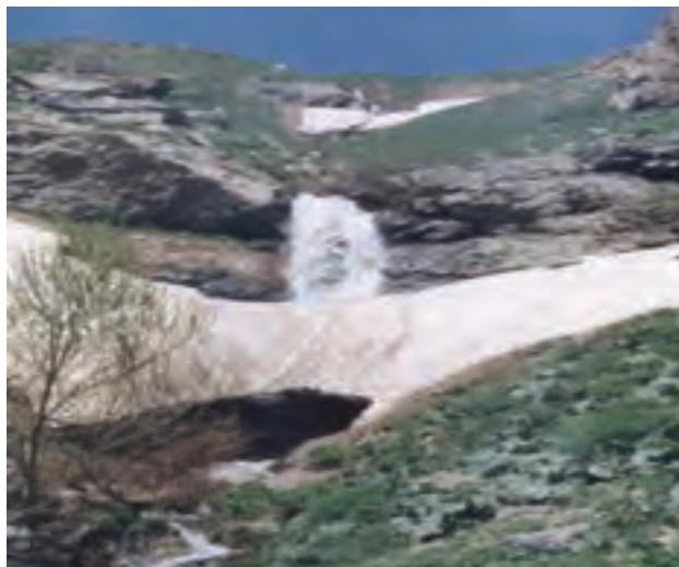
شکل ۸-۵- چشم انداز طبیعی جل چه مه