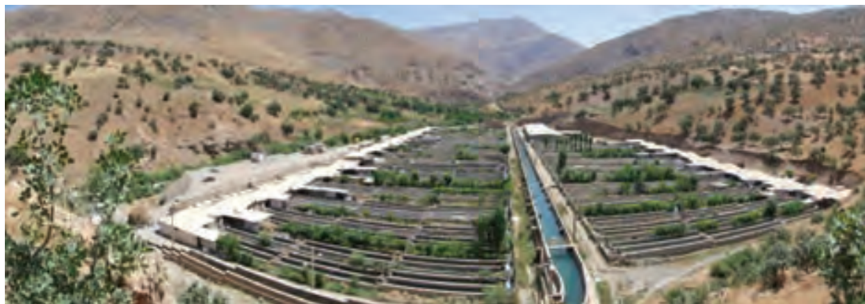
شکل ۳۱-۵ مجتمع پرورش ماهی سردآبی پالنگان