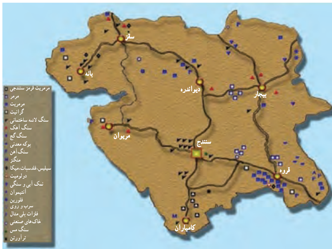
شکل ۳۵-۵- نقشه پراکندگی معادن مهم استان

استان کردستان با ۱۹۹ معدن فعال، ذخیره قطعی ۳۸۶ میلیون تن و استخراج سالیانه ۴/۵ میلیون تن مواد معدنی یکی از قطب‌های معدنی کشور محسوب می‌شود. این استان از نظر تنوع و میزان کانسارهای معدنی بسیار غنی است؛ به طوری که ذخیره و منابع معدنی شناسایی شده و در حال بهره‌برداری استان، بسیار فراوان است و موارد مهم آن عبارت‌اند از: سنگ آهن، طلا، سیلیس، فلدسپات، خاک صنعتی، میکا، انواع سنگ‌های تزئینی، سنگ آهک، نمک، پوکه معدنی، سنگ گچ و ... .