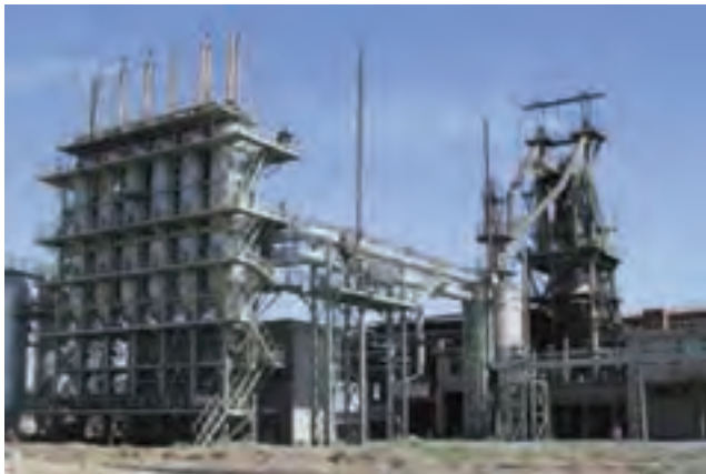
شکل ۳۳-۵ شرکت فولاد زاگرس