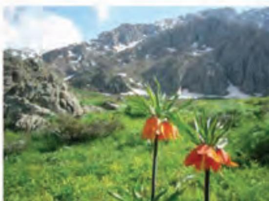
شکل ۵-۳- برخی از جاذبه‌های طبیعی استان

استان کردستان از جاذبه‌های طبیعی فراوانی برخوردار است که هر کدام به تناسب فصول مختلف سال جلوه‌های زیبای خود را در مقابل دیدگان گردشگران می‌کشایند. هریک از شهرستان‌ها و مناطق استان از چند جاذبه طبیعی زیبا مانند آبشار، سراب، غار ... برخوردار است که در این جا به برخی از مهم‌ترین آن‌ها اشاره می‌شود.