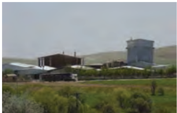
شکل ۳۴-۵ کارخانجات کاشی کسری