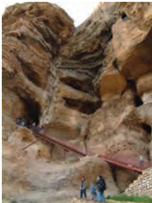
شکل ۱۴-۵- نمای بیرونی و طبقات غار کرفتو