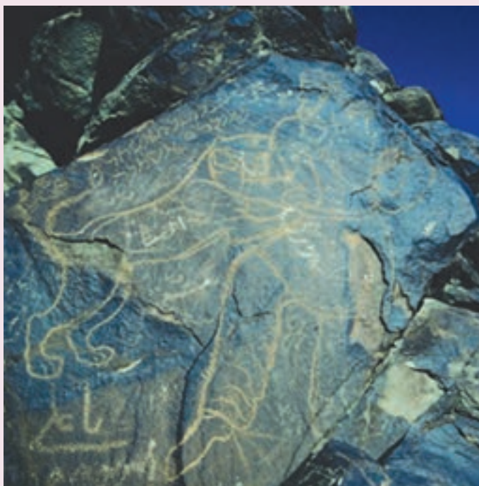
شکل ۲-۱۰- سنگ نگاره کال جنگال در جنوب غرب بیرجند

●/ استان ما در دوره ساسانی: استان ما یکی از ایالت‌های آباد و با اهمیت امپراطوری قدرتمند ایران در دوره ساسانی به حساب می‌آمد که از ۲۲۶ میلادی آغاز شده بود. در دوره ساسانی این ایالت از حیث نیروی انسانی اهمیت خاصی داشته؛ زیرا از مردمانی سلحشور، رزمجو و با استعداد برخوردار بوده است؛ به طوری که شاهان ساسانی به نیروی بازو و شهامت و همکاری آنها با دولت اطمینان خاطر داشتند.