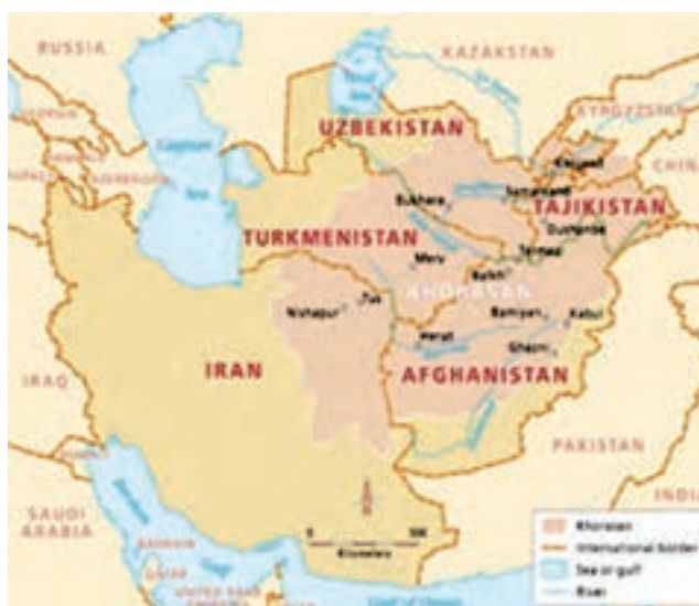
شکل ۱-۱۰ نقشه تاریخی خراسان بزرگ

* آیا می‌دانید که استان خراسان جنوبی بخشی از سرزمین ساتراپ چهاردهم در دوره هخامنشیان است؟ شما در این درس با پیشینه تاریخی استان خودتان آشنا می‌شوید.