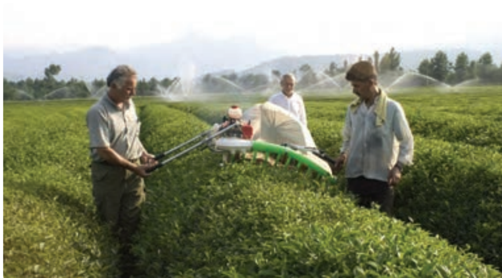
شکل ۲۵-۵ کشاورزی مدرن (مکانیزه)