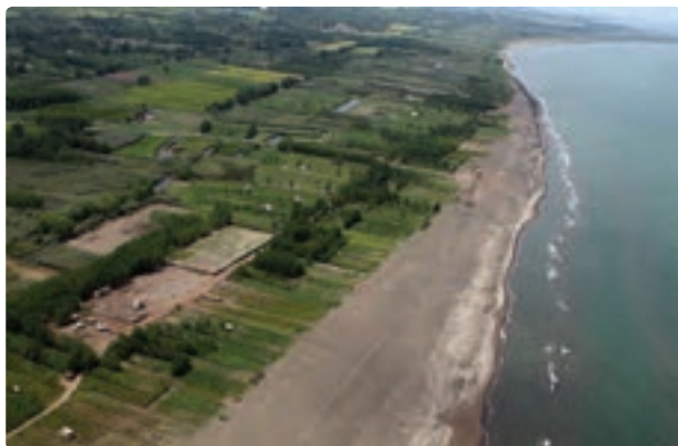
شکل ۱-۵- الف - سواحل زیبای گیلان