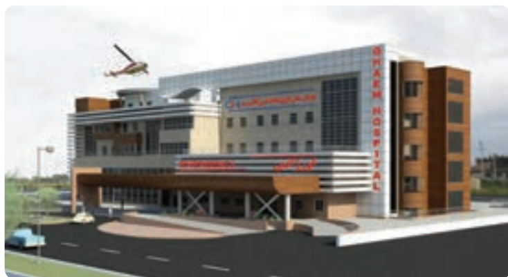
شکل ۱۹-۵ بیمارستان فوق تخصصی بین‌المللی قائم

در قدم اول، تبدیل جاده‌های معمولی به آزادراه یا اتوبان، نقش به‌سزایی در افزایش حجم آمد و شد عبوری، بالا رفتن امنیت مسافران، تقلیل زمان و کاهش تصادفات جاده‌ای دارد و در صورت تحقق اتصال استان به خط راه آهن سراسری، گردشگران زیادی به این استان مسافرت خواهند کرد.