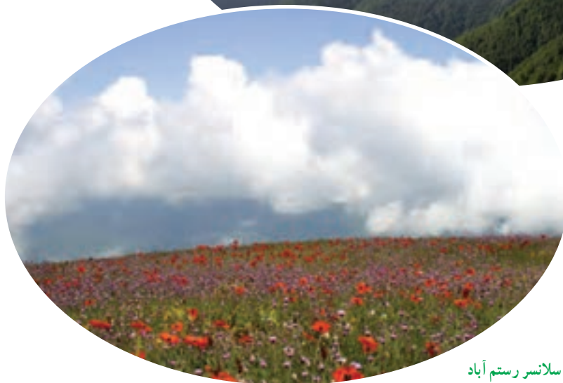
شکل ۴-۵- سلاسر رستم آباد