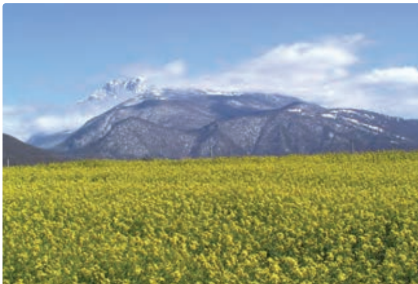
شکل ۲۱-۵. کشت دانه‌های کلزا - تهیه روغن نباتی

زمین‌های کوهستانی هم عمدتاً محل کشت غلات (گندم و جو)، گیاهان علوفه‌ای و برخی گیاهان دارویی است.