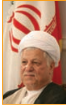
شکل ۱۳-۴ آیت الله هاشمی رفسنجانی