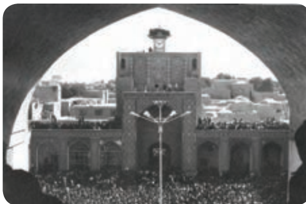
شکل ۴-۷- تجمع مردم در آستانه پیروزی انقلاب در مسجد جامع کرمان