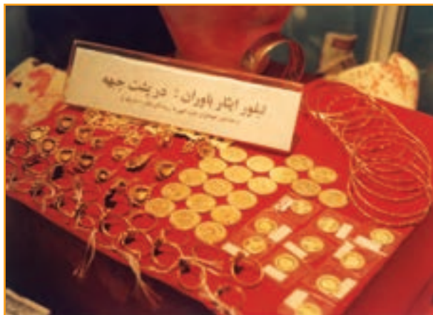
شکل ۳۴-۴- نمونه‌ای از کمک‌های مردم استان کرمان در طول هشت سال دفاع مقدس

استان کرمان در حوزه کمک‌های مردمی سرآمد سایر استان‌های کشور بود. اعزام کاروان‌هایی با بیش از ۳۰۰ دستگاه انواع مختلف خودرو، همراه با حمل کمک‌های مردم شهیدپرور کرمان در نوع خود کم نظیر بود.