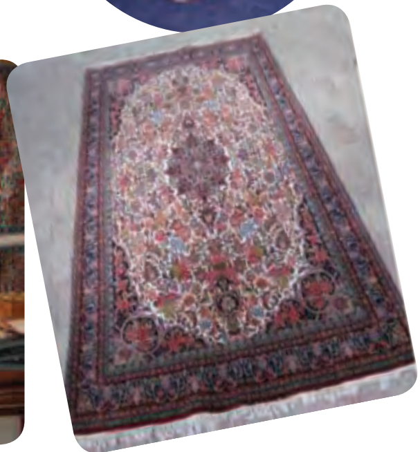
شکل ۶-۳- نمونه‌هایی از صنایع دستی استان