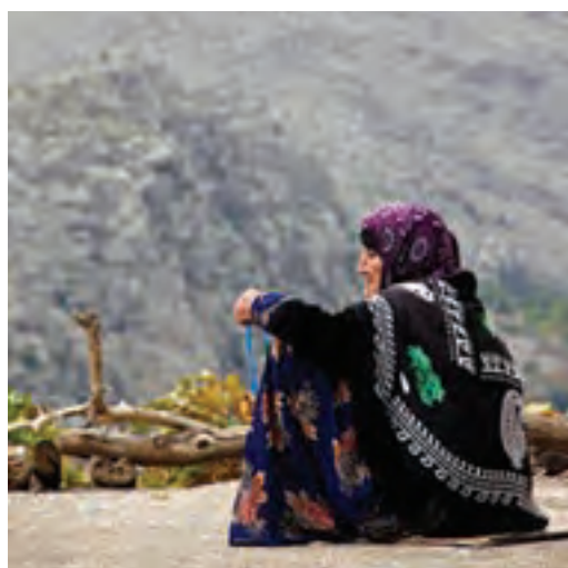
شکل ۲-۳- نمونه‌ای از لباس مردم کرد