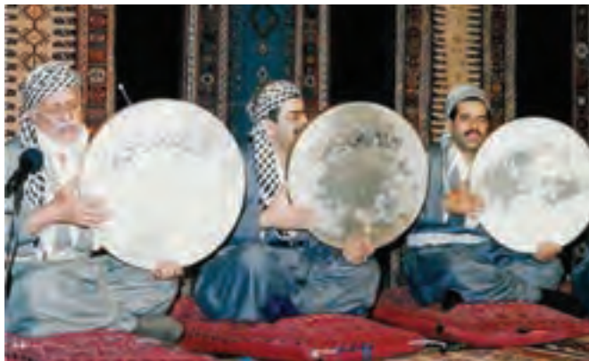
شکل ۳-۳- مولودی خوانی

از مهم‌ترین آیین‌های مذهبی نیز می‌توان به اعیاد فطر و قربان که دارای اهمیت خاصی‌اند، اشاره کرد. همچنین میلاد پیامبر اکرم (ص) به عنوان روزی خجسته همراه با مراسم مولودی خوانی و نواختن دف دارای جایگاه ویژه‌ای در میان مردم استان است که در تمام طول ماه ربیع‌الاول برگزار می‌شود. گذشته از آن، جشن معراج پیامبر و شب برات (جشن نیمه شعبان) نیز جزء اعیاد باشکوه این منطقه است.