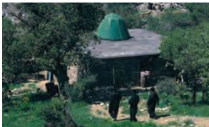
شکل ۴-۳- مقبره پیر شالیار در هورامان تخت - سروآباد