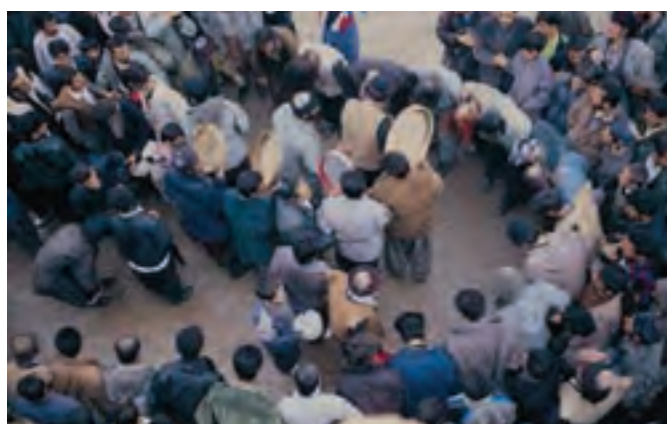
شکل ۵-۳- مراسم آیینی عرفانی پیر شالیار تخت - سروآباد

مراسم پیرشالیار در میان مردم کردستان به ویژه منطقه هورامان از جایگاه خاصی برخوردار است و ریشه در باورهای دینی مردم منطقه دارد. این مراسم بسیار کهن که تحت عنوان «چه‌ژنه و پیری» (عروسی پیر شالیار) است، در هفته دوم بهمن ماه که مصادف با جشن سده است، طی مراحل و رسومات خاصی در روستای هورامان تخت برگزار می‌شود و ادامه آن نیز در نیمه فصل بهار مصادف با ۱۵ اردیبهشت در آرامگاه پیرشالیار (تزدیکی روستای هورامان تخت)، تحت عنوان مراسم «کومسای» برگزار می‌شود. گفتنی است که بازدید از این مراسم اکنون جنبه کشوری و حتی بین‌المللی پیدا کرده است؛ به طوری که جمع کثیری از علاقه‌مندان، روزنامه‌نگاران و محققان داخلی و خارجی به هنگام برگزاری مراسم در میان بازدیدکنندگان دیده می‌شوند.