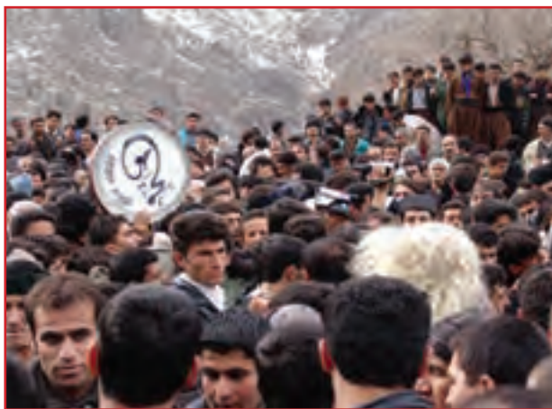
شکل ۱-۳- بخش‌هایی از ویژگی‌های فرهنگی کردها

از جاذبه‌های مهم استان کردستان ویژگی‌های فرهنگی کم‌نظیر آن است. این ویژگی‌ها بیشتر در عناصر فرهنگی همانند زبان، لباس، موسیقی، جشن‌ها، مراسم خاص و صنایع دستی نمایان شده و به صورت پویا در زندگی مردم جاری‌اند. این عناصر هویت ما را تشکیل می‌دهند. در این درس می‌خواهیم شما را با مهم‌ترین ویژگی‌های فرهنگی مردم کردستان آشنا کنیم.