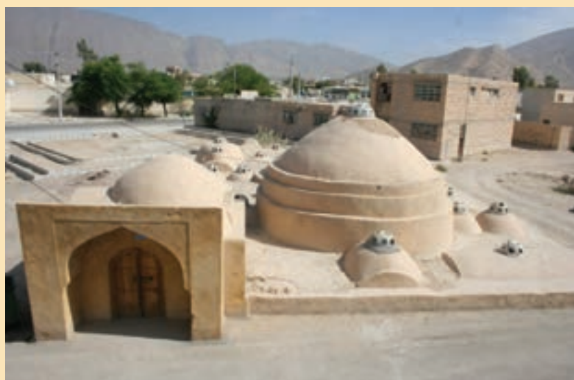
شکل ۹-۴- حمام خان بستک

حمام خان بستک معروف به حمام خان از آثار تاریخی دوره قاجاریه است که در زمان حاکم ولایت جهانگیریه صولت الملک بستکی ( محمدتقی خان صولت بستکی ) به دستور ایشان توسط بناها و معماران چیره دست منطقه بستک و با نظارت استاد و معماری شیرازی ساخته شده است.