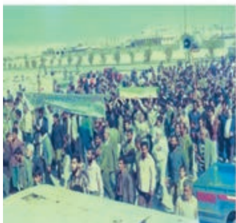
حضور و حمایت مردم در اوایل انقلاب