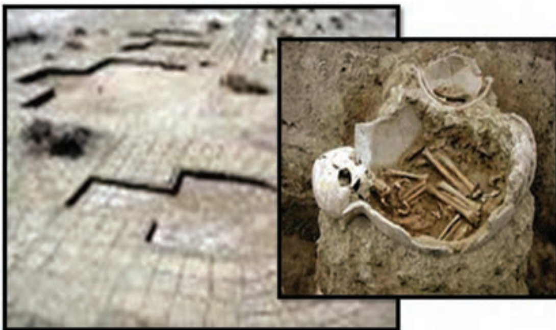
شکل ۵-۴- گورهای خمره‌ای دوره اشکانی قلعه نخل ابراهیمی میناب

اشکانیان : اشکانیان پس از چیرگی بر جانشینان اسکندر، کرانه‌های خلیج فارس، از جمله استان هرمزگان را در منطقه هرمز کهنه یا میناب امروزی و منطقه رودخانه و تپه موران در شهرستان رودان به عنوان پایگاهی برای خود قرار داده و بر قلمرو خود افزودند و در برابر رومیان از دریای پارس و بین‌النهرین پاسداری کردند. سپس به دلیل ضعف و سستی دولت اشکانی در اوایل قرن سوم میلادی، دسته‌هایی از اعراب بادیه نشین شبه جزیره عربستان، دست‌اندازی به کرانه‌های جنوبی خلیج فارس را آغاز کردند.