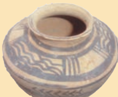
شکل ۱-۴- سفالینه هزاره سوم قبل از میلاد در شهرستان رودان