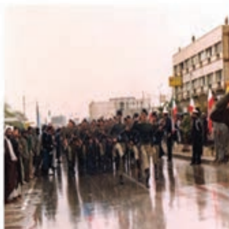
اعلام آمادگی ارتش در ابتدای جنگ

با آغاز تجاوز ناجوانمردانه دولت بعثی عراق در آخرین روز شهریورماه ۱۳۵۹ به کشور، مردم دریادل هرمزگان در کنار سایر هموطنان به دفاع از مرز و بوم خود، به خصوص مرزهای دریایی کشور برخاستند. در همان روزهای نخست جنگ، نیروهای مسلح مستقر در استان در جبهه نبرد حق علیه باطل حضور یافتند. در مدت کوتاهی سپاه پاسداران انقلاب اسلامی به همراهی نیروهای داوطلب بسیجی اقدام به تشکیل واحدهای مهم نظامی در قالب لشکر ثارالله و گردان ۴۲۲ در بسیاری از عملیات‌های پدافند و آفندی، نقش بسیار مهمی داشتند. در جریان دفاع مقدس استان هرمزگان بیش از ۳۷۹۲ هزار شهید و مفقود و هزاران جانباز به میهن اسلامی تقدیم کرد.