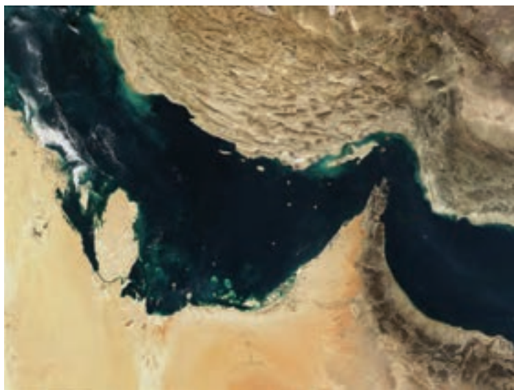
شکل ۱۳-۴- تنگه هرمز