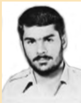
شهید یوسف دقت