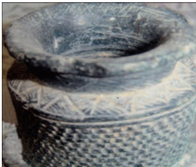
شکل ۲-۴- ظرف سفالی، تپه مورو

ایلامی ها : ایلامی ها از هزاره سوم پیش از میلاد، صدها سال از خلیج فارس به عنوان راه ارتباطی و از بندرها و جزیره های استان هرمزگان به ویژه جزیره های قشم، کیش، لارک و نیز بندرلنگه و جاسک برای بازرگانی با هند باختری و دره نیل استفاده می کردند.