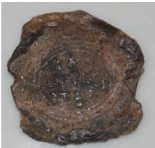
شکل ۴-۶- نمونه سکه دوره ساسانی، حوزه خلیج فارس

ساسانیان : با پیروزی ساسانیان بر اشکانیان در حدود ۲۲۶ میلادی اردشیر بابکان اعراب را از کرانه‌های جنوبی خلیج فارس و بحرین که در آن «حجر» نامیده می‌شد بیرون کرد. ساسانیان به منظور کنترل و حفظ شبکه ارتباطی تجاری بین چین و هند با مدیترانه به هرمزگان و جزایر آن توجه خاصی داشتند. در زمان ساسانیان، هرمز از مراکز مهم داد و ستد و بیوند بازرگانی به شمار می‌رفته است. اردشیر شهر هرمز کهنه یا میناب امروزی را پایگاه تجاری و دریایی خود کرد و بر رونق آن افزود و بدین ترتیب، موفق شدند سرتاسر این منطقه را تحت نظر بگیرند و قلمرو خود را تا سواحل جنوبی خلیج فارس گسترش دهد. سکه‌های نقره پیدا شده از روزگار ساسانی در سورو، نشان از اهمیت این منطقه در زمان ساسانیان می‌دهد.