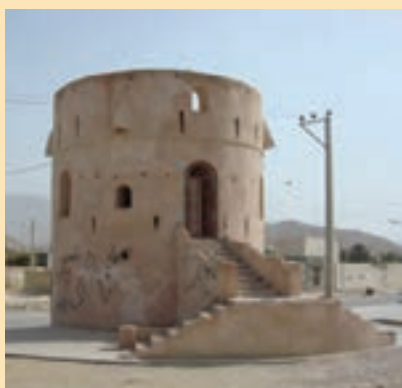
شکل ۱۲-۴- برج تاریخی در شهرستان خمیر