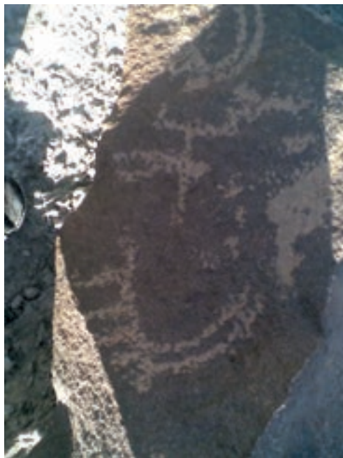
شکل ۱-۴- سنگ نگاره‌های بادافشان رودان

هرمزگان پیشینه تاریخی طولانی دارد. سابقه تمدن در این استان به دوره اسطوره‌ها و افسانه‌ها بر می‌گردد. ساکنان باستانی آن از نخستین انسان‌هایی بوده‌اند که به دریانوردی و کشتی‌سازی پرداختند. استان هرمزگان همواره به سبب واقع شدن در خلیج فارس و دریای مکران راه‌های تجاری و اقتصادی و حفاظت از تنگه استراتژیک هرمز و حفظ تمامیت ارضی ایران به خصوص جزایر سه‌گانه (ابوموسی، تنب بزرگ و تنب کوچک) در خلیج فارس نشان از اهمیت زیاد استان هرمزگان در تاریخ ایران است.