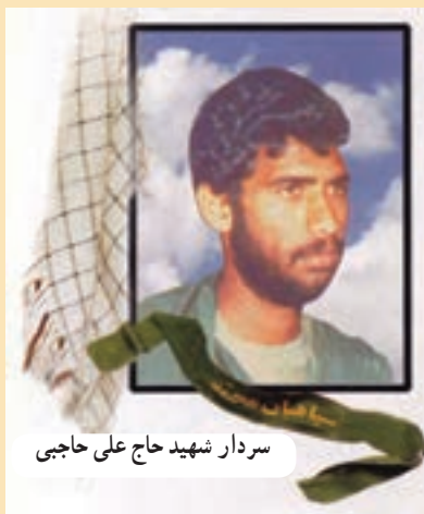
سردار شهید حاج علی حاجبی

سردار شهید اسلام حاج علی حاجبی یکی از نیروهایی بود که با شروع جنگ تحمیلی و تشکیل لشکر ۴۱ ثارالله به این لشکر ملحق شد و جانشینی و مسئولیت ستاد لشکر ۴۱ ثارالله را به عهده گرفت. او در تاریخ ۱۳۶۵/۰۴/۱۰ در عملیات کربلای ۱ در منطقه قلاویزان به شهادت رسید.