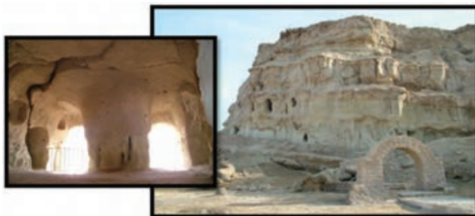
شکل ۳-۴- نمای بیرونی و درونی نیایشگاه خربس

مادها : پس از سقوط آشوریان سرانجام مادهای آریایی نژاد در آغاز سده هشتم پیش از میلاد در روزگار پادشاهی هوخشتره هرمزگان را تصرف کردند. نشانه هایی از آیین میترا پرستی و معابدی وجود دارد که نیایشگاه باستانی خربس در جزیره قشم گواه ادعاست.