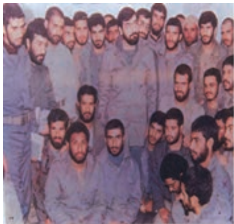
حضور نیروهای مردمی در جبهه جنگ