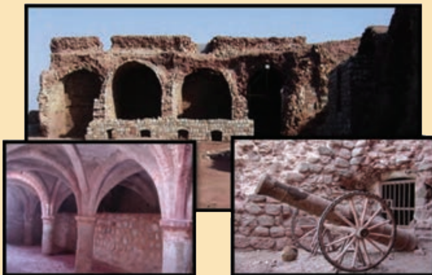
شکل ۷-۴ - قلعه پرتغالی‌ها در جزیره هرمز

قلعه پرتغالی‌ها در ضلع شمالی جزیره هرمز و در ساحل دریا قرار دارد که مهم‌ترین قلعه باقی مانده از روزگار تسلط پرتغالی‌ها بر سواحل جزایر خلیج فارس است. این قلعه که به فرمان آلفونسو آلبوکرک دریانورد پرتغالی در سال ۱۵۰۷ میلادی، در محلی موسوم به مورنا احداث شده، به لحاظ ساختار این قلعه به شکل چند ضلعی نامنظم است و از بنای بسیار محکمی برخوردار است. این بنا دیوارهایی به قطر 5/3 متر با چند برج به ارتفاع ۱۲ متر دارد و تأسیسات آن شامل انبارهای تسلیحات، آب انبار و اتاق‌هایی با سقف هلالی است. در زمان شاه عباس که به استعمار پرتغالی‌ها در ایران خاتمه داده شد، این قلعه به دست امام قلی خان از سرداران شاه عباس فتح گردید.