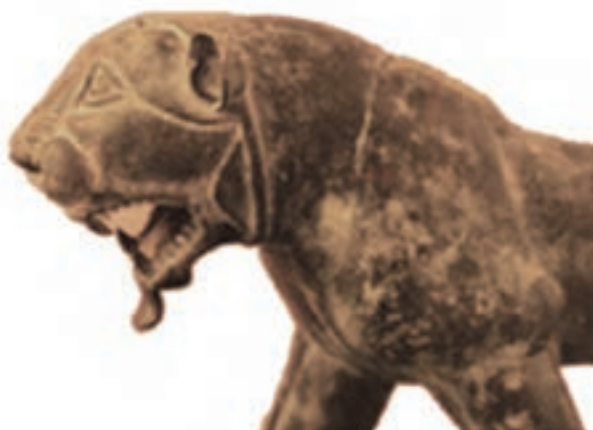
شکل ۴-۴- شیر سنگی دوره هخامنشیان در فارغان

هخامنشیان : در روزگار هخامنشی به ویژه داریوش بزرگ کرانه‌های ایران از جمله استان هرمزگان زیر فرمانروایی این سلسله افتاد و داریوش بزرگ دریا سالار یونانی خود به نام اسکیلادس را در بازگشت از هند مأمور بررسی کناره‌های دریای پارس کرد. در این زمان، هرمزگان جزء ساتراپ نشین پارس بوده است. پس از شکست ایرانیان از اسکندر مقدونی او دریانوردی به نام نثارک (نثارکوس) را روانه خلیج فارس کرد. وی هنگام عبور از نزدیکی بندری به نام آموزیا (هرمز کهنه) خبر داد که در پی آن سلوکیان این منطقه را تحت نفوذ زمامداران خود در آوردند.