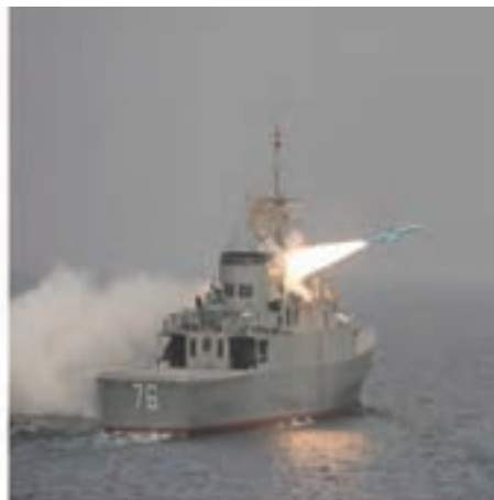
ناو جنگی در خلیج فارس