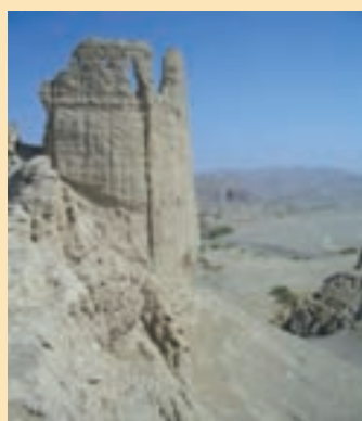
شکل ۱۱-۴- قلعه هزاره در شهرستان میناب