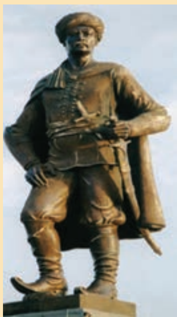
شکل ۸-۴- امام قلی خان

امام قلی خان فرزند الله‌وردی خان به‌عنوان فرمانده سپاه شاه عباس صفوی فتوحات مهمی در تاریخ کشور ایران انجام داد؛ از جمله فتح قشم، هرمز و بندرعباس و اخراج پرتغالی‌ها مرهون رشادت‌های او می‌باشد.