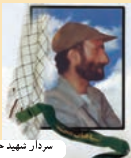
سردار شهید حسن ذاکری

سردار شهید اسلام حسن ذاکری نانگی در سال ۱۳۵۰ به فعالیت های مسلحانه علیه رژیم شاه پرداخت. با پیروزی انقلاب اسلامی از اولین افراد تشکیل دهنده کمیته های انقلاب و سپس سپاه پاسداران بندرعباس بود و در شورای فرماندهی سپاه نقش اساسی را به عهده داشت. وی در روزهای آغازین جنگ تحمیلی، اولین گروه اعزامی از استان را سازماندهی کرد و به جبهه های نبرد شتافت و در ۱۳۵۹/۰۸/۲۳ در عملیات طریق القدس در سوسنگرد به شهادت رسید.