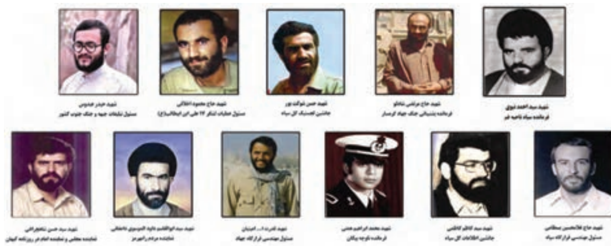
شکل ۹-۴. تعدادی از شهدای والامقام و شاخص استان در جنگ تحمیلی عراق علیه ایران

نتیجه این که رده استان را بین اول تا سوم کشور با اختلاف بسیار زیاد میانگین از کشور.