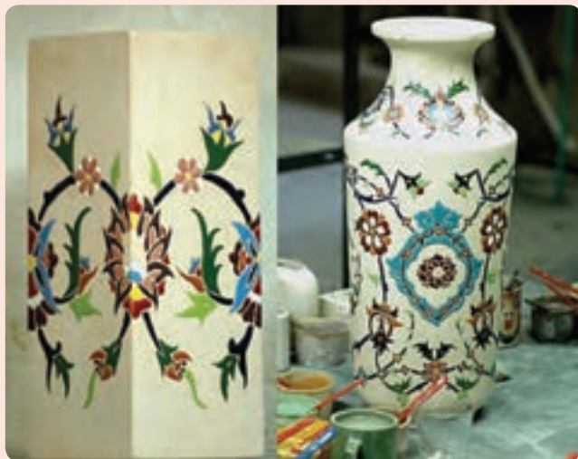
شکل ۳-۶ دو نمونه از صنایع دستی استان

مهم‌ترین و قدیمی‌ترین دست ساخته‌های بشر است. آثار سفالی برخلاف آثار یافته شده فلزی و چوبی در زیر خاک فاسد نمی‌شود و به خاطر این ویژگی به اطلاعات گویایی درباره صنایع دستی اقوام گذشته می‌توان پی برد. صنعت سفالگری در استان سمنان از قدمت بالایی برخوردار است. به‌طوری که دکتر اریک اشمیت هنگام حفاری در اطراف دامغان امیدوار به کشف شهر افسانه‌ای هکاتوم پلیس یا شهر صد دروازه بود، اگرچه موفق به کشف بقایای شهر مورد نظرش