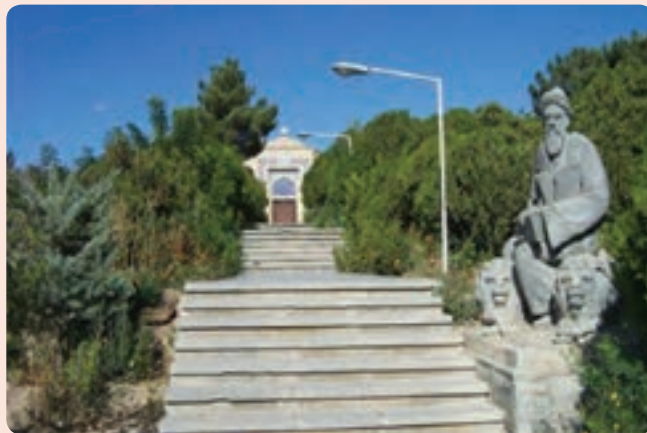
شکل ۱۲-۴- آرامگاه عارف نامی شیخ ابوالحسن خرقانی روستای خرقان در شهرستان شاهرود

تحصیل، به تزکیه نفس اهتمام ورزید و با مجاهدت به مقام های شایانی دست یافت. از جمله رسالاتی که به ایشان منسوب است، نورالعلوم است. این عارف بزرگ در سال ۴۲۵ هجری قمری در هفتاد و سه سالگی در روستای خرقان بسطام دیده از جهان فرو بست.