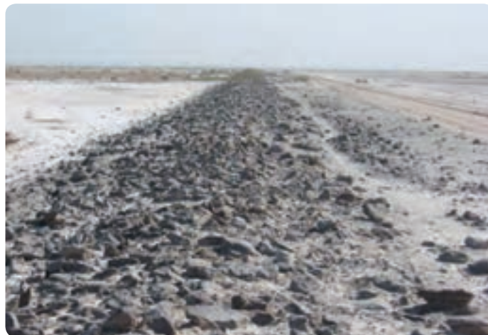
شکل ۲-۴- جاده سنگ فرش جهت عبور کاروان ها در جنوب گرمسار