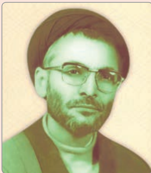
شکل ۱۴-۴ — شهید حجت‌الاسلام سید کاظم موسوی

این شاعر طبیعت‌سرا و تیزهوش به زبان‌های فارسی و عربی تسلط داشته و از شعرای عرب نیز در اشعار خود تأثیر پذیرفت. این شاعر پرآوازه ادبیات ایران در سال ۴۳۲ هجری قمری از دنیا رفت.