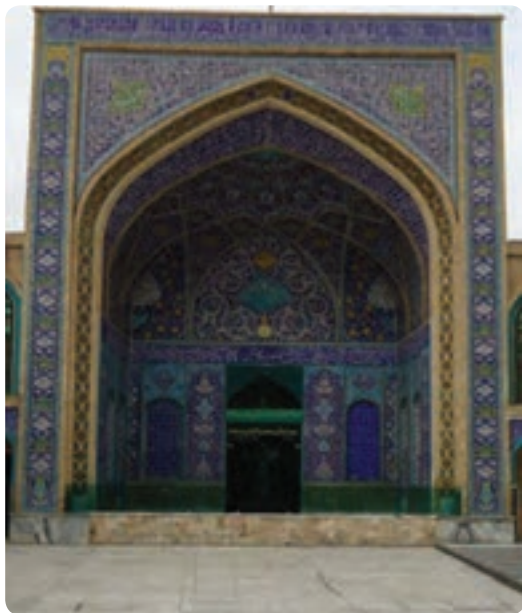
شکل ۳-۴ — مرقد مطهر یحیی بن موسی بن جعفر (ع) در شهر سمنان