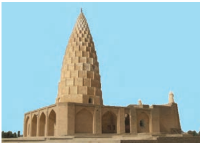
شکل ۱۹-۴- آرامگاه یعقوب لیث صفاری - دزفول