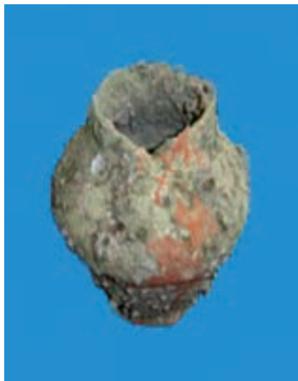
شکل ۱۳-۴- سفال (پیش از اسلام) ساحل خلیج فارس (ماهشهر)

با تأسیس دانشگاه بزرگ جندی شاپور که دانشمندانی از کشورهای دیگر نیز در آن تدریس می‌کردند، زمینه گسترش علم و دانش فراهم شد. از این دوره در شهرهای شمالی استان مانند شوشتر و دزفول آثار زیادی برجای مانده است.