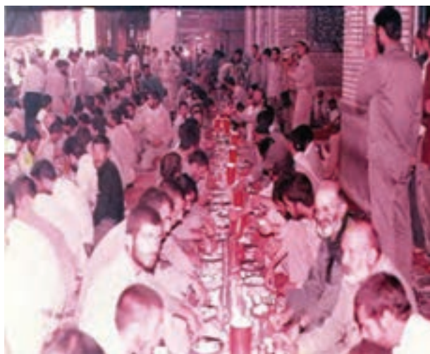
شکل ۲۹-۴ پذیرایی از رزمندگان اسلام در ایستگاه صلواتی

در چهارم آبان سال ۶۲ در حمله موشکی رژیم بعثی عراق به مدرسه راهنمایی شهید پیروز بهبهان ۷۵ دانش آموز و معلم به شهادت رسیدند.