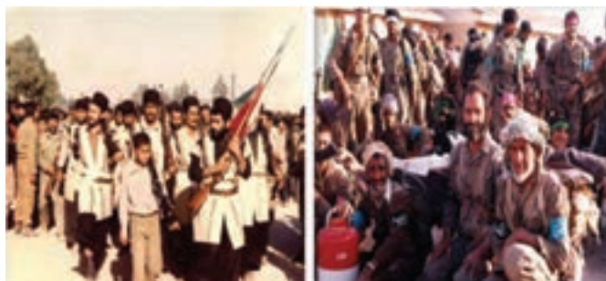
شکل ۲۵-۴- حضور عشایر و نیروهای مردمی در دفاع مقدس

مردم غیور استان به‌ویژه عشایر سلحشور و اهالی شهرهای مرزی با تمام توان به کمک نیروهای مسلح علیه متجاوزان وارد صحنه شدند.