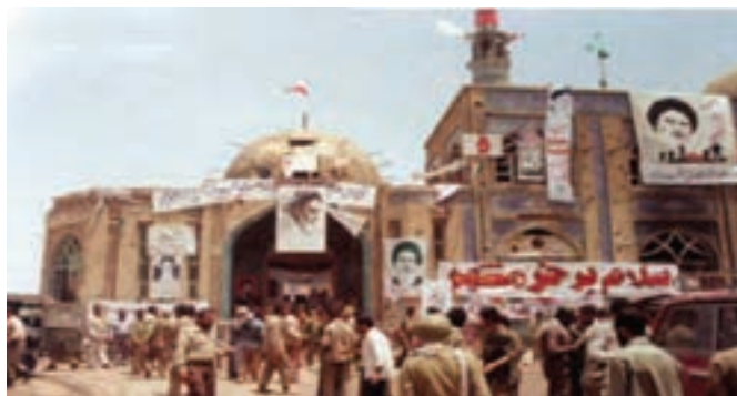
شکل ۲۳-۴- مسجد جامع خرمشهر سوم خرداد ۱۳۶۱

نیروهای بعضی که در خیال خود قصد تصرف چند روزه خوزستان را داشتند با مقاومت جانانه و فداکاری بی نظیر مردم مواجه شدند. مقاومت ۳۵ روزه مدافعان خرمشهر موجب شد متجاوزان طعم تلخ شکست را در مقابل مردم فداکار و شجاع ایران اسلامی احساس کنند. حماسه مقاومت مردم شهرهای خرمشهر و آبادان در مقابله با متجاوزان باعث شگفتی جهانیان و جلوگیری از دستیابی عراق به سایر اهداف اعلام شد.