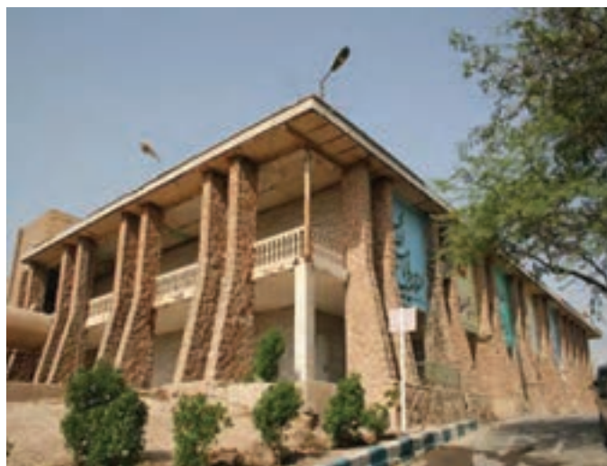
شکل ۳۰-۴. ساختمان گلف در اهواز