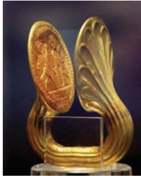
شکل ۴-۵- حلقه قدرت (دوره ایلامی) - بهبهان

آثار باستانی تمدن ایلام از دوره قاجار مورد کاوش قرار گرفت و امروزه اشیای گرانبهایی که هر یک روشنگر بخشی از فرهنگ و تمدن دیرینه استان است زینت بخش موزه‌های داخل و خارج از کشور است. موزه‌های شوش و هفت تپه تعدادی از اشیای این دوره را در خود جای داده‌اند. در موزه لوور پاریس نیز بخش مهمی از آثار تمدن ایلام نگهداری می‌شود.