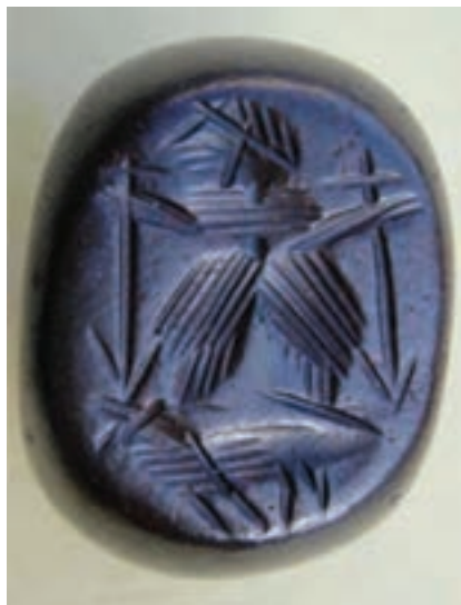
شکل ۱۴-۴- مهر تجاری دوره ساسانی - همدان

استان ما در دوره ساسانیان پیشرفت زیادی نمود. سدها، بندها، پل‌ها و آسیاب‌های آبی ساخته شد و چند شهر نیز بنا شد. تجارت با کشورهای همسایه از مسیرهای آبی و زمینی رونق یافت.