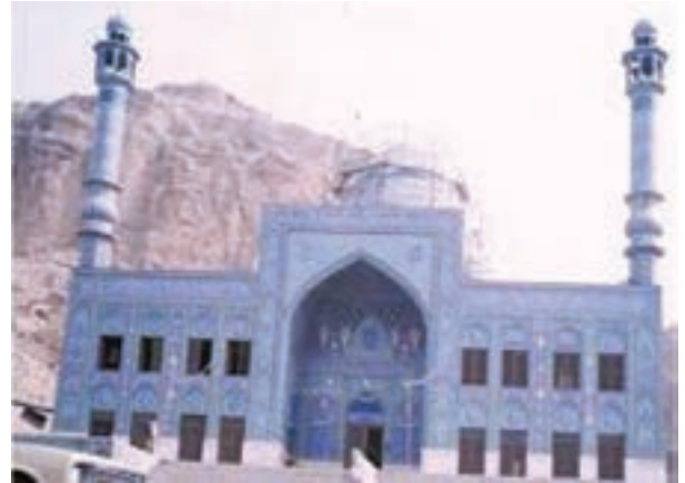
شکل ۱۷-۴- امامزاده محمد بن زید - گتوند

استان در قرون اولیه اسلامی از رونق و شکوفایی برخوردار بود. جغرافی دانان مسلمان در این دوره از فراوانی محصولات کشاورزی، تولید منسوجات گرانبها و استخراج معادنی مانند طلا و مس در خوزستان یاد کرده اند. در شوشتر، پارچه های ابریشمی (دیبا) که شهرت بسیار داشت تولید می شد و تا چند قرن پوشش خانه کعبه را از این شهر تهیه می کردند.