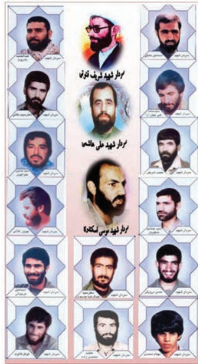
شکل ۳۶-۴- جمعی از سرداران شهید استان