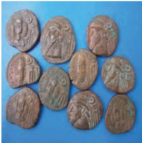
شکل ۱۲-۴ سکه‌های الیمائید

حکومت جانشینان اسکندر (سلوکیان) مدت زیادی دوام نیافت. هم زمان با تشکیل حکومت اشکانیان، در استان ما نیز دولتی محلی و نیمه مستقل به نام «الیمائید» به وجود آمد. این دولت که مرکز آن در ایذه قرار داشت تا به قدرت رسیدن ساسانیان ادامه یافت. آثار زیادی از آنها به ویژه در شوشتر باقی مانده است.