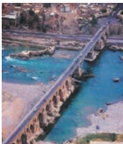
شکل ۱۵-۴- پل دوره ساسانی (دزفول)