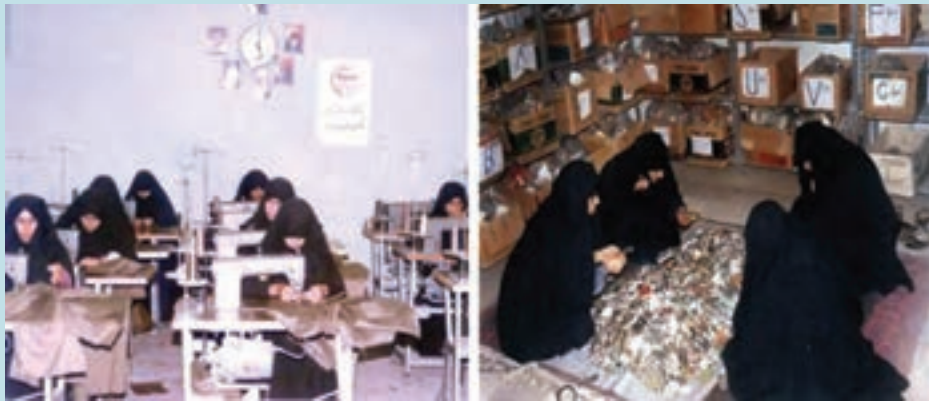
شکل ۳۲-۴- نقش بانوان استان در جنگ

از افتخارات یگان‌های هوایی استان می‌توان به عملیات‌های درون مرزی و بیرون مرزی متعدد اشاره کرد که با تقدیم ده‌ها شهید، جانباز و آزاده همراه بود.