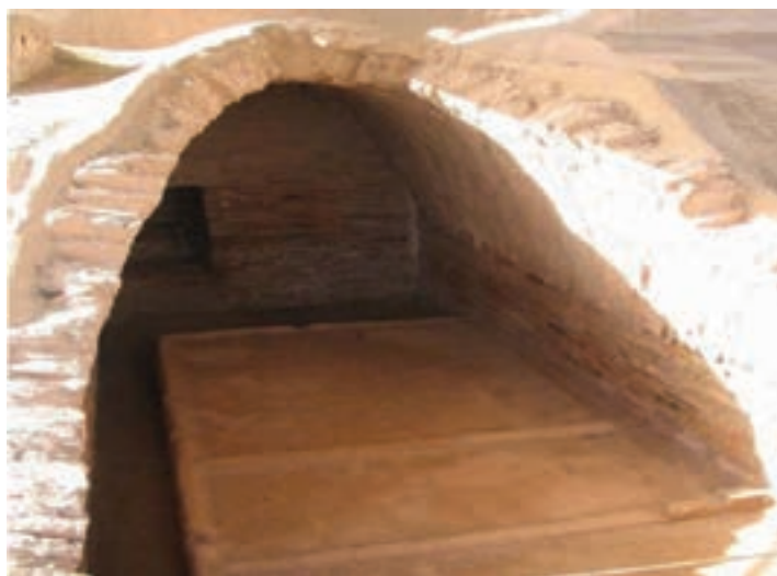
شکل ۳-۴- مقبره پادشاه ایلامی - هفت تپه