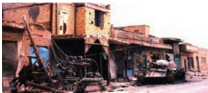
شکل ۲۴-۴- انهدام تانک دشمن در سوسنگرد

حماسه مدافعان سوسنگرد با هدایت حضرت آیت الله خامنه‌ای و شهید چمران در ۲۶ آبان ۱۳۵۹ برای شکستن محاصره این شهر، از نقاط برجسته روزهای آغاز جنگ است که این امر باعث جلوگیری از سقوط شهر اهواز شد.