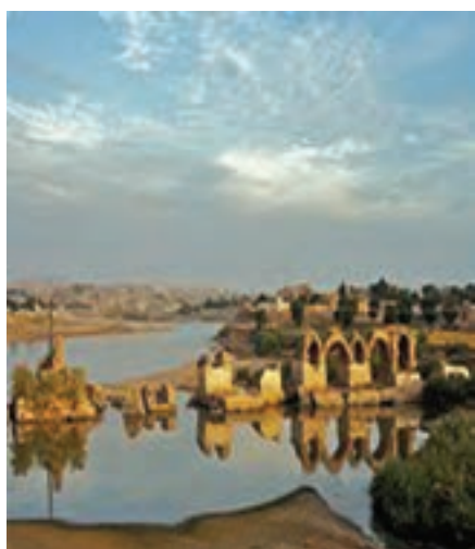
شکل ۱۶-۴- پل و بند شادروان (ساسانی) شوشتر

با تأسیس دانشگاه بزرگ جندی شاپور که دانشمندانی از کشورهای دیگر نیز در آن تدریس می‌کردند، زمینه گسترش علم و دانش فراهم شد. از این دوره در شهرهای شمالی استان مانند شوشتر و دزفول آثار زیادی برجای مانده است.