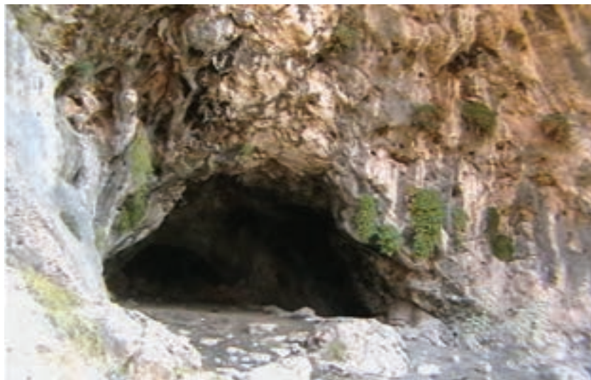
شکل ۱-۴- غار پیده نخستین زیستگاه انسان در استان - لالی

دوره نوسنگی به ۸ تا ۱۰ هزار سال پیش گفته می‌شود. آثار مربوط به انسان‌هایی که در آن زمان زندگی می‌کردند از تپه‌ها و محوطه‌های باستانی اطراف شهرهای شوش، دزفول، هفت‌تپه و... به دست آمده است. این مردم می‌توانستند، از ابزارهای سنگی در زندگی خود استفاده کنند.