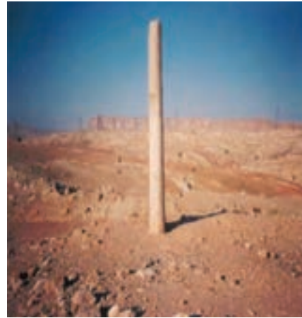
شکل ۹-۴ نیایشگاه بردشانه (اشکانی) - مسجد سلیمان

حکومت جانشینان اسکندر (سلوکیان) مدت زیادی دوام نیافت. هم زمان با تشکیل حکومت اشکانیان، در استان ما نیز دولتی محلی و نیمه مستقل به نام «الیمائید» به وجود آمد. این دولت که مرکز آن در ایذه قرار داشت تا به قدرت رسیدن ساسانیان ادامه یافت. آثار زیادی از آنها به ویژه در شوشتر باقی مانده است.