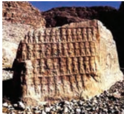
شکل ۴-۷- نقش برجسته کول فره (دوره ایلامی) - ایزه

آثار باستانی تمدن ایلام از دوره قاجار مورد کاوش قرار گرفت و امروزه اشیای گرانبهایی که هر یک روشنگر بخشی از فرهنگ و تمدن دیرینه استان است زینت بخش موزه‌های داخل و خارج از کشور است. موزه‌های شوش و هفت تپه تعدادی از اشیای این دوره را در خود جای داده‌اند. در موزه لوور پاریس نیز بخش مهمی از آثار تمدن ایلام نگهداری می‌شود.