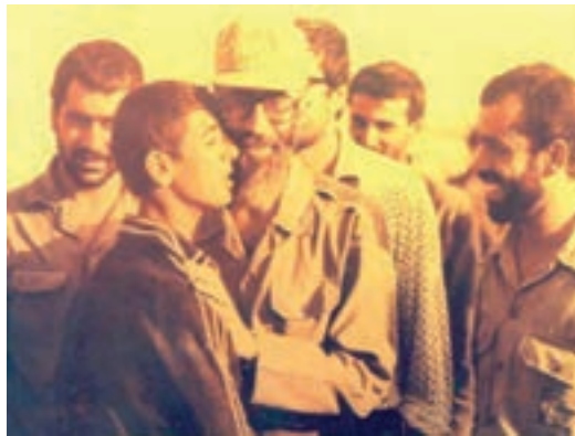
شکل ۲۱-۴- حضرت آیت... خامنه‌ای در جمع مدافعان خرمشهر

پس از پیروزی انقلاب اسلامی در ۲۲ بهمن سال ۱۳۵۷ رژیم دست نشاندۀ بعث عراق اقدامات زیادی را بر علیه ملت ایران انجام داد. تقویت گروه‌های ضد انقلاب و دامن زدن به اختلافات داخلی از جمله کارهای رژیم صدام بر علیه نظام نوپای مردم مسلمان ایران بود. حکومت بعث عراق در ۳۱ شهریور ۱۳۵۹ پس از ماه‌ها تجاوزهای محدود مرزی، حملۀ سراسری را علیه ملت ایران آغاز کرد. در این هجوم گسترده، سرزمین خوزستان با توجّه به موقعیت و اهمیتی که به‌ویژه در اقتصاد ایران داشت بیش از سایر نقاط شاهد لشکرکشی مزدوران بعثی بود. رژیم عراق از سه محور استان ما را مورد تهاجم قرار داد.