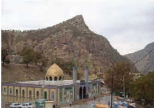
شکل ۱۸-۴- امامزاده عبدالله - صیدون

با ظهور اسلام و ورود سپاهیان مسلمان، مردم استان از دین مبین اسلام استقبال کردند. پس از آن خوزستان به دلیل موقعیت جغرافیایی پناهگاه شیعیان و امام زادگانی شد که از ظلم و جور حکام اموی و عباسی به این سرزمین مهاجرت می کردند.