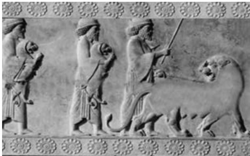
شکل ۸-۴- نمایندگان ایلامی - تخت جمشید

هخامنشیان در کتیبه بیستون نام ایلام را «اوز» یا «هوز» ثبت کرده‌اند. فردوسی در شاهنامه استان خوزستان را «خوزیان» نامیده، نام‌های خوزستان و اهواز نیز از واژه‌ای که در کتیبه بیستون آمده، گرفته شده است.