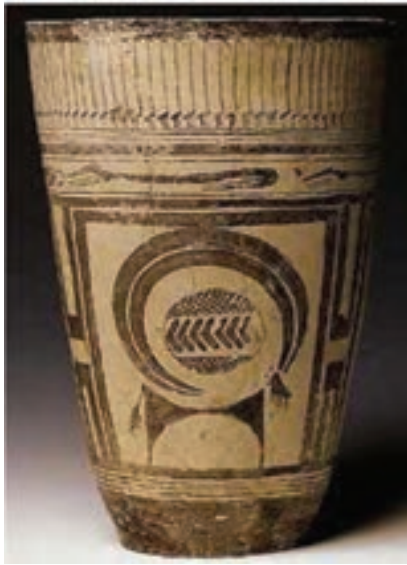
شکل ۴-۶- جام سفالی (دوره ایلامی) - شوش