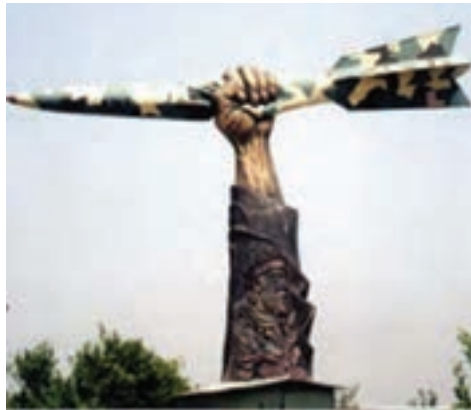
شکل ۲۶-۴- یادمان مقاومت مردم دزفول در مقابل موشک باران

دزفول به علت مقاومت کم نظیر خود در دوران جنگ به عنوان شهر نمونه مقاومت نام گرفت.