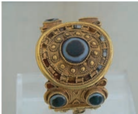
شکل ۴-۴- اشیای گنجینه روستای جوبچی (دوره ایلامی) - رامهرمز