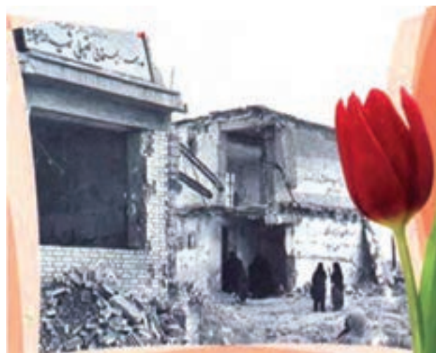
شکل ۲۸-۴ مدرسه راهنمایی شهید پیروز بهبهان پس از موشک باران

مردم استان در دوران جنگ با برپایی ایستگاه‌های صلواتی در شهرها و مناطق عملیاتی از رزمندگان اسلام که عازم جبهه‌ها بودند پذیرایی می‌کردند.