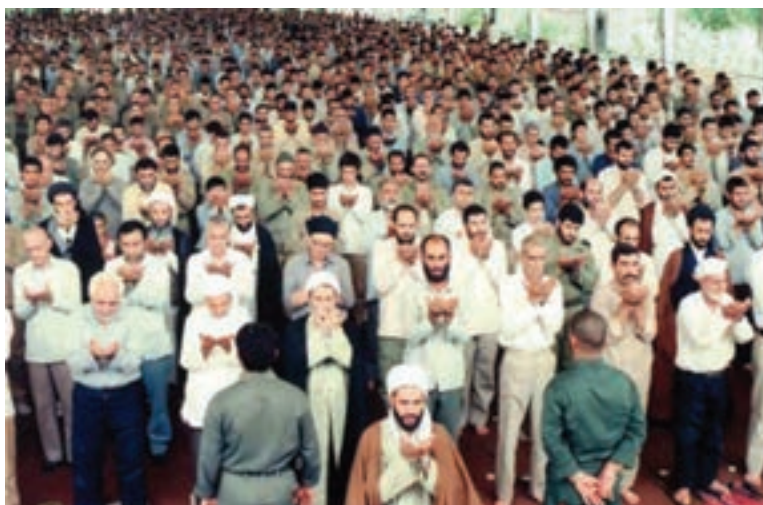
شکل ۳۱-۴. رزمندگان اسلام در نماز جمعه یکی از شهرهای استان

با وجود تهاجم دشمن، مردم با حضور در شهرها و شرکت در نماز جمعه، باعث دلگرمی رزمندگان و ناامیدی متجاوزان شدند.