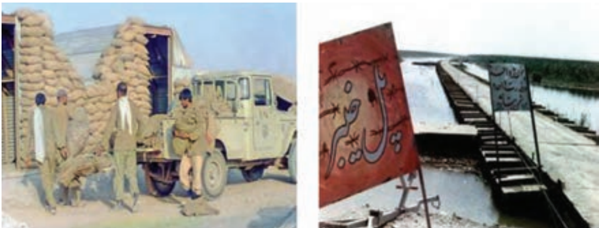
شکل ۲۷-۴- نقش جهادسازندگی (سنگرسازان بی سنگر) در دفاع مقدس

با ادامه جنگ و مقاومت مردم، رژیم عراق برخلاف همه موازین بین‌المللی، مناطق مسکونی، مراکز درمانی، آموزشی و فرهنگی را مورد حمله قرار داد.