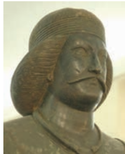
شکل ۱۱-۴ سر مجسمه مرد پارتی - ایذه