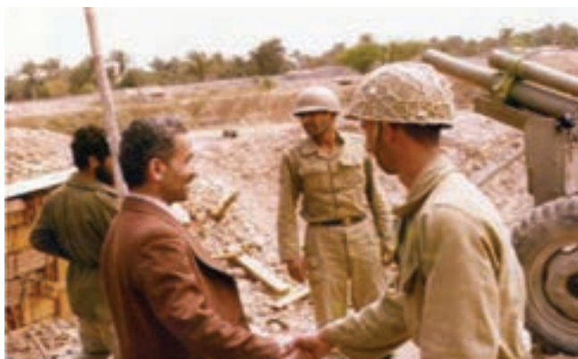
شکل ۳۴-۴- شهید رجایی در جمع رزمندگان اسلام

پس از پذیرش قطعنامه ۵۹۸ توسط جمهوری اسلامی ایران و اتمام رسمی، جنگ، رژیم بعث عراق برای بار دوم از محورهای طلائی و کوشک به استان حمله کرد و در جاده اهواز خرمشهر تا ۴۰ کیلومتری اهواز پیش روی کرد؛ ولی رزمندگان اسلام با رشادت دشمن را تا مرزهای بین المللی عقب راندند.