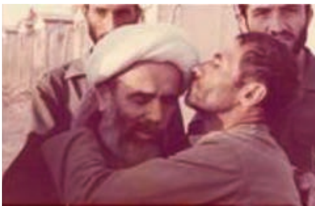
شکل ۳۵-۴- آیت آ... جمی و آیت آ... قاضی در جمع رزمندگان اسلام