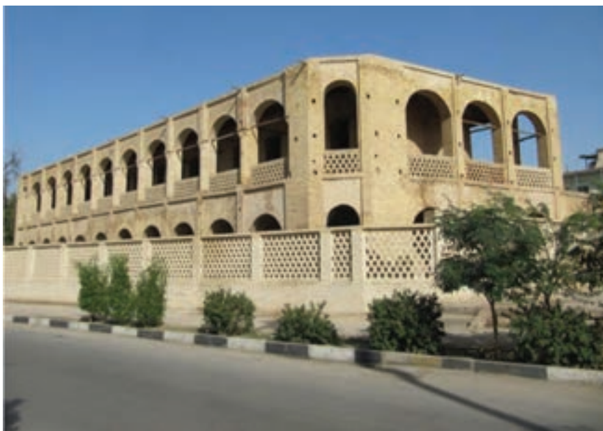
شکل ۲۰-۴ کاروانسرای معین‌التجار دوره قاجاریه (اهواز)

شکل‌گیری جنبش مشروطیت در دوره مظفرالدین‌شاه و سرکوبی آن توسط محمدعلی‌شاه، باعث شد تا عشایر شجاع بختیاری به مقابله با حکومت استبدادی برخیزند. آنها در سقوط حکومت محمدعلی‌شاه نقش مهمی داشتند. یکی دیگر از صحنه‌های حضور خوزستانی‌ها در دفاع از کشور در جنگ جهانی اول روی داد. در این جنگ عشایر غیور (عرب خوزستان) با فتوای علمای مذهبی، در مقابل نیروهای متجاوز انگلیسی دست به مقاومت زده و در این راه، جان خویش را فدا کردند. در سال ۱۹۰۸ م (۱۲۸۷ ش) با کشف نفت در استان، تحولات سیاسی، اقتصادی، اجتماعی و فرهنگی زیادی رخ داد. تغییر چهره شهرها، ایجاد محلات جدید در کنار بافت قدیمی، مهاجرت به شهرها و ایجاد تأسیسات جدید از جمله این پیامدها بود. در این دوره، سیاست انگلیس در استان ارتباط با افراد با نفوذ محلی و حمایت از آنها بود. یکی از کسانی که مورد حمایت انگلیس قرار گرفت شیخ خزعل بود که توانست به تدریج حوزه نفوذ خود را گسترش داده و بخش جنوبی و مرکز استان را زیر سلطه خود در آورد. با تغییر سیاست انگلیس شیخ خزعل توسط رضا شاه دستگیر و مدتی بعد به قتل رسید.