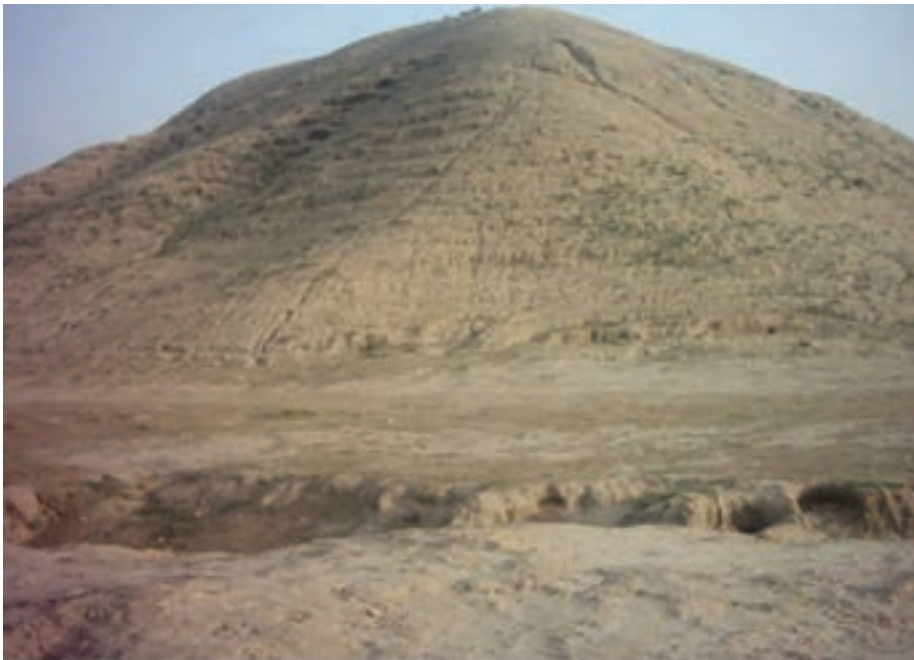
شکل ۲-۴- تپه باستانی چغامیش - دزفول

با وجود ویرانگری‌های اقوام مهاجم، آثار و اشیای به جای مانده، بیانگر رونق و شکوفایی آن عصر است. مهارت، ذوق و خلاقیت در زمینه‌های مختلف از جمله معماری، سفالگری و ذوب فلزات از ویژگی مردم استان، در این دوره بود.