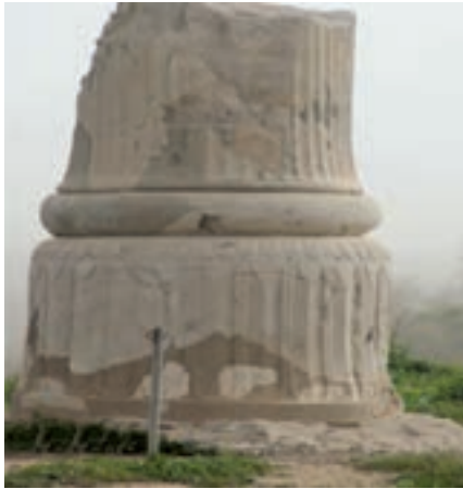
شکل ۱۰-۴ پایۀ ستون (هخامنشی) - شوش